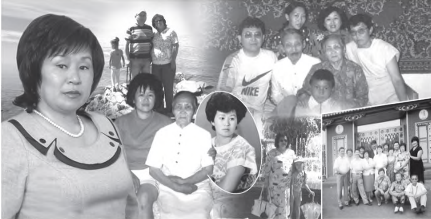
А. БАТОМУНКУЕВАЙ ФОТОКОЛЛАЖ

аймагай Аргата нютагайхид энэ абгайн дундаршагүй нигүүлэсхы найхан сэдьхэл, хүниие хайрлаха, дүнгэхэ, бодомгой гүн ухаань үндэр сэгнэдэг бэлэй. Иимэ найхан хүгшэн эжы бурханай үршөөлөөр Света басаганда үгтэһэн юм.