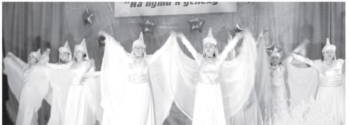
Уян басагад хун шубуудай хатар гүйсэдхэнэ

Хүмүүжүүлгын болон эрдэмэй-методическа талаар директорэй орлогшоор хүдэлһэн дүй дүршэлынь, мэргэжэлэйн бэлиг шадабаринь энэ конкурсно эли харагдаа. Энэ багша ороной ниислэл Москва хотодо үнгэргэгдэхэ мэргэжэлэй конкурсно хабаадаха ёһотой.