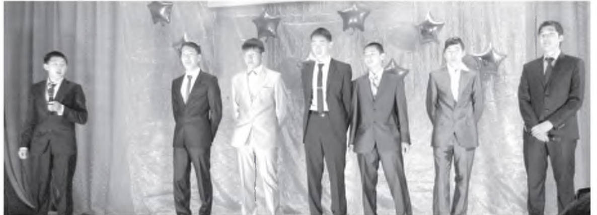
хургуулийн КВН-эй бүлэг