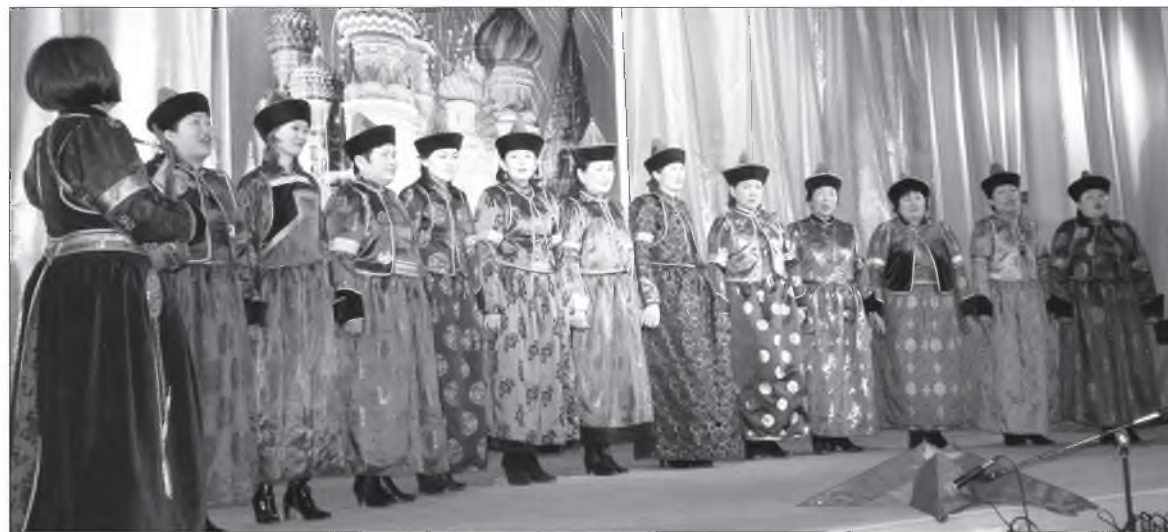
Ивалгын багшанарай фольклорно бүлгэм