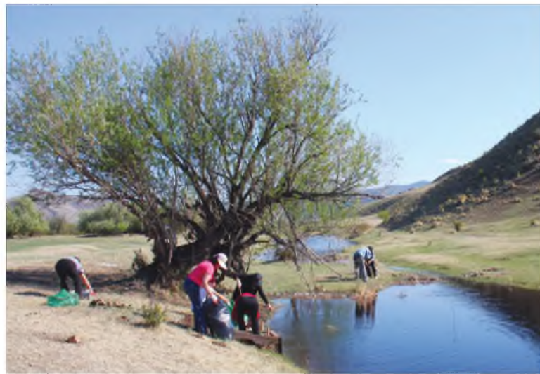
Уһан сооһоошье бог урьхадажа абагдаа