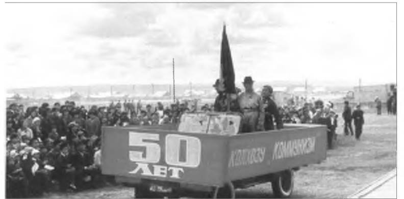
Ойн баярай үе