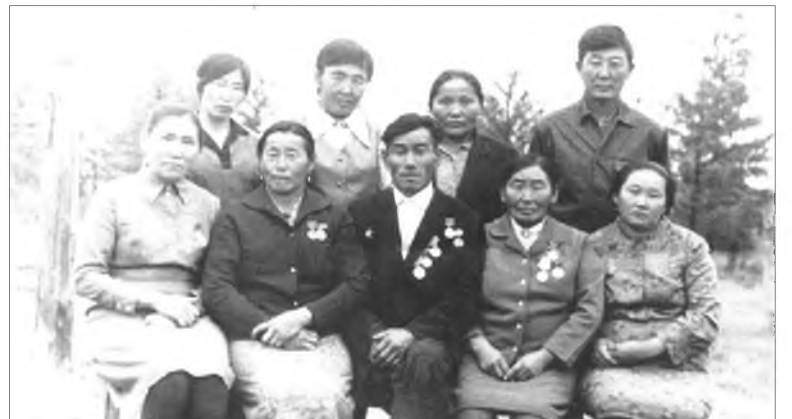
Хуһан-Хушуунай фермын ажалшад