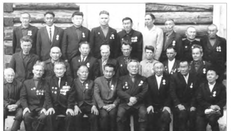
Дайнай болон ажалай ветеранууд. 1969 он