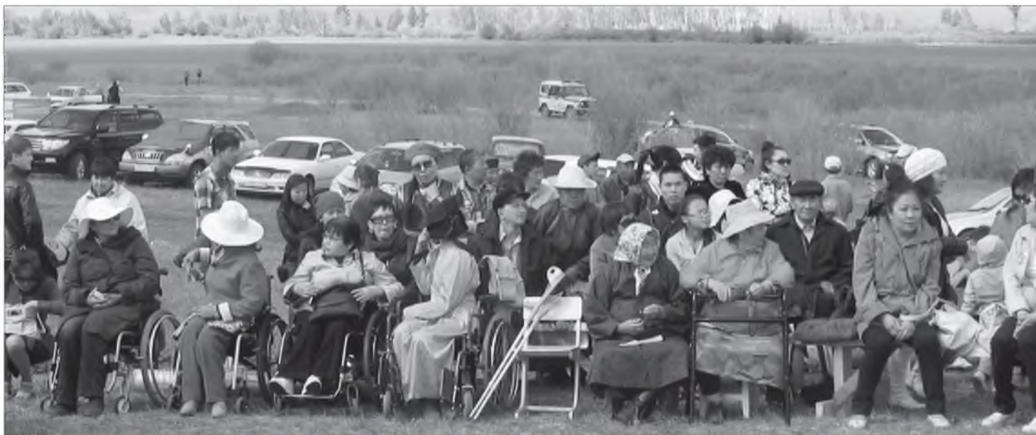
Маарагтын талада буян үйлэдэбэ