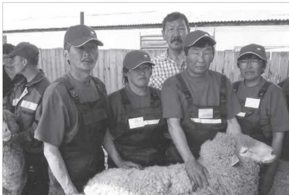
Ульдэргынхид үүлтэртэ хонидой выставкэдэ (Шэтэ хото).