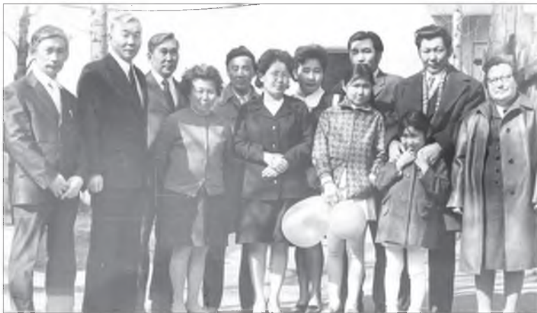
Редакциин хүдэлмэрилэгшэд (1974).