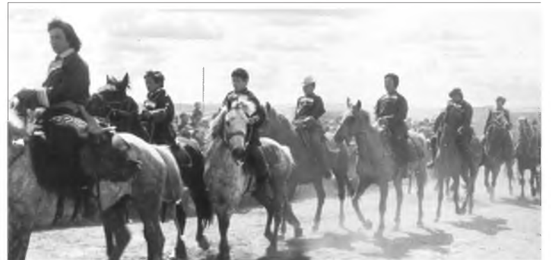
Моришодой һайндэрэй жагсаал. 1981 он