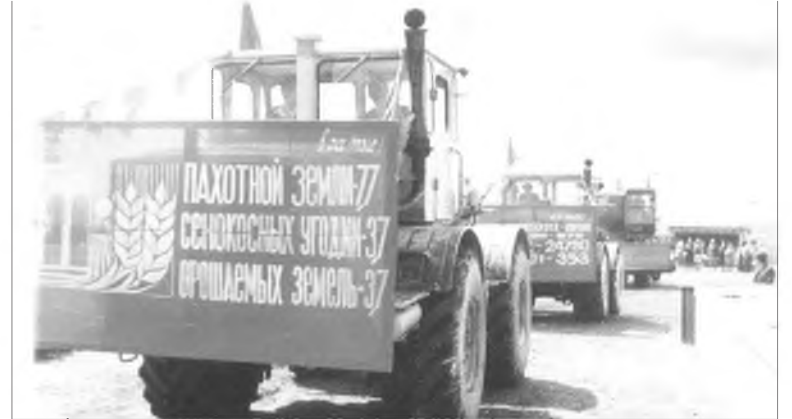
«Коммунизм» колхозой байгуулагдаһаар 50 жэлэй ойн жагсаалһаа. 1981 он