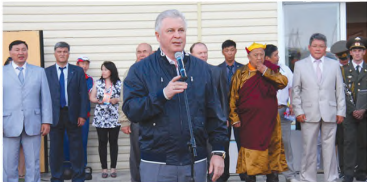
В.Наговицын амаршалгын үгэ хэлэнэ

Ү нгэрхэн долоон хоногой дүрбэн үдэрэй туршада Буряад Республикын 19 хүдөө аймагуудай мянга гаран тамиршад Ивалгын аймагай Иволгинск түб хууринда уулзажа, түмэн зоной хабаадалгатайгаар республикын XIY хүдөөгэй зунай спортын наадануудта хабаадабад.