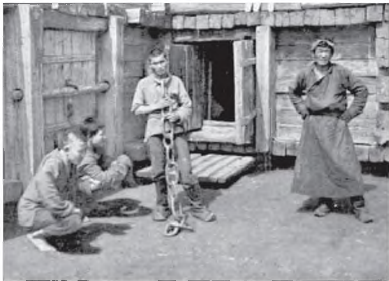
A LAMA IN CHAINS IN A MONGOLIAN PRISON

Урга хотын Гандан дасанай ойро оршодог субаргануудай дэргэдэ лама хүн буулгаданхай. 1913 оной июлиин 23.