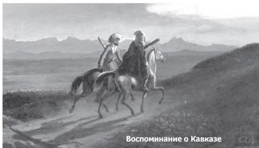
Воспоминание о Кавказе

Хэншье уйдажа гашуудахагүй, Хэлэнэб танда сэхыень. Хүхилдэхэ үхэхэдэм аргалгүй, Хүбүүн түрэхэнһөөмни үлүүхэн.