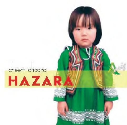
Хазаар угай басагахан монгол - буряад хүүхэнһээ ондоошье бэшэ ха!

Кайтаг-Хайдагуудай уг гарбалай үндэһэн тухай хоёр ханамжа бии юм. Хайдаг (хайтаг) хуушан монголһоо хаттагин гэнэн үгэнһөө үндэһэлнэ.