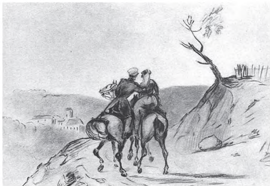
Военный верхом и амазонка