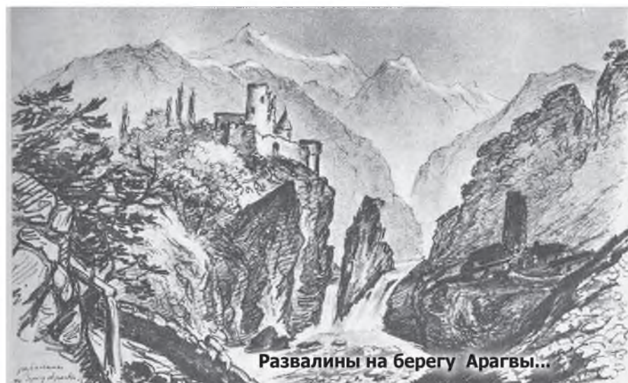
Развалины на берегу Арагвы...