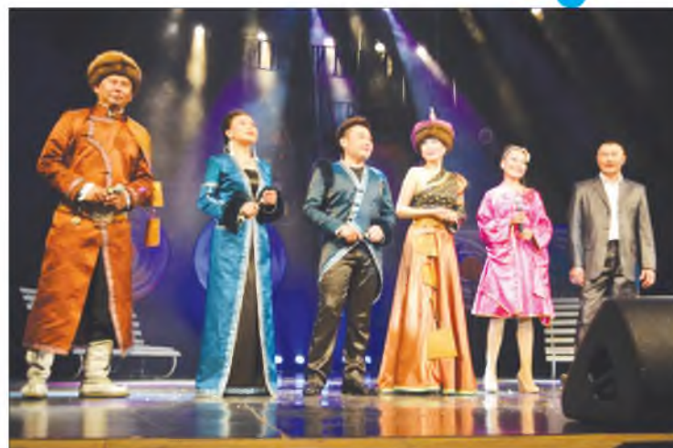
Буряад дуунууднай найхан даа...