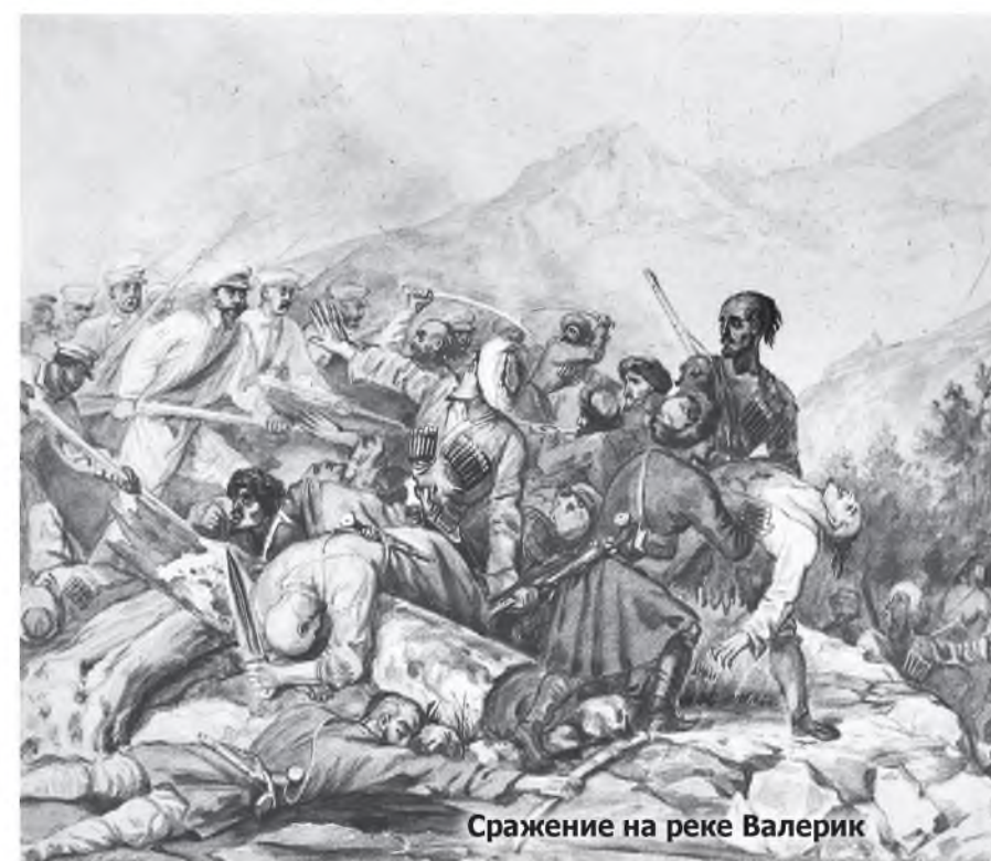
Сражение на реке Валерик