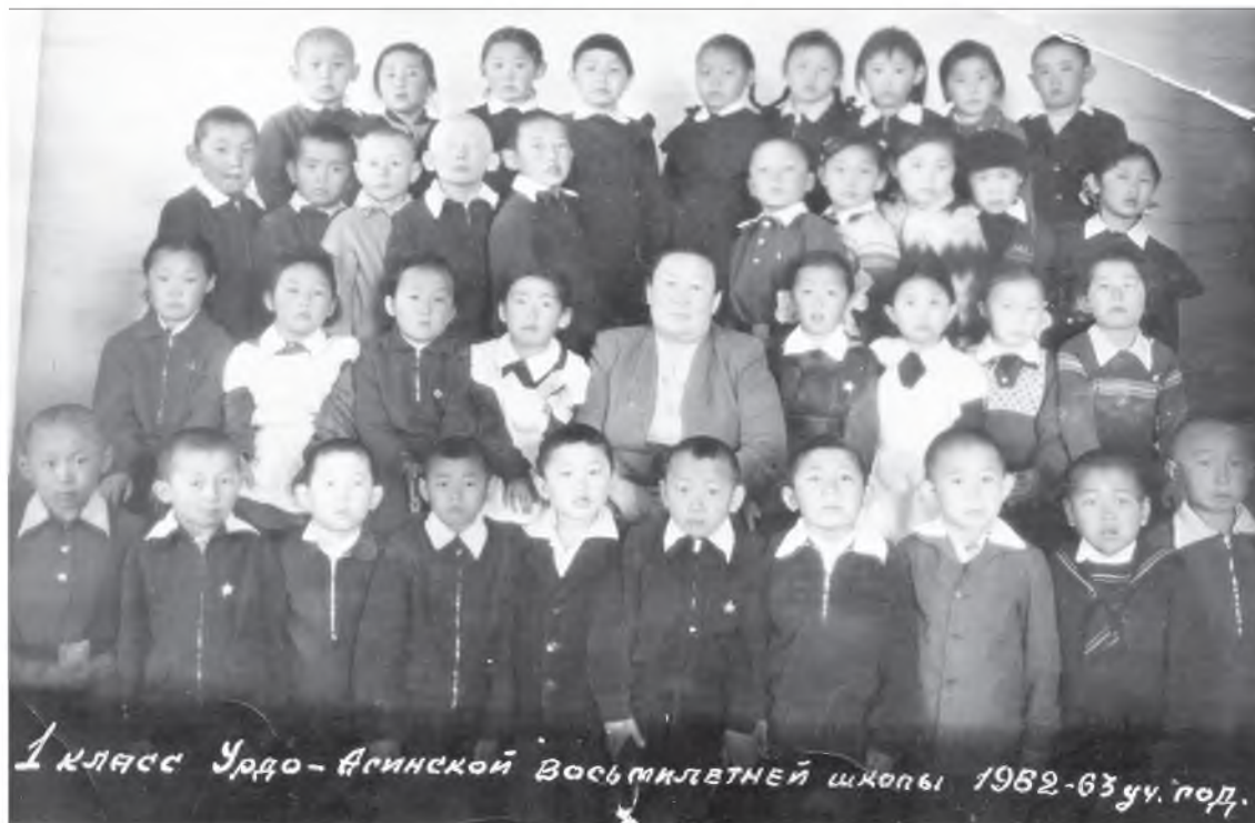
1 класс Урда-Агинской восьмилетней школы 1982-83 уч. год.