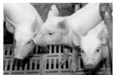
Иимэ сэбэрхэнүүд зандаа үлэхэ гү?

Ландрас, дюрк, сагаан томо, F1 гэнэн холимог хэдэн үүлтэрэй дүн хамта 1500 толгой гахай аяр Даниһаа самолёдоор Буряад Республика хүрэжэ ерэбэ. 12 часай туршада "Боинг-747" гэнэн дээдэ шатын самолёдоор ниидэжэ бууһан гахайнууд үһалаад, эдээлээд, "Камаз" түхэлэй 8 машинаар байха газар руугаа замаа үргэлжэлүүлээ.