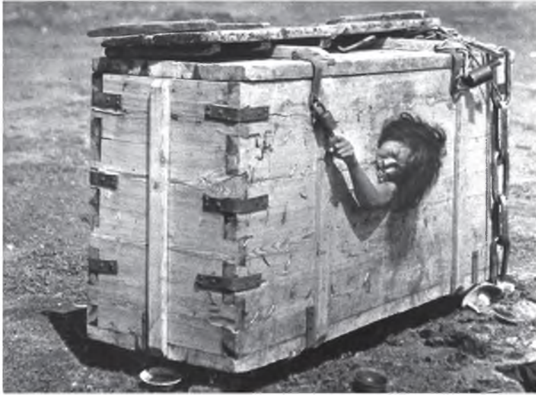
A MONGOLIAN WOMAN CONDEMNED TO DIE OF STARVATION