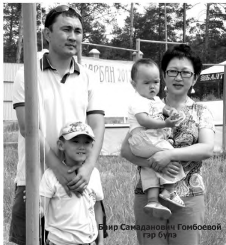
Баир Самаданович Гомбоевой гэр бүлэ