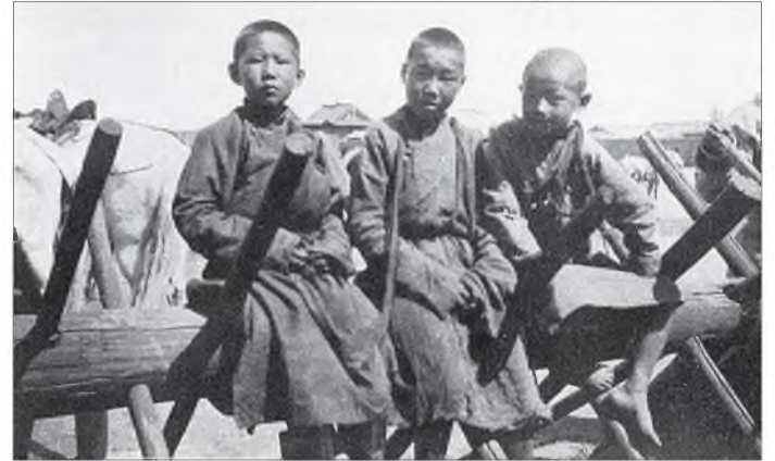
Б агахан хүбүүд – хубарагууд туршалгануудай хажуугар “элирхэйлэгэ” наадана