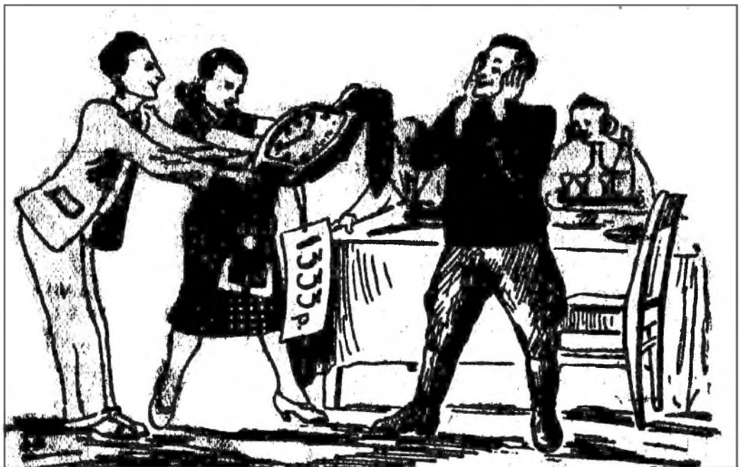
...манай шагналда та хүртэлсэхэ ёһоороо хүртэлсөөт. Уран зурааша Ф.БАЛДАЕВАЙ зураг.

П.БУЯНТУЕВ. («Усть-Ордын үнэн» сонинһоо абтаба).