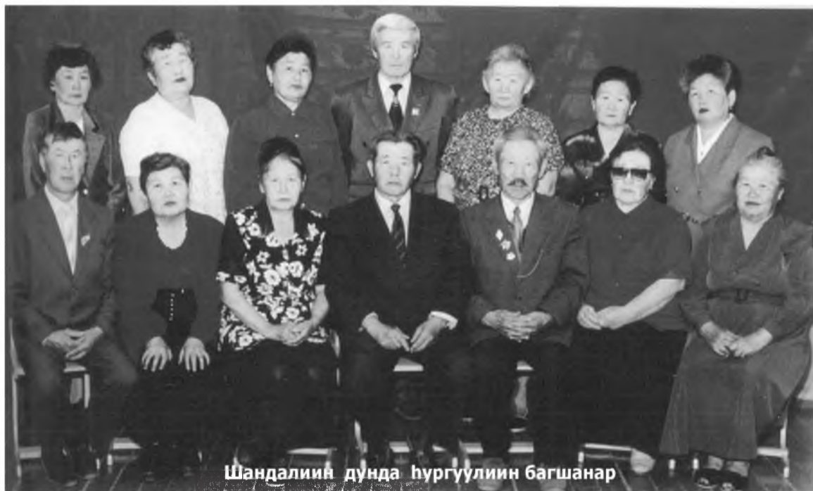
Шандалиин дунда хургуулийн багшанар