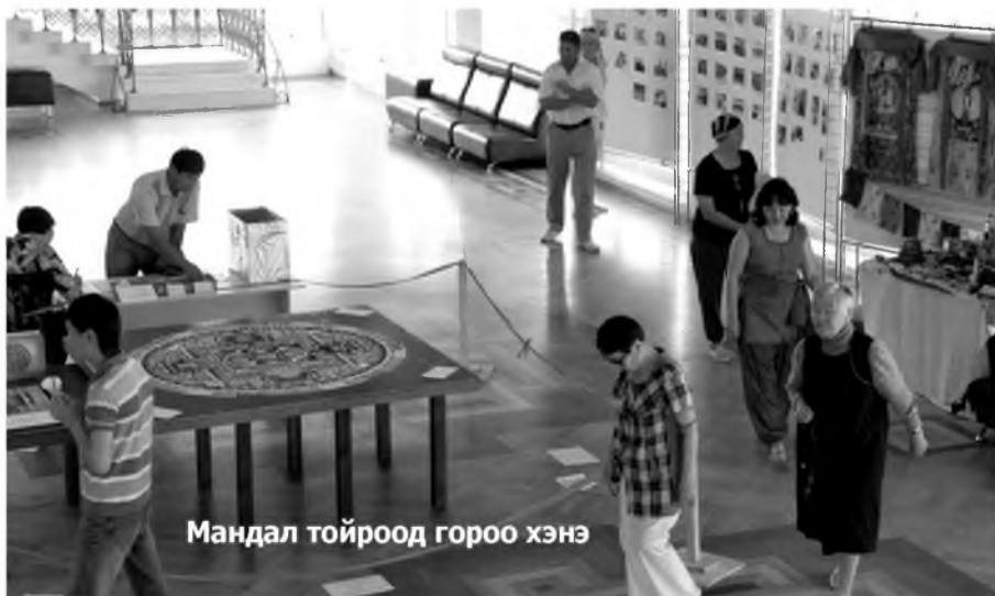
Мандал тойроод гороо хэнэ