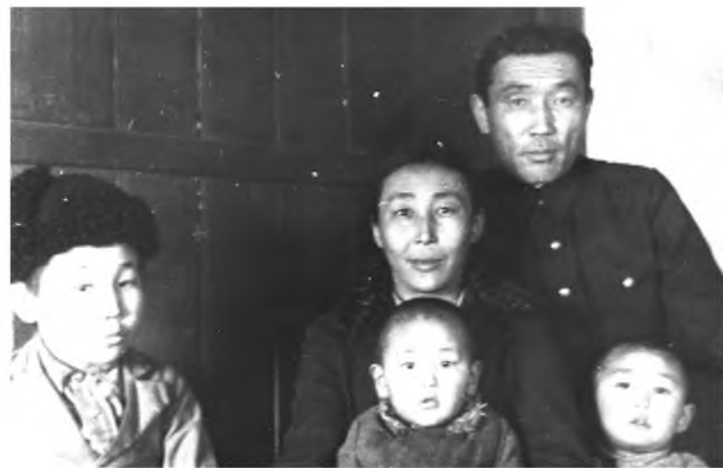
Гармажав эхэ эсэгэтээ ба дүүнэртээ. 1937 он