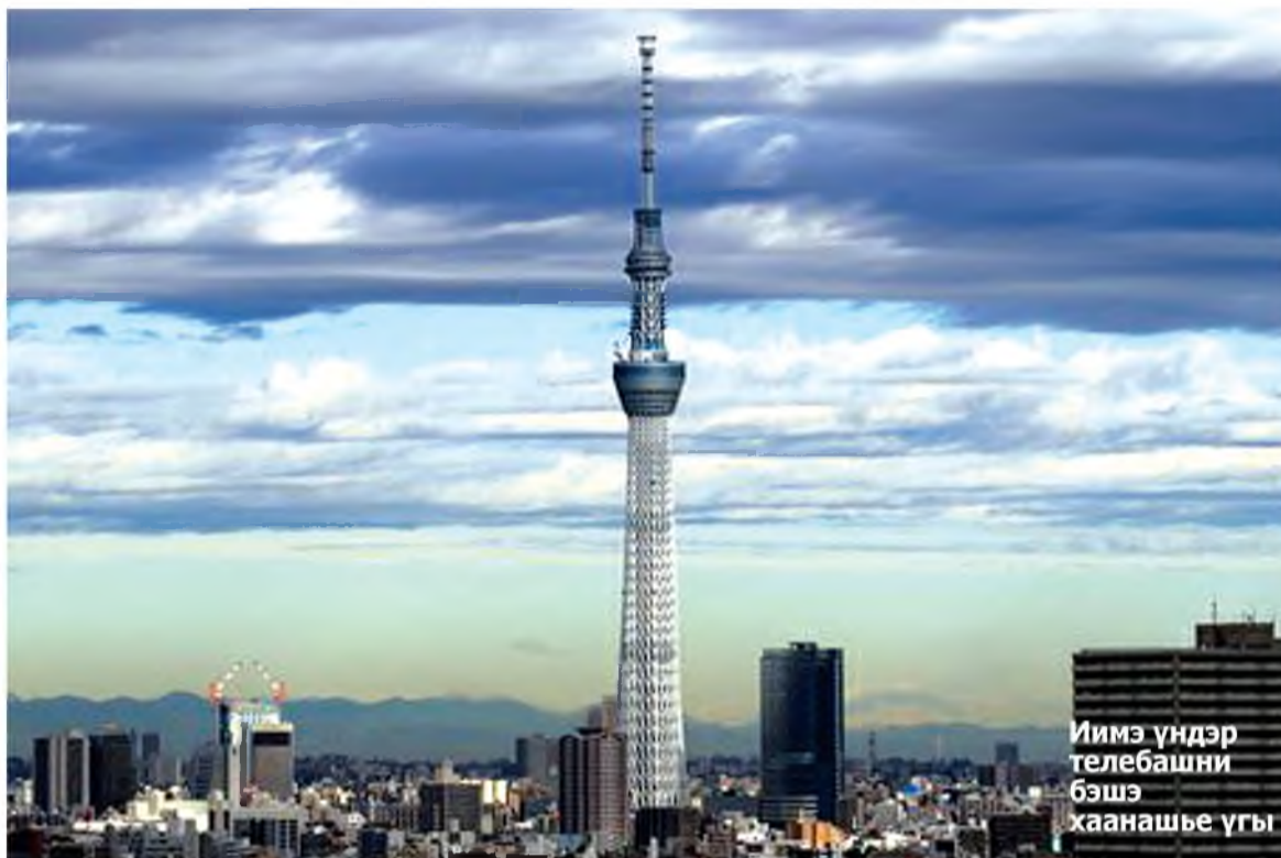
Иймэ үндэр телебашни бэшэ хаанашье үгы

“Июлиин 14-дэ Эрхүү хотогоо Яхад авиакомпаниин “Боинг” гэхэн түргэн гэгшын самолётдо хуужа, 5 часай туршада ниидэн, Токио хүрөөб. Тиин найман үдэрэй туршада гайхалаа баража садааб даа. Жэшэнь, Гиннесэй рекорднуудай ном соо оруулагдаһан дэлхэйн эгээл үндэр (634 метр) телебашни харахадаа, япон арадай болбосорол ехэтэй, үйлэдбэрилгын ухаатай байһаарнь үшөө дахин гайхааб. Ямар үндэр байшангуудые бодхоодог зон гэшэб?! Тиихэдээ бүхы барилгануудынь гоё байхынгаа хажуугаар таарамжатай зохидоор, шуурга халхиндашые, газарай хүдэлөөнөө хандархагүйгөөр зохёогдонхой. Номгон далайн Минамато тохой – баһал үзэсхэлэн гоё газар. Байгал далайгаа иигэжэ гоёогоо һаамнай, аяншалагшад ерэхэл һэн даа.