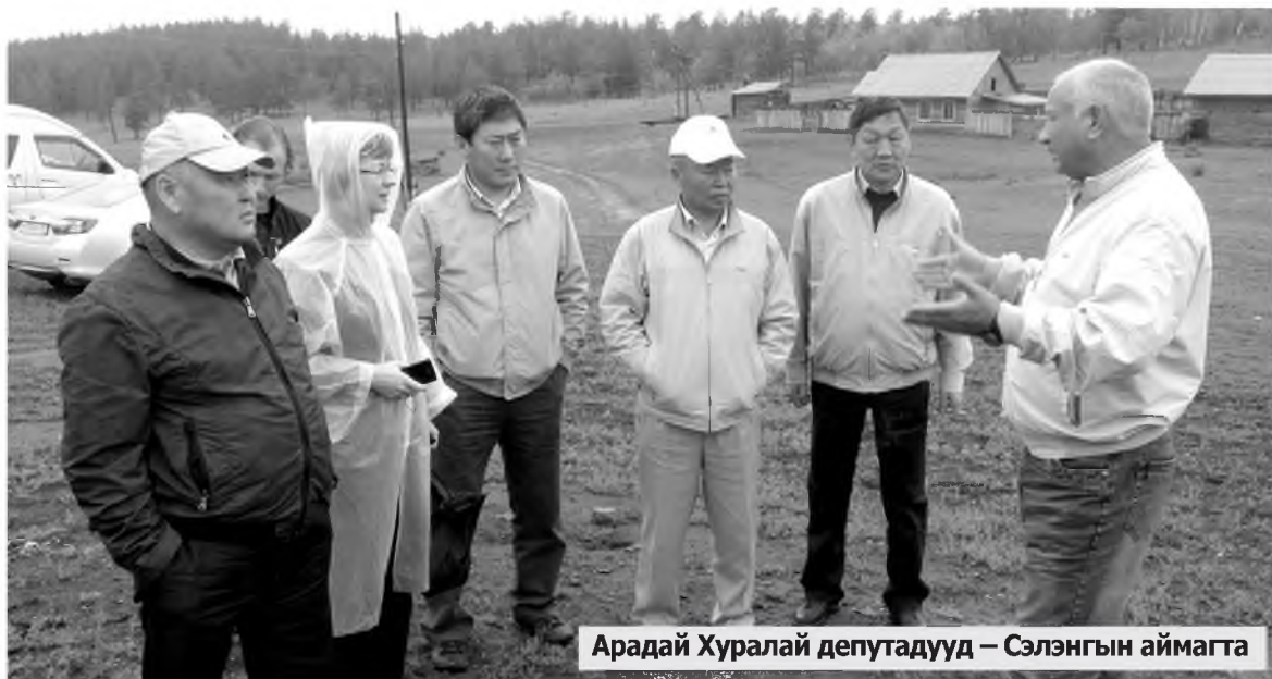
Арадай Хуралай депутатууд – Сэлэнгын аймагта

БУРЯАД ОРОНДО хүдөө ажыхын байдал найжаруулхын тула томо агрохолдингуудыг байгуулха зорилго табигданхай. Республикын толгойлогшо Вячеслав Наговицын тэрэниие бэлүүлхын тула ехэ хүдэлмэри ябуулна. "Бигвайт" гэхэн холдинг Сэлэнгын аймагта байгуулагдажа эхилэнхэй. Тэрэнэй бүридэлдэ ородог ажыхынуудаар бүлэг депутатууд ябажа хараба. Тэдэниие Арадай Хуралай Түрүүлэгшын уялгануудыг