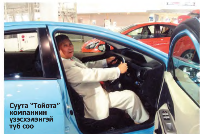
Суугта “Тойота” компаниин үзэсхэлэнгэй түб соо