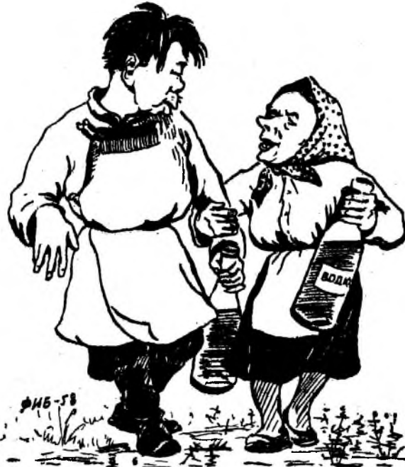
«Айраггүй архиншад, ажалгүй зайгуулнууд»

Ринчинов гээшэнэ МТФ-е даажа энээнһээ урда тээ яһалал хайн байтараа, гэм хээд, сүүдлүүлжэ ошоһон аад, 1957 ондо бусажа ерэнһэнэ хойшо архи намнаад, ажал хэжэ үгэнэгүй.