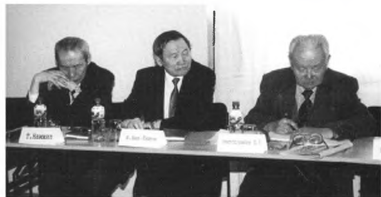
«Монголой гүрэн турын» 800 жэлэй ойдо зорюулагдажа, 2005 ондо Улаан-Баатарта үнгэргэгдэһэн эрдэмэй хуралдаан

Гадаадын оронуудай аяншалагшад, шэнжэлэгшэд, тусхайлбал, Швециин инженернэ корпусой лейтенант, дипломат Лоренц Ланге, англис эмшэн