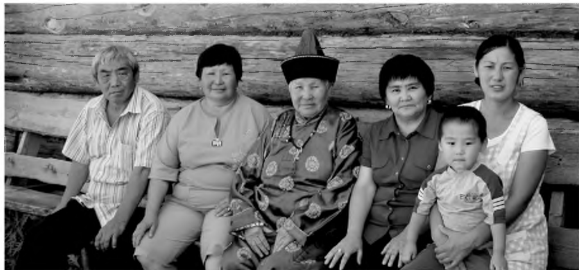
Наталья басаганайнгаа үетэн нүхэдтэй

Эльвира ДАМБАЕВА, манай корр.