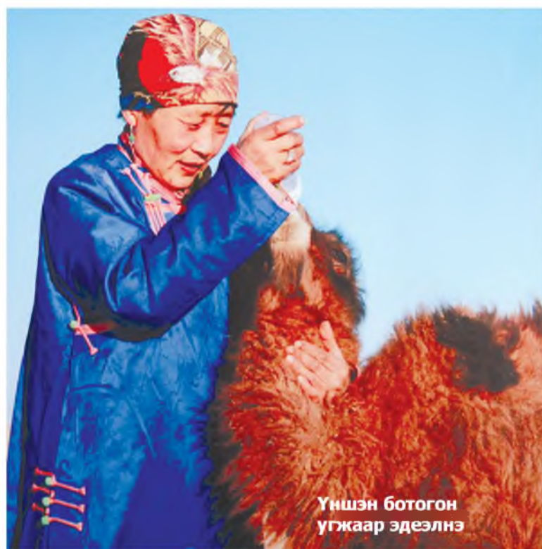
Үншэн ботогон угжаар эдеэлнэ