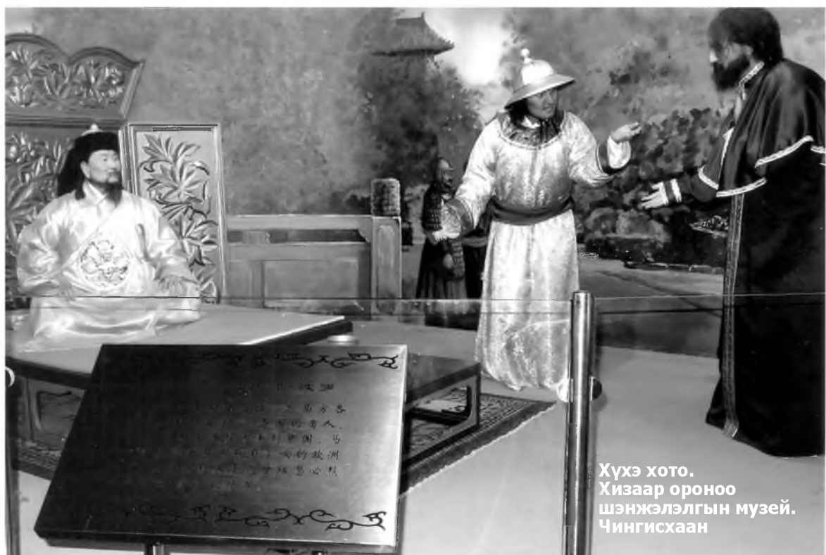
Хүхэ хото. Хизаар ороноо шэнжэлэлгын музей. Чингисхаан

М инии зорижо гарахан ушар: Чингисхаан Богдо Гэгээндэ ООН-ой сэгнэлтэ 1000 жэлэй хүн гэшые мүнхэлэн зорюулагдан дурасхаалай зүйлнүүдые хаража буулгажа абаха гэжэ ошолойб. Эржэн хороо хүрэтэр ошодог хаа гэжэ ханаан байгаад, ноёомнай богонидожо, арай гэжэ Хүхэ хото хүрэхэ эрээб. Юундэ ноёомнай богонидооб гэхэдэ, наһатай болотороо ухаамнай ахир боложол, саагуур юушые адаглангүй ябаһанһаа ушардаг хэбэртэй. Эндэһээ гарахадаа дүшэ гаран мянгатайб гэжэ ханаанһаа түмэр харгын биледтэ 6 мянга үгэхэмни, 2 мянга гарамни эндэхэ эдээшэдэй хармаанда орошоһониинь элирээ хэн. 37 мянган түхэригнай Хитадай гүрэнэй мүнгэндэ нэлгэгдэхэдэ, оройдоол 5 мянга гаран боложо, Россиин гүрэнэй мүнгэн хоохон саарһы анжарангүй, панхаруутажа, хитад мүнгөөрөө арайл хөөргөө бусааб.