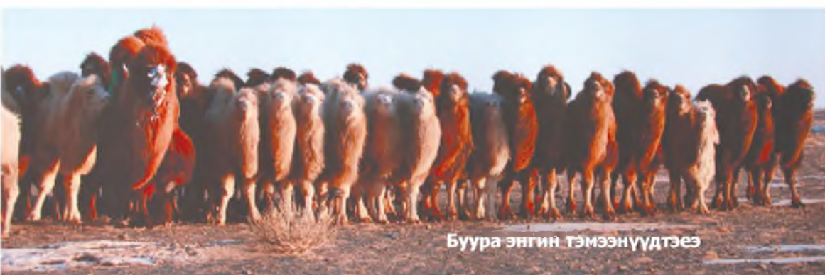
Буура энгин тэмээнүүдтээ