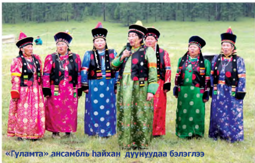
«Гуламта» ансамбль һайхан дуунуудаа бэлэглээ