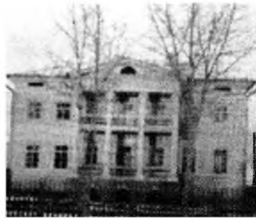
Старцевай гэр. Селенгинск хото. Мүнөө декабристнуудай музей