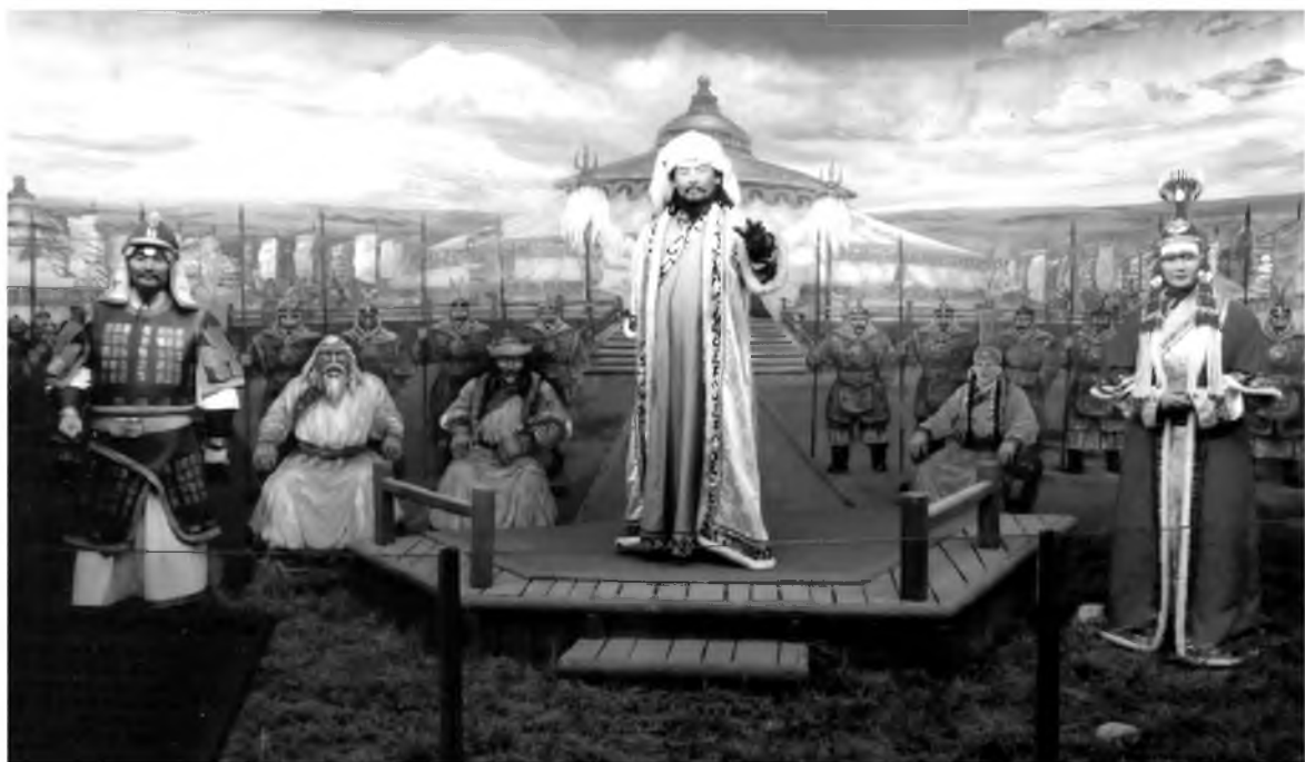
Хүхэ хотын музейдэ. Чингисхаан

Х уушан балар сагай галабай эхээр монгол нэрэтэй боложо, эхэ нютаг – Онон; Аргунь (Үргэнэ-хон (хан,...) мүрэн) Хинган урагшахи тала дайдаар, Хитадай хойто талаар нүүдэл байдалтай малшадай монгол, түүрэг яһатанай зөөдэг талада тогтонхой хэдэн миллион зонтой аргагүй ехэ, сэбэршые, гоёшые Хүхэ хото томо самолёдоор ошожо, хөөргөө Манжуур хотоёо баһал тэхэрээб. Дээрэһээ харахада, Хүхэ хото баруун, хойто, зүүн тээһээ Хингаанай үргэлжэлэл Мони уулын эбэртэ тогтоһон, хитад гүрэнэй монгол арадуудай суглардаг газар гэжэ ойлгохоор. Хүхэ хотын ехыень аэропортын томо байшангаар тухайлмаар: утаараа нэгэ километр боломоор - табан томо тэбхэрлэмэл хоолойгоор айлшадые угтажа абана, табан томо хоолойгоор шиидхэжэ мордохуулна. Гадна түмэр харгын, томо автобусой замаар бүхы Хитад орон соогуур, харин гүрэн Монгол, Россиин гүрэнүүдээр холбоотой.