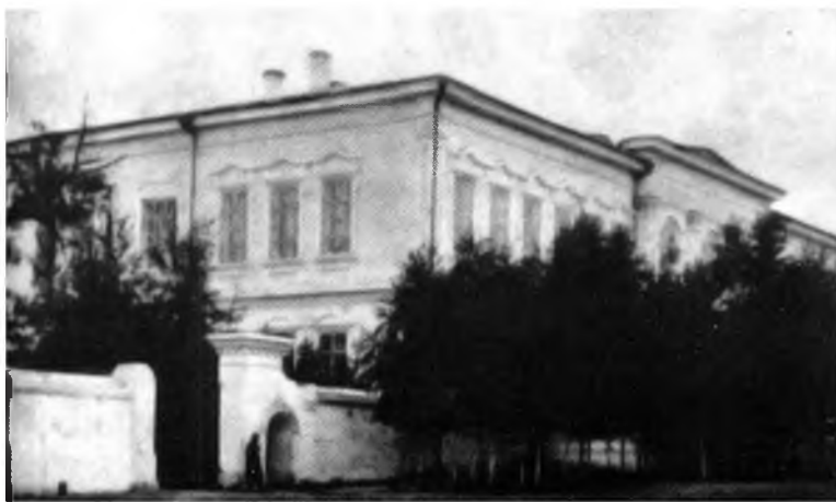
Троицкосавск хото. Хотын училищи