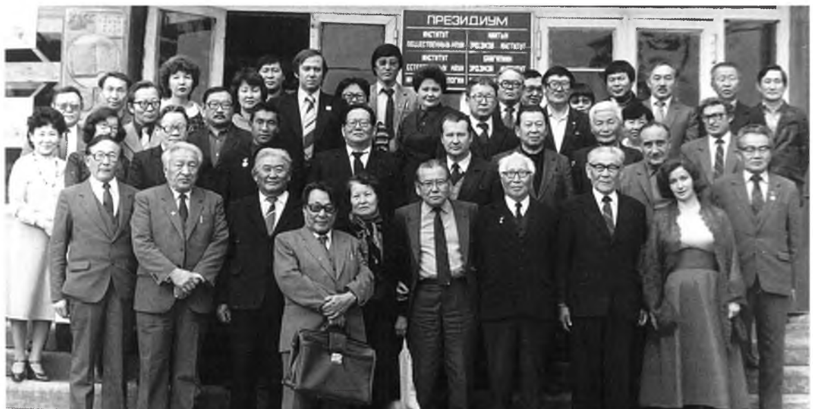
Түб Азиин асуудалнуудаар 1984 ондо Улаан-Үдэдэ болоһон хуралдаан