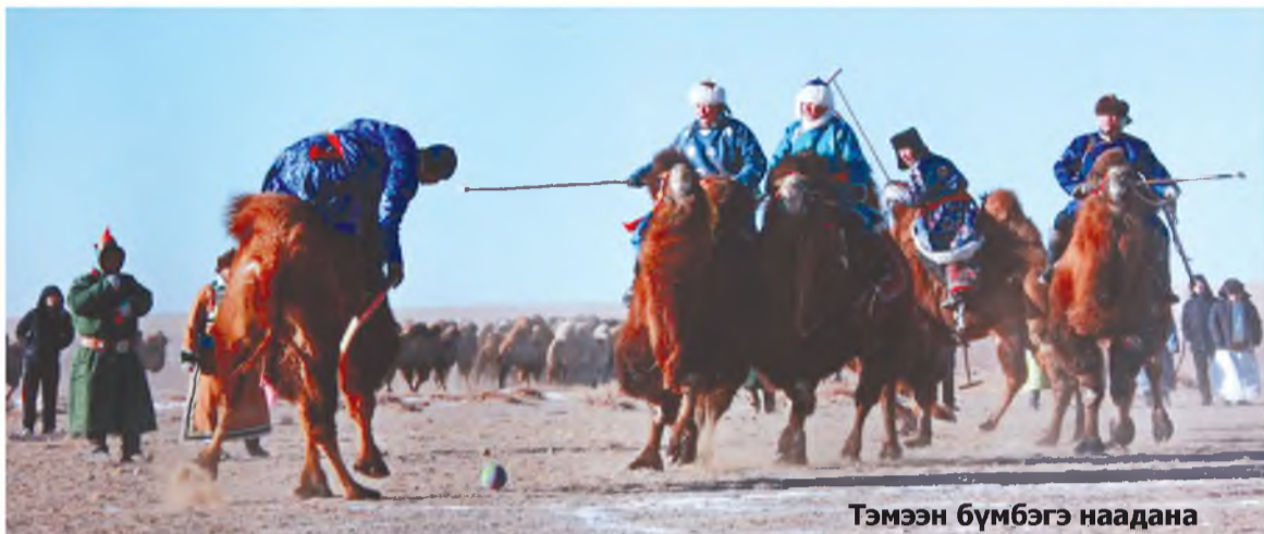
Тэмээн бүмбэгэ наадана

Зүгөөр, айлшад ай-ханамжаар, гурбан гүрэндэ – Росси, Монгол, Хитадта – таран ажаһуудаг буряадууд сооһоо Хитадай буряадууд эгээл үндэр соёлтой. “Гү-шаад онуудаар танай ара-дай эрхим түлөөлэгшэд Хи-тад руу нүүжэ ошоһон. Үзэг бэшэггүй, үгытэйшүүлтнайл нютагтаа үлөө”, - гэжэ Баян-Жаргалай хэлэхэдэ, нилээд арсалдажа, эрхимүүднай бу-та гаража ошоогүй, Эхэ орон-доо үнэн сэхэ, урбашагүй зо-