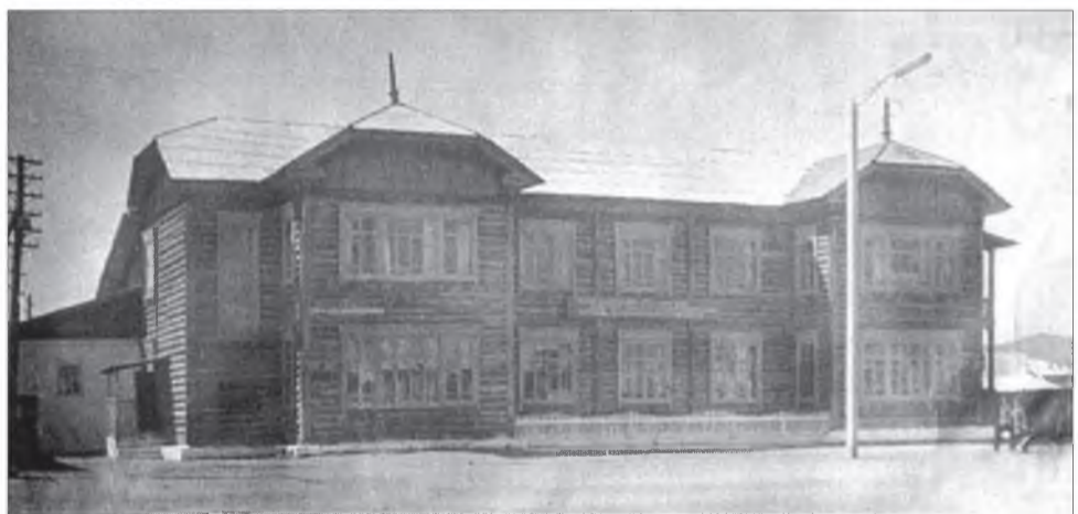
Аймагай библиотекин болон арадай музейн байһан, 1973 он

га шахуу түхэриг олзо оршо абтаа. Тэрэ тоодо Социалист Ажалай Герой Н.Тогмитовагай отарынхид 8625 түхэриг, тиэхэдэ түсэбһөө гадуур олон хурьга абаһанайнгаа түлөө 4674 түхэриг олзо оршотой гараа. Тэрэ үедэ хонишодой дунда семинарнууд үнгэргэгдэжэ, тэдэнэр дүй дүршэлөөрөө хубаалдадаг байгаа.