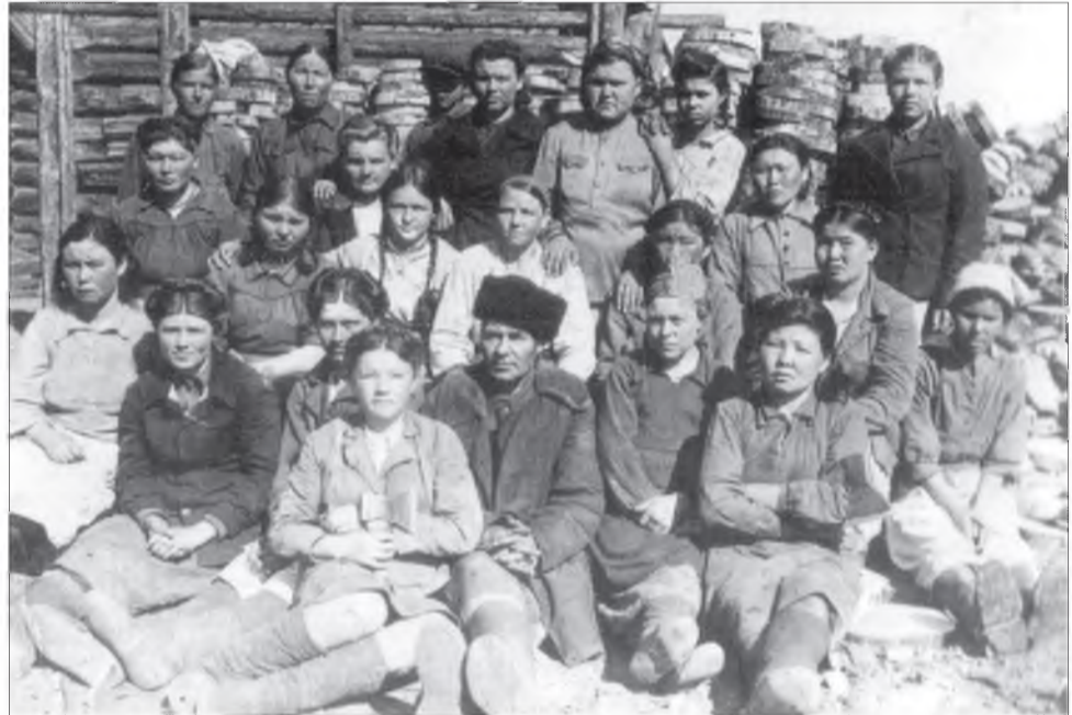
Хандагайн ЛПХ-гай тракторнуудта түлээ бэлдэгшэд, 1949 он