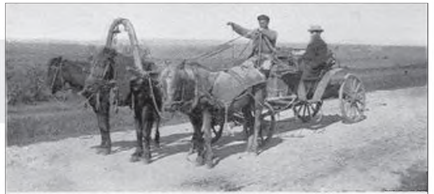
OUR TRAVELING CARRIAGE WHILE MAKING THE BURIAT JOURNEY. Page 21 My driver forgot to drop his arms. They always hold the reins in this way when driving rapidly