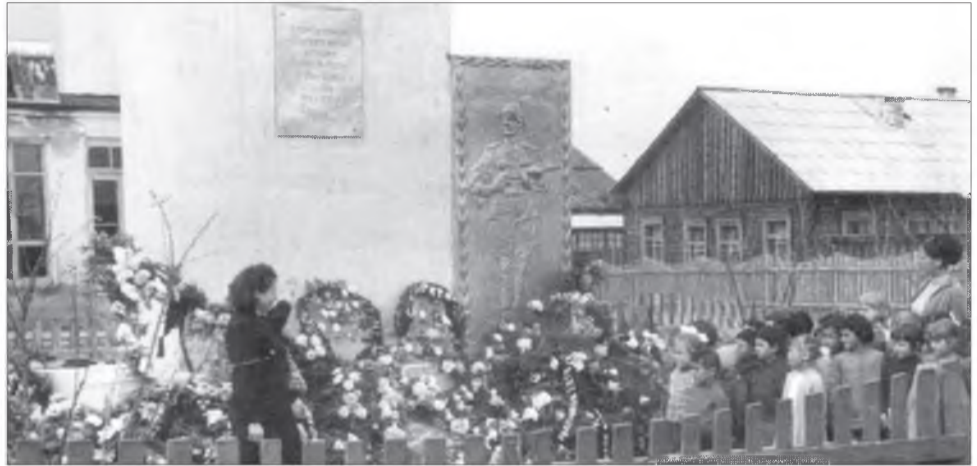
Хүүгэдэй саадай хүмүүжэмэлнүүд Хори тосхоной хүшоогэй дэргэдэ

1972 оной дүнгөөр Хориин совхоз ехэ олзо оршотой гараһан юм. Жэшээлхэдэ, хонин ажалаар 44 мян-