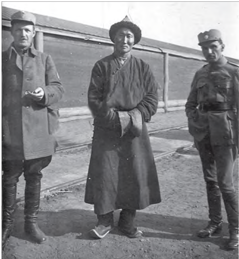
Хубисхалай үедэ Верхнеудинск хотодо хүндэ хүшэр ушарнууд тохёолдоо. Нэгэ гарһаа нүгөө гарта энэ хото ородог байгаа. Верхнеудинскда атаман Семенов хасагууд, капеллевууд, япон сэрэгшэд, американцууд, чехууд, Колчагай отряднууд ороһон юм. Энэ фото-зураг дээрэ хоёр белочехүүд фотокамерын урда тээ эндэ ажаһуудаг хүнтэй суг зогсоно.