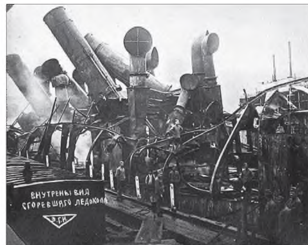
1920 ондо уһыень гаргаһанай һуулдэ ледоколой шатаһан корпус Байкал порт шэрүүлэн абаагдаа нэн. Тийн 1926 он хүрэтэр тэндэ байгаа. Удаань түмэр хэрэгсэлнүүдын отологдоо. Харин корпусойн доодохи хуби Ангара голой эрьедэхи нуур соо хэбтэдэг байна. Тэндэ урдахи винтнүүдын, хүсэнэй түхээрлгын хуби тэрэ зандаа үлэнхэй.