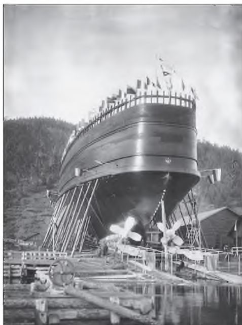
"Байкал" ледокол үһан дээрэ. 1899 оной июлиин 17. Лиственичное

Манай хаяг: 670000, Улаан-Үдэ хото, Каландаришвили, 23, каб.26; электрон хаяг: npen@mail.ru Тел.: 21-64-36.