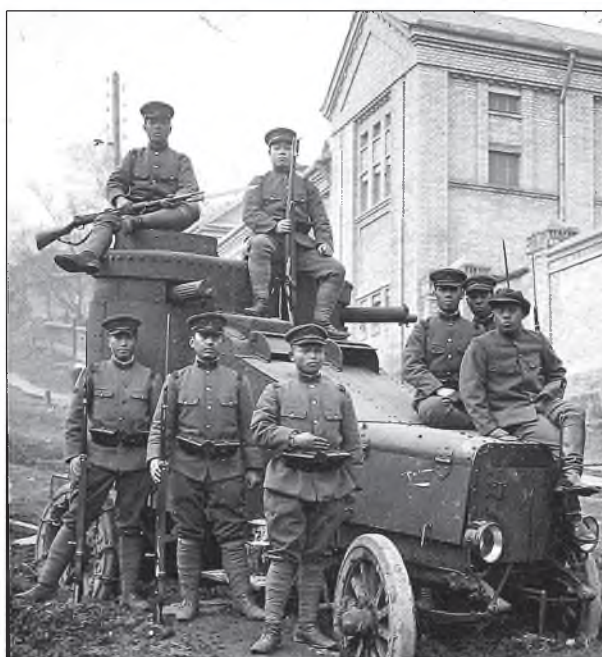
Япон сэрэгшэд броневигэй хажууда. Владивостогто хэгдэһэн энэ броневик Сагаан армиин мэдэлдэ байгаа.