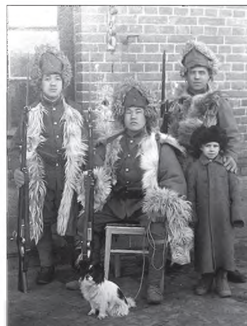
Гурбан япон сэрэгшэд үбэлэй сэрэгэй хубсаһатай. Япон сэрэгшэд тусхай дулаан униформотой.