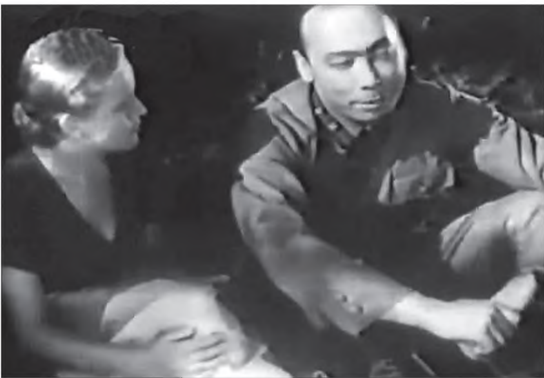
«Б едствие фризоз» немец фильмдэ совет комиссарай рольдо наадана.

Верхоленскиин буряадуудай олонхинь эхирэдүүдтэй холбоотой юм. Эндэ мүн лэ булгад үгүүд оролсодог. Хори угайхид баһал оролсодог, юуб гэхэдэ, тэдэнэрэй зариманиинь Джунгарийаа анхан гараһан гэжэ урданай домогууд хөөрэнэ. Ойрад болон монгол үгүүдта хабаатай хүнүүд баһал бии.