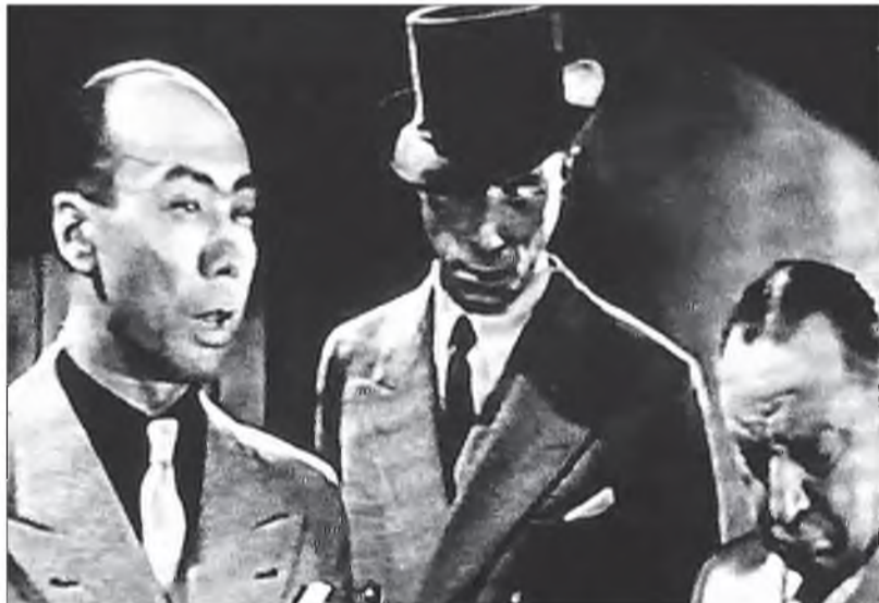
«Ш анхайская драма» гэнэн үран найханай фильмнээ хэһэгтэ баһал Валерий Инкижинов хабаадана