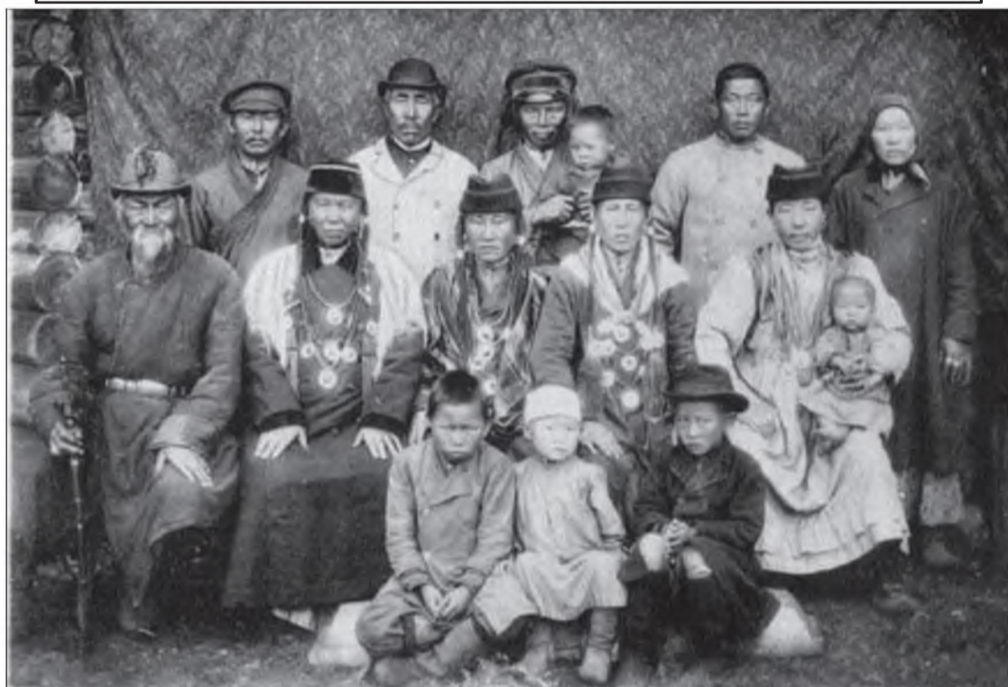
Семья бурятъ Верхоленскаго уьзда Une famille de bouriates du districh Verkholsk

Манай хаяг: 670000, Улаан-Үдэ хото, Каландаришвили, 23, каб.26; электрон хаяг: unen@mail.ru Тел.: 21-64-36.