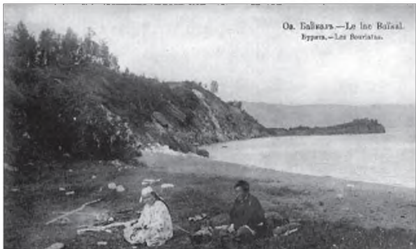
Б айгал далай. Буряад гэр бүлэ архи нэрэжэ байна.