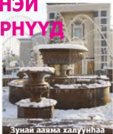
Зунай аайма халуунһаа абардаг хотын фонтан үбэлдөөшье найхашаамаар

Буряад орондо Бажаауугшад хүжюу зугаатай наадаар Шэнэ жэлээ угтаба. Улаан-Үдэ хотын түб талмай дээрхи гол Ёлка болон мүльһөөр бүтээхэн янза бүрийн нааданхайнуудыг үзэж, хонирхон наадахаяа, елүүр дээрэнээ халтиран холжорхоёо ехэ олон зон суглаара.