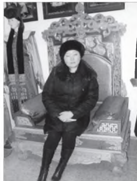
Бүтидма Зыдрабын Монгол орондо

- Монгол гэр бүлын байдал, үхибүүдтээ харилсаан хэр гэшэб?