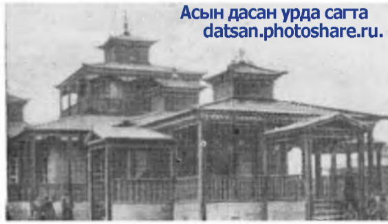
Асын дасан урда сагта datsan.photoshare.ru.

Хүл нуурай (Галуута нуурай) баруун, хойто, зүүн эрьеэр XVIII зуун жэлдэ гурбан дасан бии болоһон байна. Тон түрүүн, 1741 ондо, Хүлэн-Нуурай Гандан Даржалинг (Галуута-Нуурай, Тамчын) дасан, тэрэ 1809 онһоо Хамбын Хүрээ болоһон байна. Удаань 1743 ондо Хүл нуурай зүүн эрьедэ, Загастайн-Адагта, Түбдэн Даржаалинг гэжэ түбэд нэрэтэй эшэгы дасан табигдаба. Энэмнай Асын дасанай эхин гуламтань болоно. Гурбадахинь – энэл Асын дасанһаа 1784 ондо амяараа гараһан Загастайн дасан мүн.