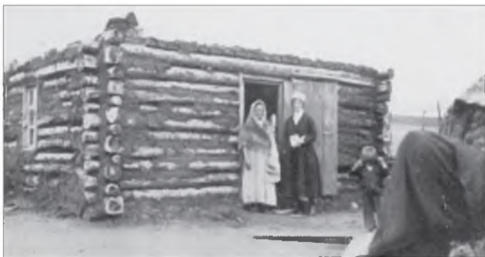
"Путешествие в Монголию" гэнэн номһоо, 1920 он. Авторынь – англи яһанай аянталагта БЕАТРИКС БАЛСТРОУД.

Хяагта руу зориһон саашанхи харгымнай Сэлэнгээр "Рабатка" пароходоор үргэлжэлхэ. Энэ үедэ хотодо нилээд халуун улларил тогтоо, тиймэнээ тооһо шоройтой гудамжануудай удаа хоёр үдэр соо уһан дээрэ ябахата, ехэл таатай байгаа. Урданай ямар гоё байгаалиин үзэгдэлнүүд дайралдаа гэшэб! Теэд нарһан мододой үдхэн ногоон набшаһаар бүрхөөгдэнхэй гүбээ добонууд удангүй миил тала дайдаар нэлгэгдэшөө. Селенгинск – Верхнеудинск Усть-Кяхта хоёрой хоорондо оршодог яһала ехэ нуурин. Эндэ баһал хүмэ бии. 18-даху зуун жэлэй эхиндэ англичан мессинернүүд эндэ нилээд ехэ ажал ябуулаа гэжэ һануулаа.