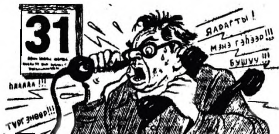
нарын һүүл багаар: хашхара хашхарһаар халуудашаба