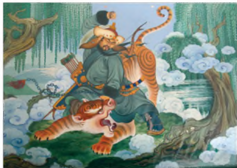
Чимит ламын зураг

Буряад зурагай хүгжэлтэ 100 жэлээр гээгдэшоо. Энэ талаар нургуули нээбэл, хэмэл хэрэг болохо. Мүнөө ябан хэбээрээ