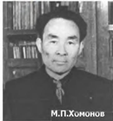
(Эхиниинь январин 24-нэй дугаарта).

Элитэ монголшо эрдэмтэн М.П.ХОМОНОВОЙ 100 жэлэй ойдо