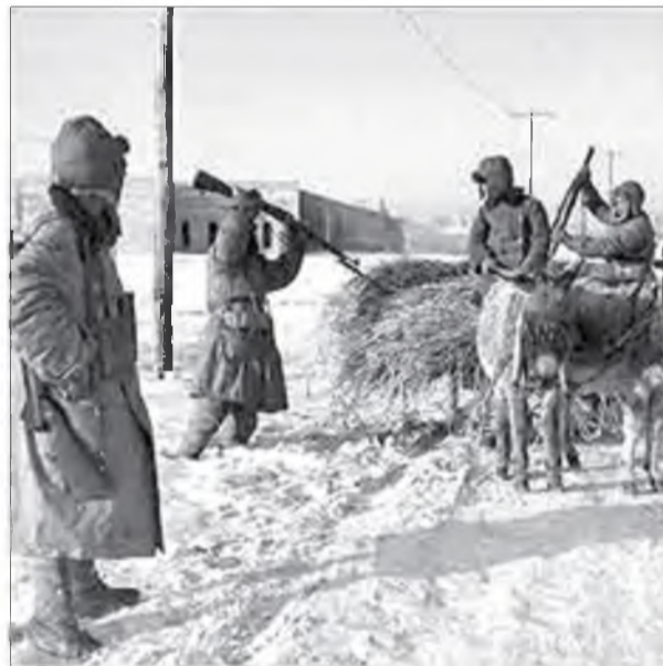
"Путешествие в Монголию" гэнэн номһоо, 1920 он. Авторынь – англи яһанай аянталагта БЕАТРИКС БАЛСТРОУД.

1929 ондо Хитад СССР хоёрой хоорондохи зүрилдөөнэй үедэ (Хитадай- Зүүн зүгэй түмэр харгы дээрэ) хилэ шадар оршодог Баргаһаа Шэнэхээн хушуунай хэдэн мянган буряад-монголнууд Ринчиндоржын ударидалга доро хилэ дабажа, Дотор Монгол нүүгээ. Тэдэ большевигүүдһээ зугадаа юм. 1945 ондо Дотор Монгол Хитадай бүридэлдэ үлөө. "Ехэ гүрэн түрэнүүдэй хашалгада хэдыдэхиеэ ороһон буряад-монголнууд үбгэ эсэгэнэрэйнгээ түлөө буунуудаа гартаа абаа". Тиигэжэ тэмсэл эхилээ – нэгэ талаһаа Уланьфугай ударидалга доро хитад коммунистнууд, харин нүгөө талаһаань Дэ Ван гэгшын хүтэлбэри доро Дотор Монголой эрхэ сүлөөгэй түлөө тэмсэгшэд.