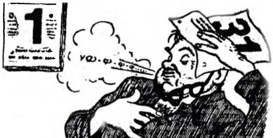
нарын эхин багаар: халуун бууража, нэрюүнээр нэбшээлбэ