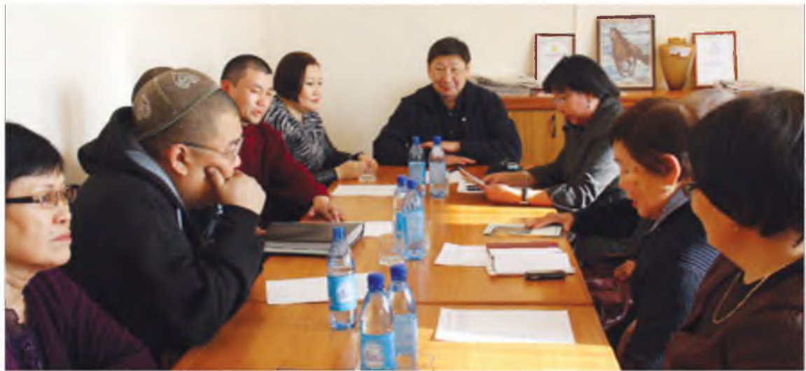
"Дүхэриг шэрээдэ" хабадагшад

Искусствовед С. Эрдынеева буряад зураг хадаа буддын ша-