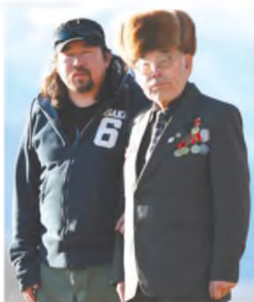
Солбон ЛЫГДЕНОВ, кино-режиссёр:

- Би одхон хубуунииньби. 3-тайхан байхандаа зуража эхилээб. Бүхы юмэн тухай мартаад, үнгэтэ дэлхэйн охиндо абташага һэм. Жамса ахамни ехэ һанаагаа зобохо - залхуу дүүтэй болообди гэжэ. Намайгаа наншахаһаа нахануур ажалда