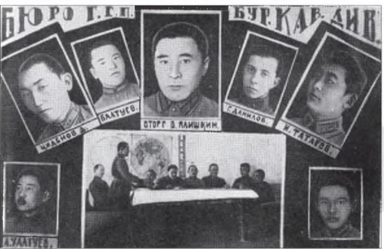
Буряадай морин сэрэгэй хургуули дүүргэһэн түрүүшын курсантнууд.

1925 оной хабар буряад-монголнууд сэрэгэй албанда татагдажа эхилээ. Армида алба гараха болзор - 5 жэл.