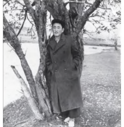
Сүхэрхэ үешье байгаа. Сэхэнь мүнөө элирээ: Сэдхэлээр сэбэр ерээб.

65. Хүлдэжэ, үлдэжэ тулидаг – Хүнэй ехэл зоболон. Намайе ходел дахадаг Наһанай бэрхэшээл олон. Сүмэрэн унажа айгаад,