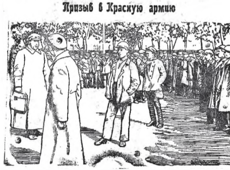
Представитель политотдела разъясняет призывникам цели и задачи призыва в Красную армию