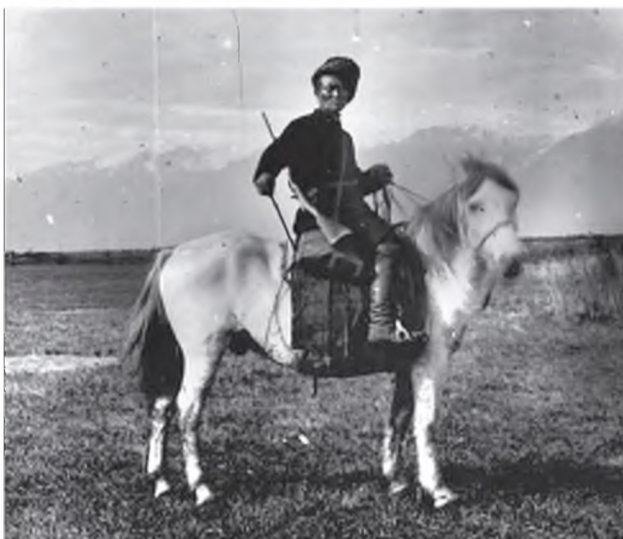
Түрөөһэ агнаһаяа гараба. Түнхэнэй аймагай Горхон нуурин, 1928 он.

Буряад гэр бүлэ. 20-ёод он. Буряад бүлэ шуһан түрэлэй хэдэн үеһөө бүридэдэг байһан. Хүгшэн аба эжынэр заабол нэгэ хүбүүнэйнгээ гэр бүлэдэ ажаһуудаг байгаа. Үри хүүгэдтэй үбгэд, хүгшэд гансаараа һуудаггүй байгаа. Үхибүүдын түрэнэн аба эжыгээ үргэжэ, ёһо заншалаар гурбан зөөлэниие үзүүлжэ, харууһалха ёһотой байгаа. Үри хүүгэдгүй наһатайшуул холыншые түрэл айлда байрлажа, үргүүлдэг найхан заншалтай нэн.