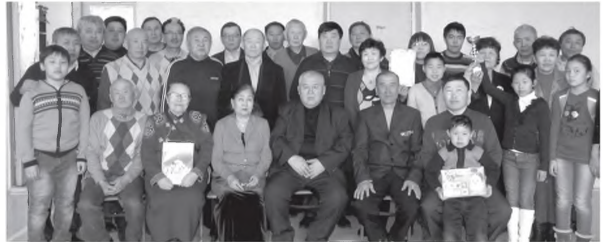
«Хэжэнгэ» эблэлэй эдэбхитэй спортсменүүд