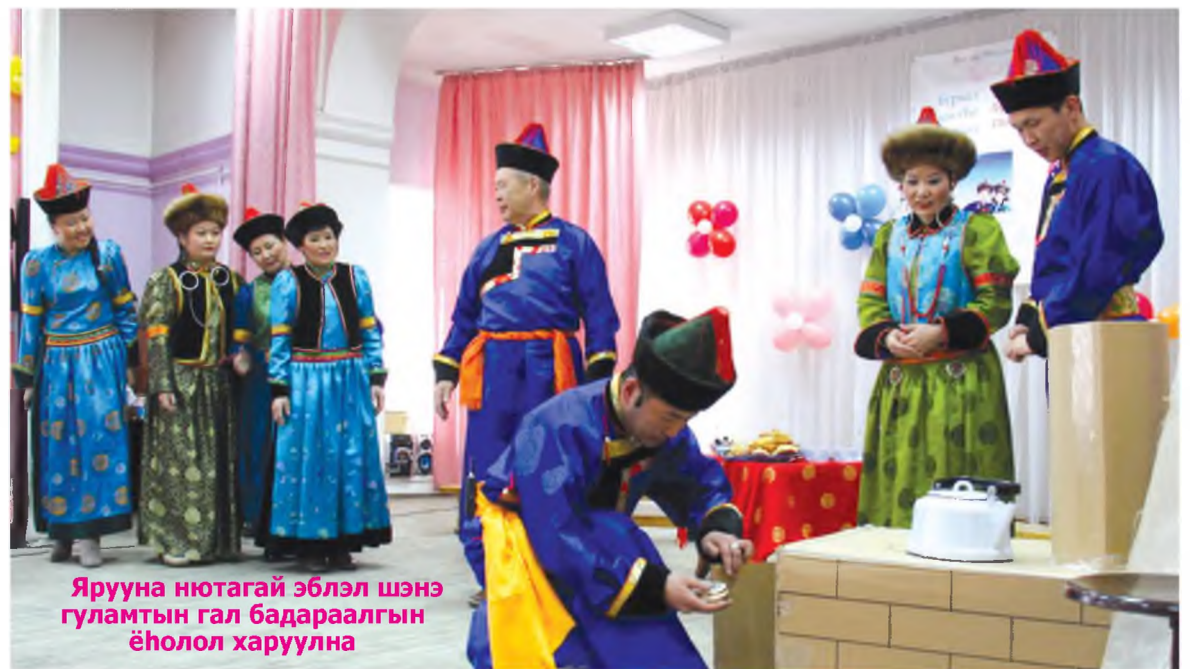
Ярууна нютагай эблэл шэнэ гуламтын гал бадараалгын ёһолол харуулна