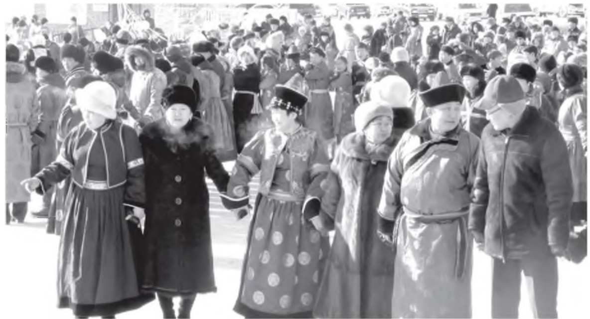
Хэжэнгын ёохор хүхюутэй

эблэлэйманай түрүүлэгшэ (5 жэл миний түрүүлэгшээр хунгагдаһаарни үнгэрбэ) Советтээе бүри хайнаар хүдэлхэн болтогой! Хойто жэл Улаан-Үдэдөө “Сагаа алха” гэхэн Сагаан харынгаа найндэр ниислэл хотодо ажаһуудаг хэжэнгынхид тэмдэглэхэбди. Булта элүүр энхэ, эбтэй зетэй, амгалан тэнюун, ажалдаа амжалтатой, ажабайдалдаа жаргалтай ажаһуухамнай болтогой!