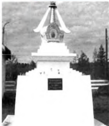
Сансарын хүрдэн эрвээн соогуур, Саг жэлэй хиидээн соогуур Сэбэр найхан шарайотнай Сэдьхэлдээ хадуун ябагшаб.

Эдээхэн үгэнүүд минии элинсэг, хүгшэн эсэгым эсэгэ, гэбшэ лама Бурхив Цырендаша Муршуневича сэхэ хабаатай. Олон хүүгэдэйнгээ үринэрые, аша зээнэрээ ара үбэрөөрөө сүглюулан энхэржэ хууһан элинсэг эсэгэм гансашье гэр булынгөө дунда бэшэ, үргэн Буряад орон соогоо хүндэтэй ябаһаниинь бултанда мэдэжэ.