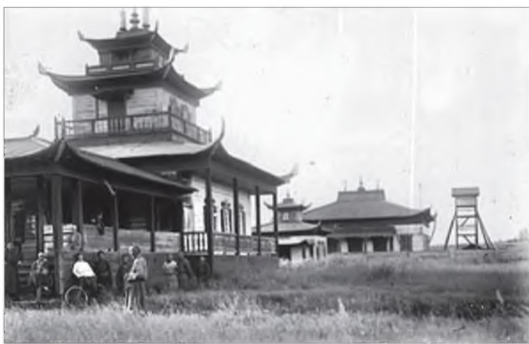
Хэрэнэй дасан. 1926 он.

Манай хаяг: 670000, Улаан-Үдэ хото, Каландаришвили, 23, каб.26; электрон хаяг: unen@mail.ru Тел.: 21-64-36.