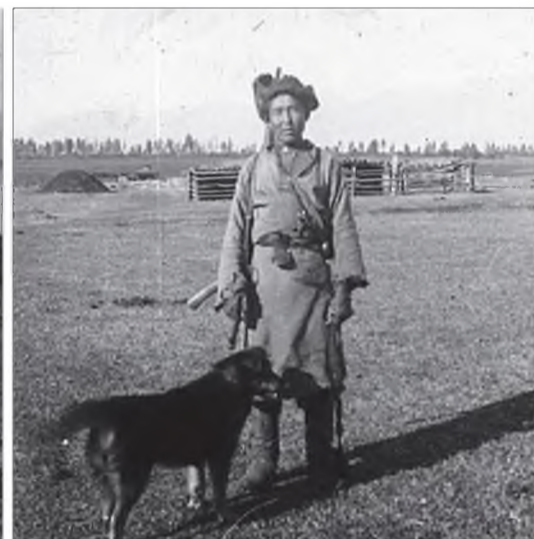
Ангуушан ой руу ошобо. Тооро нуурин, 1928 он.