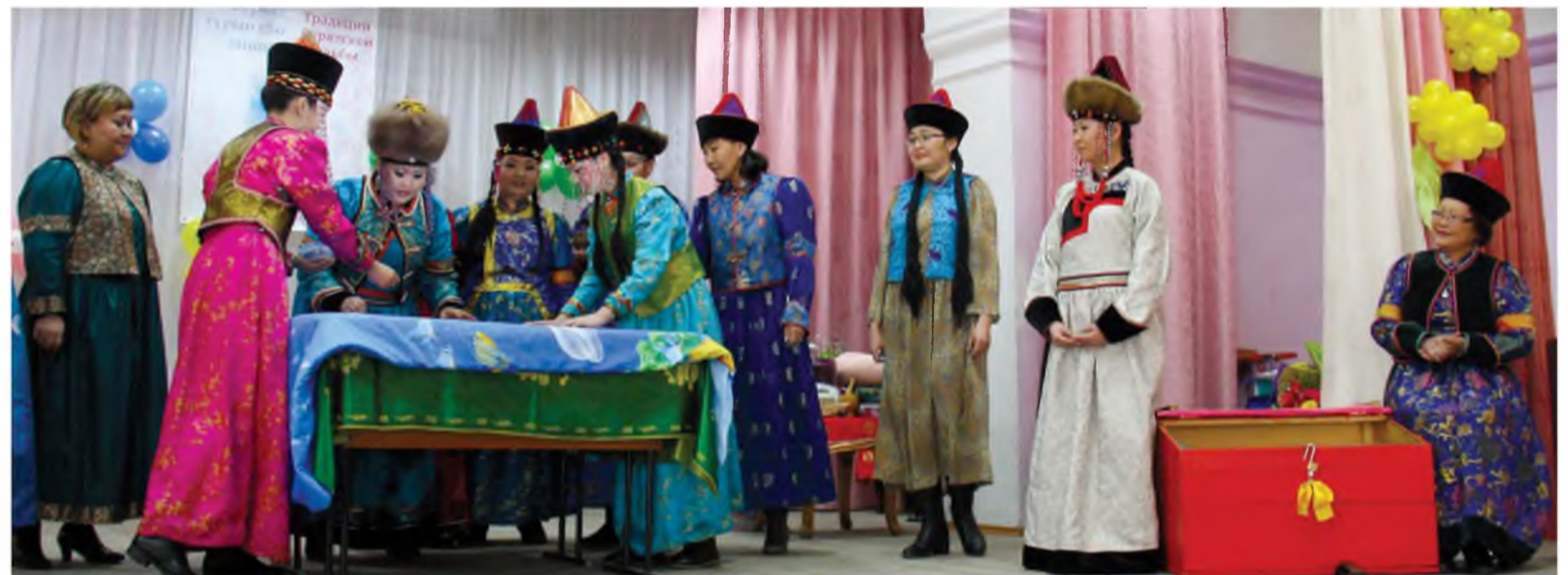
Түнхэн нютагай эблэл хүнжэл бүрихэ, ханза нээхэ ёһололнуудые дурадхана