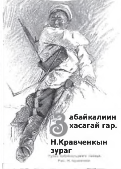
Забайкалийн хасагай гар.