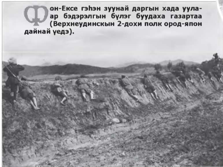
Фон-Ексе гэһэн зуунай даргын хада уулар бэдэрэлгын бүлэг бүүдаха газартаа (Верхнеудинскийн 2-дохи полк ород-япон дайнай үедэ).