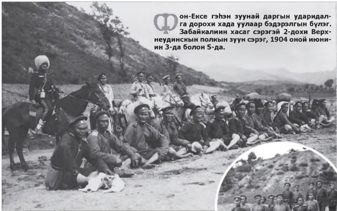
Фон-Ексе гэһэн зуунай даргын ударидалга дорохи хада уулаар бэдэрэлгын бүлэг. Забайкалийн хасаг сэрэгэй 2-дохи Верхнеудинскийн полкын зуун сэрэг, 1904 оной июниин 3-да болон 5-да.

Манай хаяг: 670000, Улаан-Удэ хото, Каландаришвили, 23, каб.26; электрон хаяг: unep@mail.ru Тел.: 21-64-36.