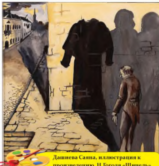
Дашиева Саяна, иллюстрация к произведению Н.Тоголя «Шинель»