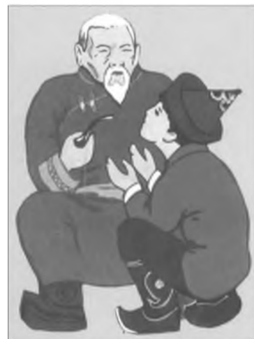
Һаналаа хэлэлтэй гү, али үгы гү гэжэ бодожо үзэдэг зон байгаал даа.

Буряад зон хүндэмүүшэ, налгай зөөлэн зантай зон ха юм даа. Илангаяа урданай буряадууд абари зангаа хүрэ хүрэхөөр элеэр газашань гаргаад орхихогүй. һананан һаналаа хэрэгүйдэ дурд гэжэ хэлэхэгүй, хүлээсэтэй, даруу, хүниие түрүүн адаглажа,