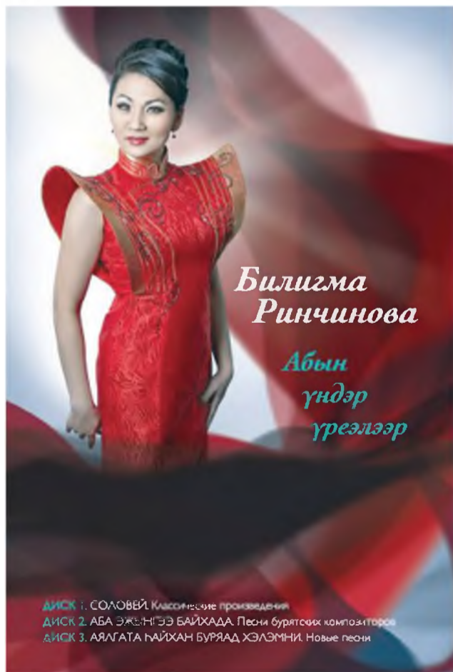
ДИСК 1. СОЛОВЕЙ. Классические произведения. ДИСК 2. АБА ЭЖЭ-НГЭЭ БАЙХАДА. Песни бурятских композиторов. ДИСК 3. АЯЛАГА ХАЙХАН БУРЯАД ХЭЛЭМНИ. Новые песни.