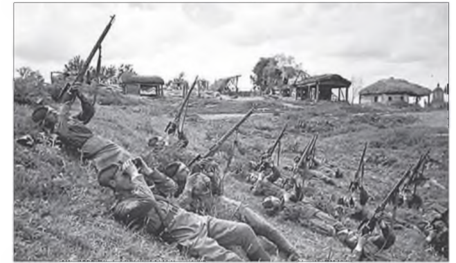
Снайпернууд дайсанай самолёдуудые буудана. 1943 он.

Доржиевтай нэгэл дахин буудаад, "Мессершмиттые" һалгааһыень өөрынгөө нюдөөр хараһан хүм. һомониинь летчигые тудан байгаа".