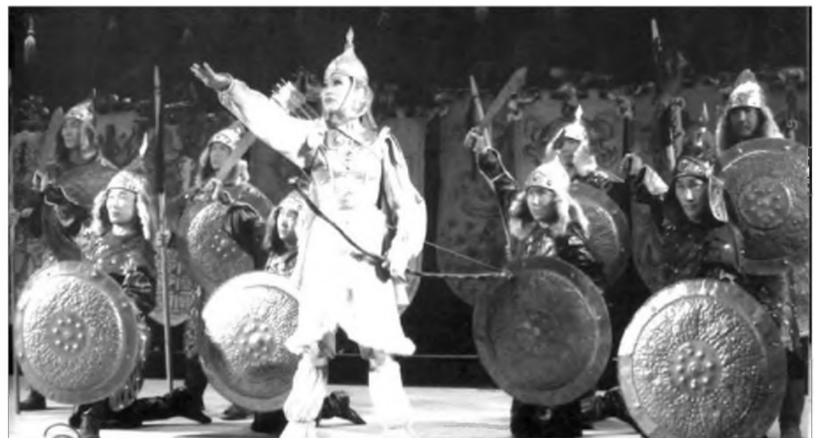
«Балжан хатан» гэнэн зүжэгһөө хэһэг