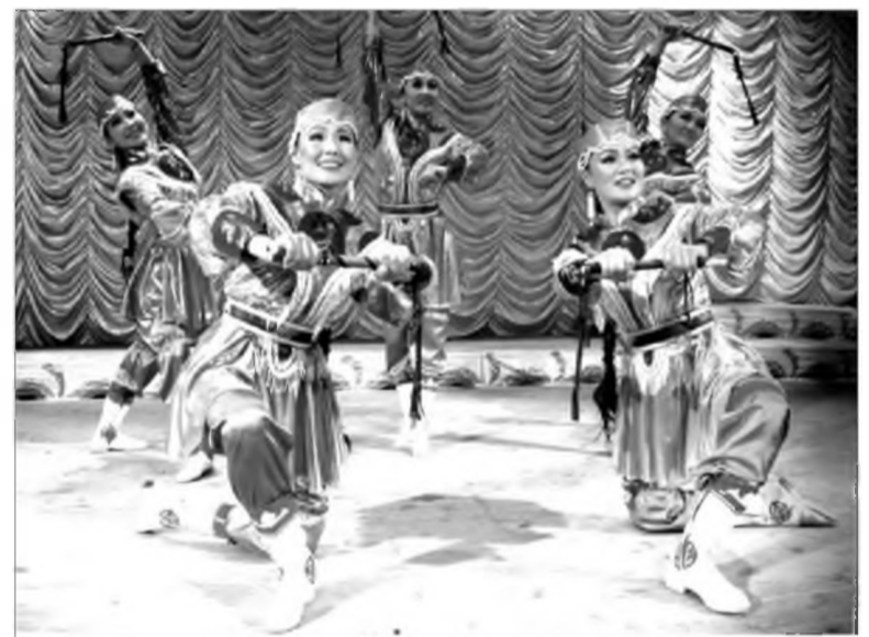
Уян найхан хатар