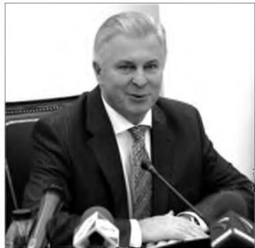
СОЦИАЛЬНА ҺАЛБАРИИН ХҮНДЭТЭ ХҮДЭЛМЭРИЛЭГШЭД!

Июниин 8 - Социальна һалбарин хүдэлмэрилэгшэдэй үдэр