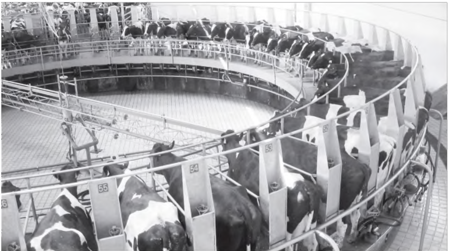
Шэнэ оньһон аргаар үнэедые үдэрэй 3 дахин хаана

Тиимэ һэн тула энэ хэрэгээр гансата ехэ мүнгэ олохоор бэшэ. Харин үүлтэр дээрэ үндэһэлһэн хүнэй, мяханай, нооһоной болон бусад түхэлнүүд, шугамууд, бүлэнүүд ехэ ба түргэн олзо үгэдэг юм.