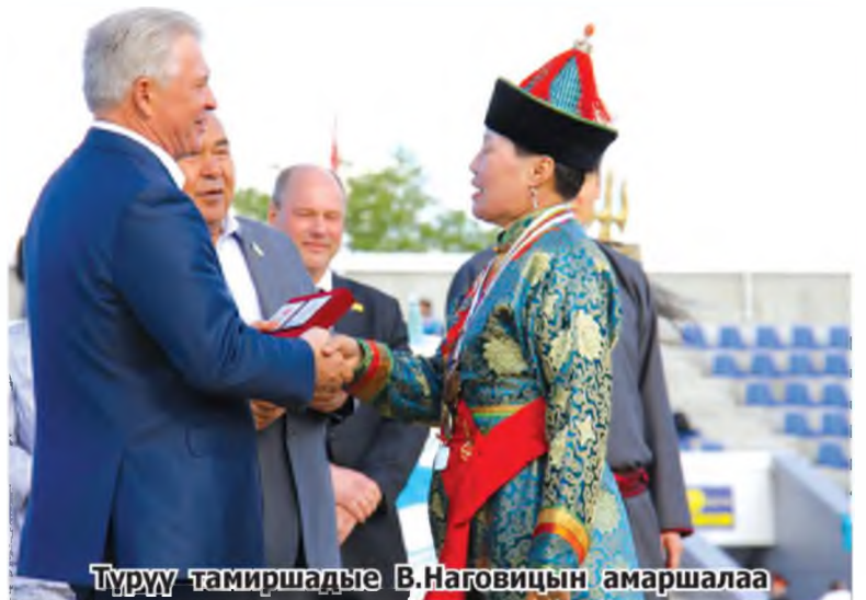
Түрүү тамиршадые В.Наговицын амаршалаа

Буряадтаа спортын талаар шалгарһан хэдэн мэргэжэлтэн гүрэн түрын шагналнуудта хүртэбэ. Соёлой ажалшадай гоёгшын наада дэлгэһэнэй удаа тамиршад тулалдаануудаа эхилһэн байна.