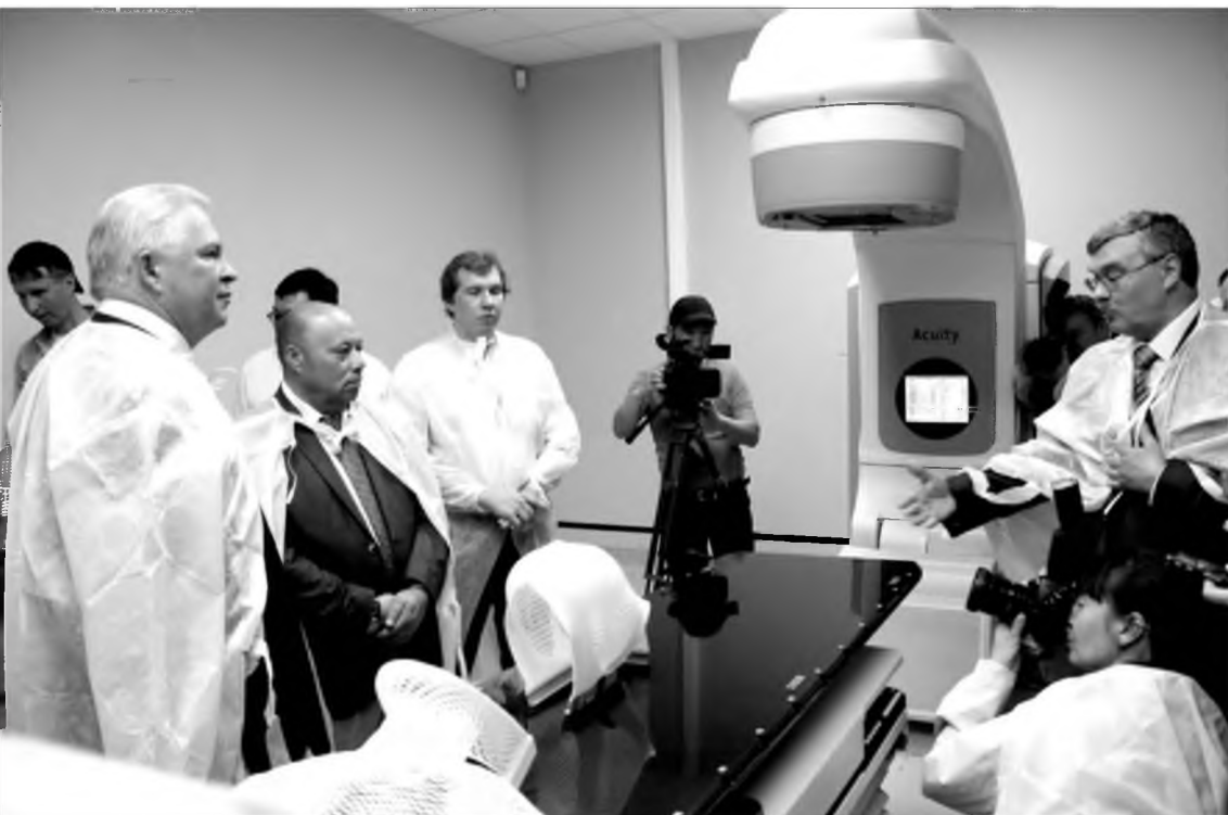
Шэнэ онһон түхээрлэгэ - ускорителин хажууда

гай терапигаар хангагдаха аргатай гэжэ мэдэбэбди. Энэ байшан соонь тусхай түсэблэгдэһэн цифровой станци хүдэлдэг бай- на. Тэрэшлэн Буряадай ажалуугшад Москва, Санкт-Петербургийн меди- цинскэ түбүүдтэ ошонгүй, харин Улаан-Үдэдөө ар-