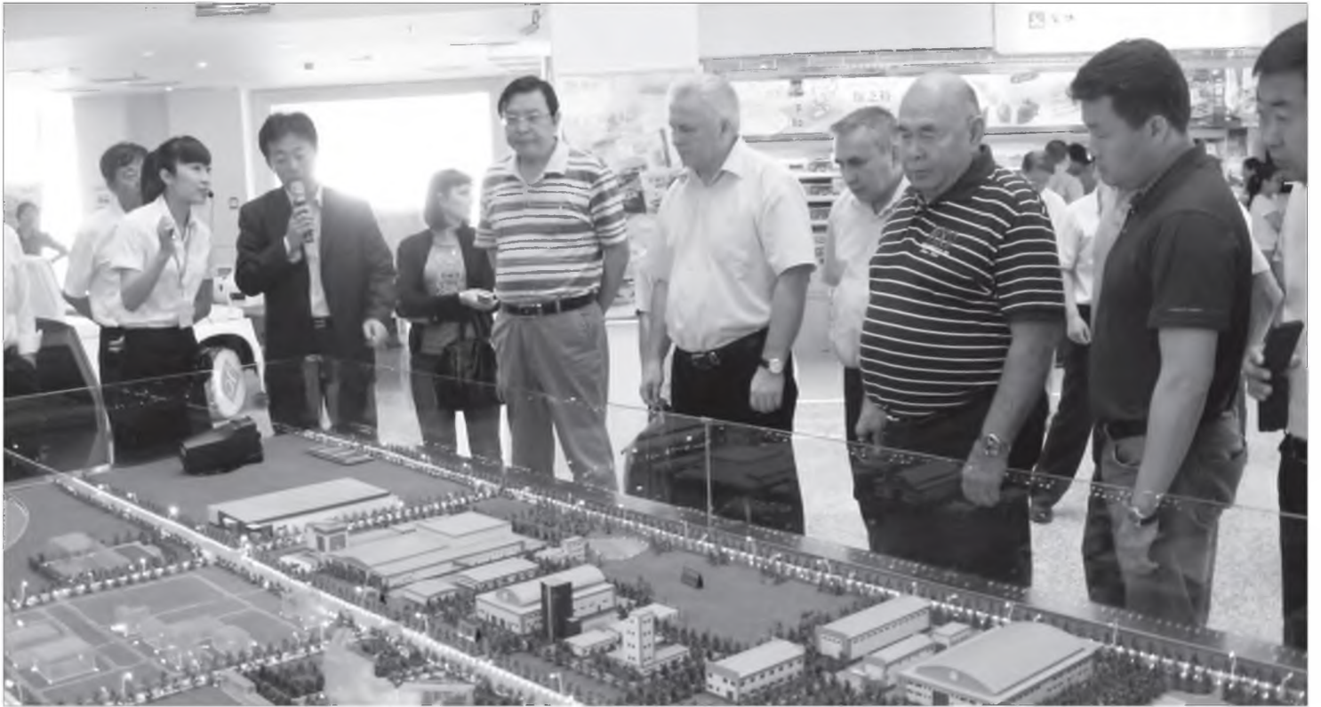
Бурядай делегаци хү хаалин үйлдбэрийн македтэй танилсана

Байгаалида нэн түрүүн үндэһэн уг шуһан (генофонд) мал байдаг юм. Удаань үүлтэрнүүд, түхэлнүүд, һүүлээрнь шугамууд ба бүлэнүүд бии болодог гэшэ ааб даа. Үүлтэр зохёолгын эрдэм - гол, үндэһэн эрдэм.