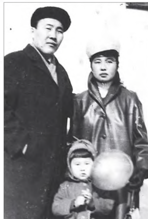
У лзытуевтанай гэр бүлэ Баирма басагантаяа демонстрациин үедэ, 1965 он.