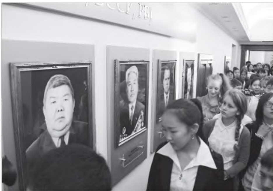
Радна-Нима БАЗАРОВАЙ фото-урагууд

Ерээдүйдэ обществоведени, мүнөө үеын түүхэ шудалха үхибүүд Арадай Хуралай байшангай бүхы дахарнуудаар ябажа, элдэб ондо ондоо ажалтай, харюусалгатай комитедүүдэй болон фракцинуудай кабинедүүдтэй танилсаба. Илангаяа хүүгэдтэ республикын Толгойлогшо-Правительствын Түрүүлэгшэ В.В. Наговицынай министрнүүдэй тоосоо шагнадаг, Россиингаа болон хариин оронуудай делегацинуудые угтадаг зал хайшаагдаба. Тийхэдэ Арадай Хуралай сессинуудэй үнгэрдэг компьютерна столнуудтай, мүнөө үеын түхээрлэгнүүдтэй ехэ зал соо хурагшад орожо, столнуудай саана хуужа, депутадуудай нэрэ, обогуу-