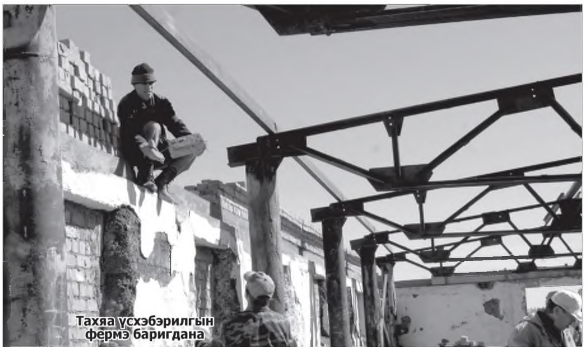
Тахья үсхэбэрлгын фермэ баригдана