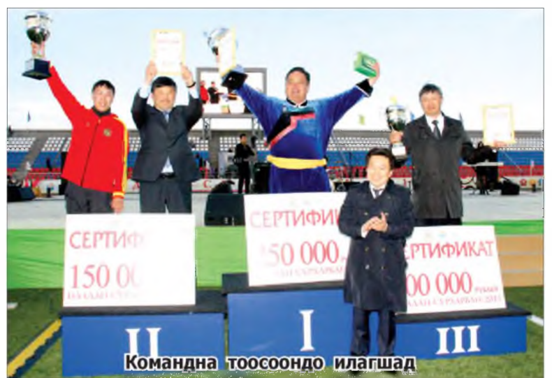
Командна тоосоондо илагшад

Энэ найр нааданда һайн бэлэдхэл хэжэ, түрүүлжэ гара-