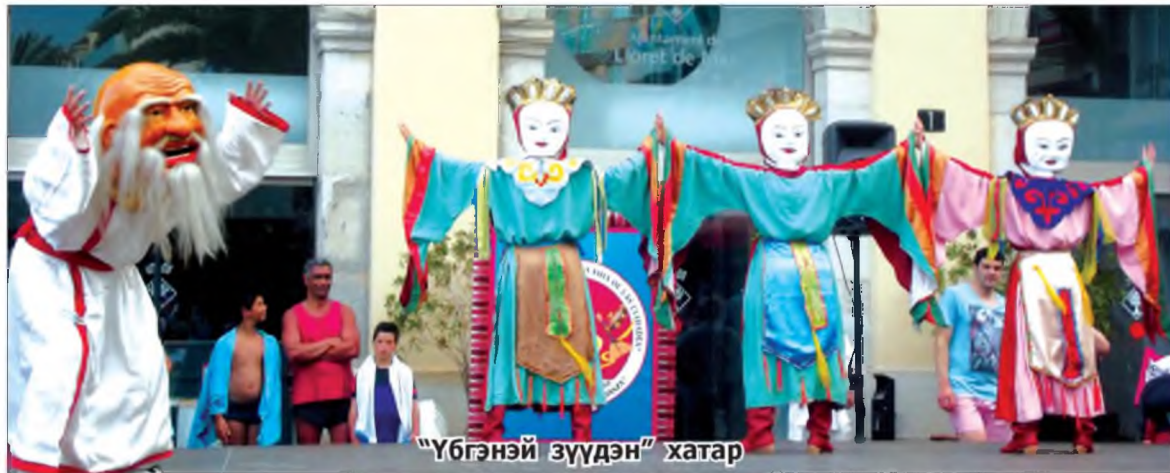
«Үбгэнэй зүүдэн» хатар