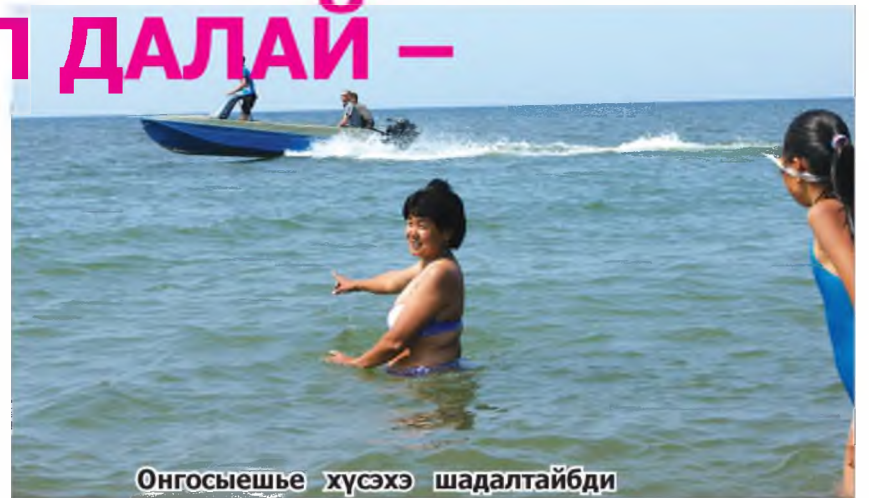
Онгосыешье хүсэхэ шадалтайбди