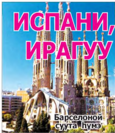
(Үргэлжлэл. Эхинийн 1-дэхи нюурта).

2013 он – Аяншалгын болон хүндэмүүшэ ёһоор угталгын жэл