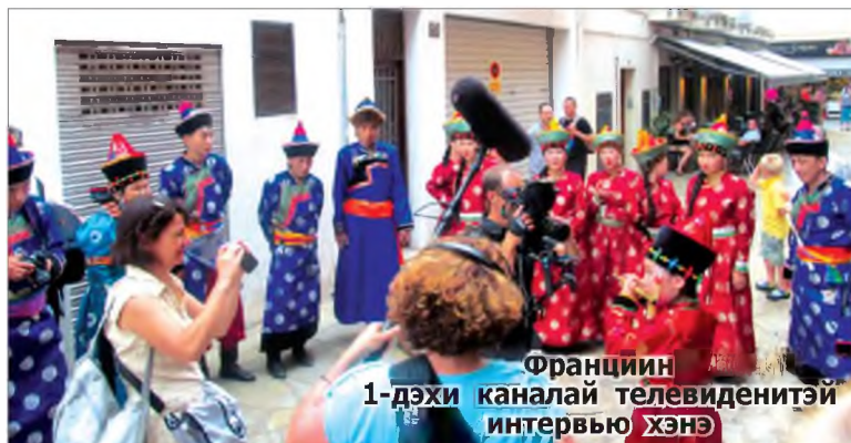
Франциин 1-дэхи каналай телевиденитэй интервью хэнэ