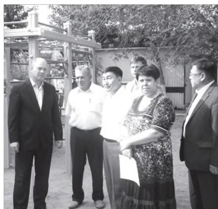
"Улаан-Үдэ хот" хотын Мэдээсэлгын политикын талаар управлениин фото-зураг.

Мүнөө жэлдэ нёдондойнгоо алдуунуудые заһахаяа оролдообди: заал һаа шанар һайтай гэжэ гүрэнэй үнэмшэлгэтэй түхээрэлгэнүүд тодхогдоо, - гэжэ Улаан-Үдын мэр Александр Голков онсолон тэмдэглээд, нёдондо болоһон ушар һануулая. - "Гартаа