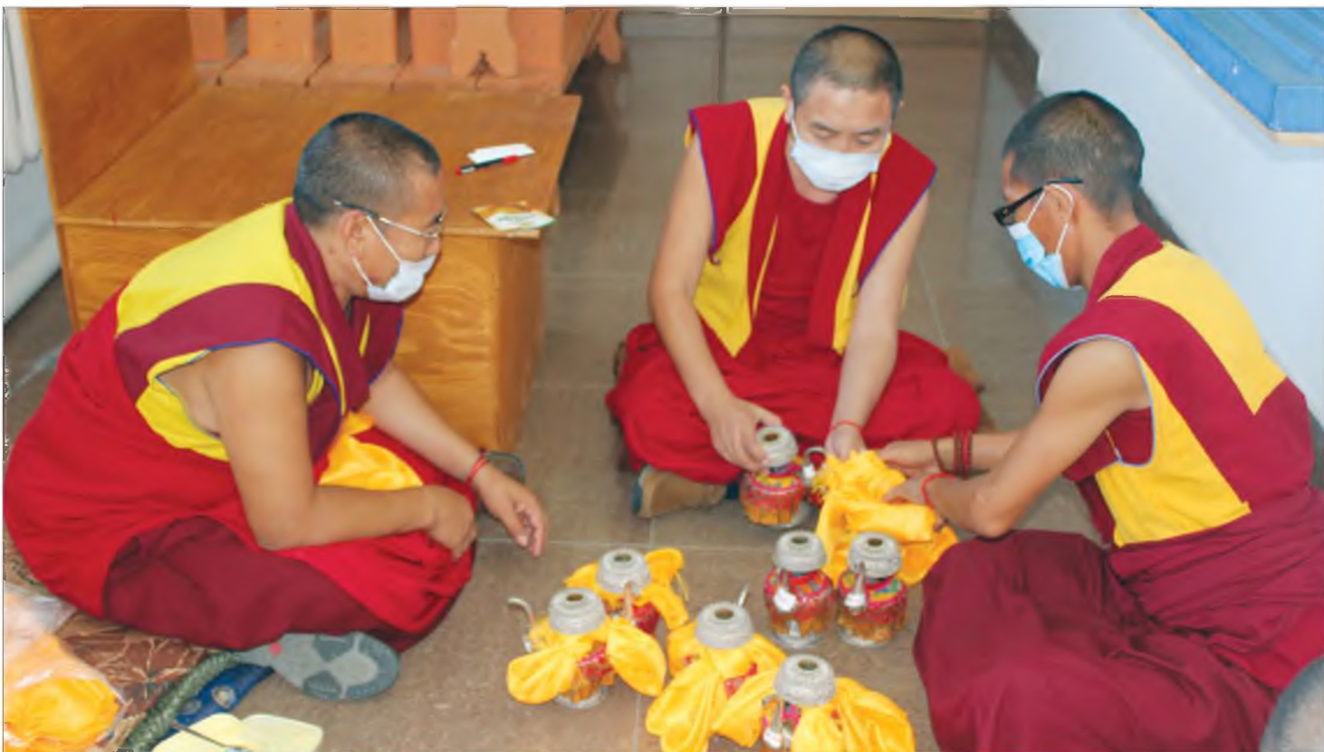
Субаргануудай арамнайда бэлдэжэ байһан түгэд ламанар

искусствын байдалда һайн юмэн, нангин юмэнэй ойлгосон дуталдана гэжэ тэмдэглээ. Харин гансал хүн зондо тухалалсан, һайн ханаа, һайн хүсэл дэлхэйдэ түхөөһэн искусство үнэн гэжэ тоолохоор байна гэжэ тэрэ тэмдэглэһэн байна.