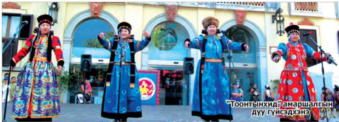
«Тоонтынхид» амаршалгын дуу гүйсэдхэнэ