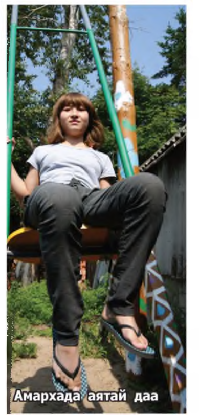
Амархада аятай даа