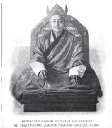
Хаан тайжые Асагадай дасан соо угтаһан ахамад бандида-хамба лама