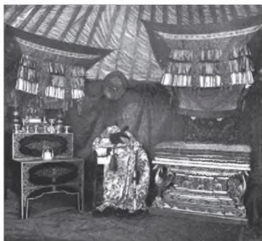
Хаан тайжын нэеы гэр