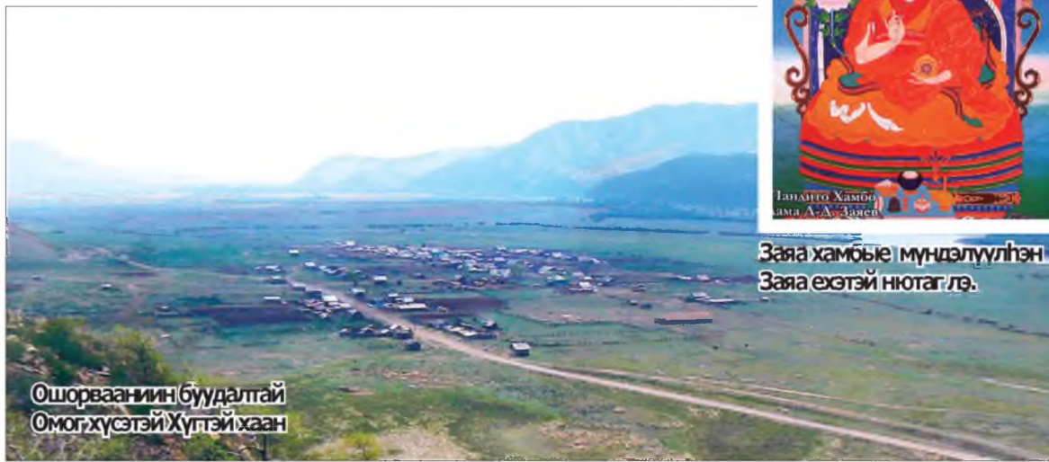
Ошорваанин буудалтай Омог хүсэтэй Хүгтэй хаан

Иимэ домог бии юм: Дамба-Даржа Заяев түрэнэнэингөө удаа жэлэй туршада 7 наһатай үхибүүнэй бэе махабдадай болотороо ургаһан, ухаагаараашье иимэ хэмжээндэ хүрэнэн ха. 20 жэлдэ Түбэдтэ нураһанай удаа гэлэнэй, удаань габжын зиндаатай боложо, нютагаа бусаад, түрүүшынгээ мүргэлые хэжэ байхадаа, иигэжэ айлагдаһан: «Энэ саһаа хойшо та бүгэдэн Буддын шажаниё Байгал шадар дэлгэрүүлхын тула сонгоолнууд гэжэ нэрэтэй болохот (Сонгохо - избирать, избранный)». 1767 ондо Д.Д.Заяев Екатерина II хатанай Зарлигаар бандидо хамба ламын нэрэ зэргэтэй болоһон. Хонирхолтойнь гэхэдэ, тэрэ олон халбарита ажал ябуулгынгаа хажуугаар Түбэд ошоһон тухайгаа түрүүшын буряад географическа зохёол бэшлэнэн юм байна. 1900 ондо тус зохёолыень А.М. Позднеев эрдэмэй жасада оруулһан