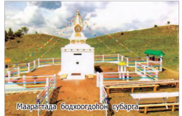
Маарагтада бодхоогдоһон субарга