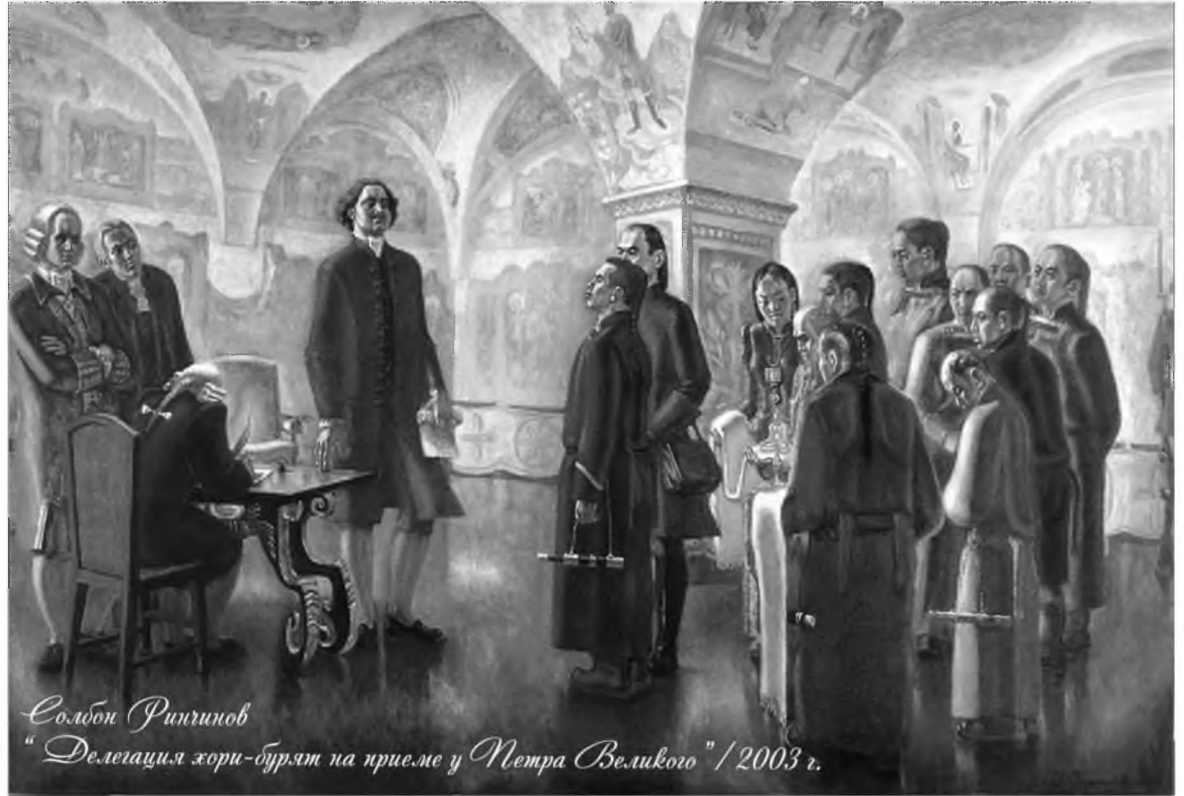
Солон Ринчинов "Делегация хори-бурят на приеме у Петра Великого" / 2003 г.

Үе-үе тахал (эпидеми) үбшэн боложо, олон зон зобохо, тэрээгээр үбшэлһэн залуушуулай хахадын үхэжэ байдаг дээрэнһээ, 1808 он тухайда ехэ дээдэ император нэгэдүгээр Александр хаанай захиралтаар сэсэгэй тарилга хэхэ (оспо-