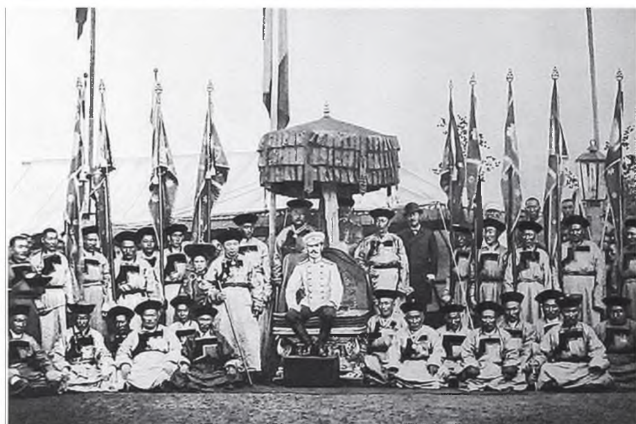
Хаан тайжа Николай Александрович Агын албан зургаанда һунгагдаһан буряадуудтай суг хамта (1891 оной июниин 17)