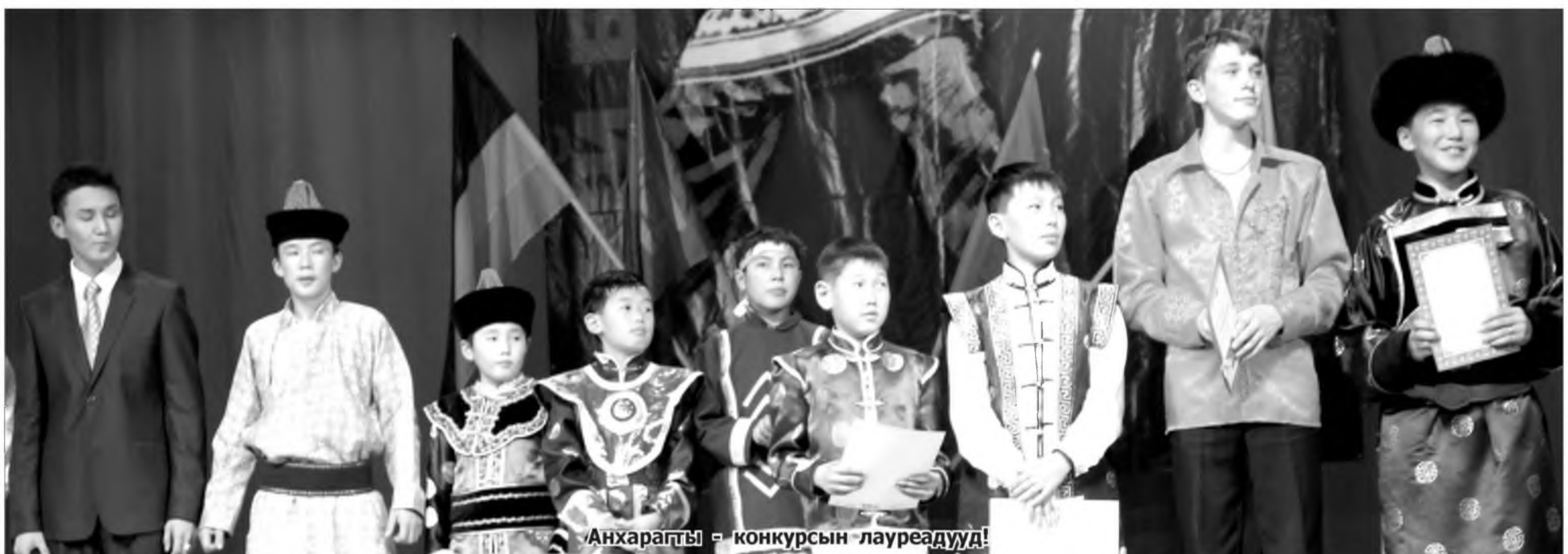
Анхарагты – конкурсын лауреадууд!