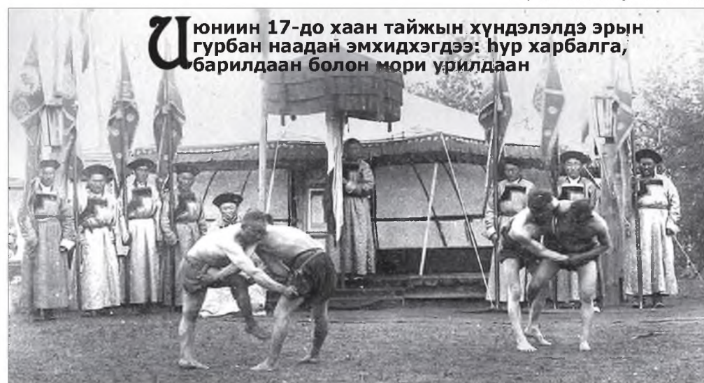
Июниин 17-до хаан тайжын хүндэлэлдэ эрын гурбан наадан эмхидхэгдээ: һур харбалга, барилдаан болон мори урилдаан