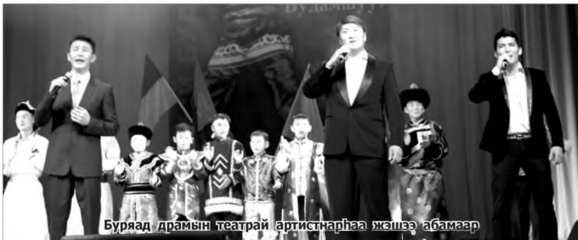
Буряад драмын театрай артистнаһаа жэшээ абамаар