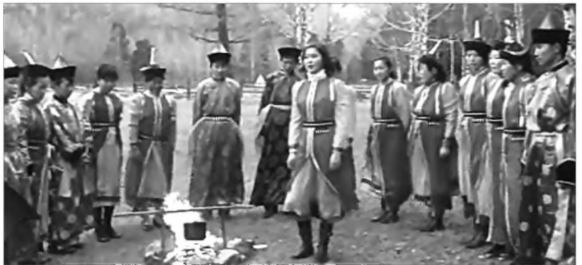
Лицей-интернадай һурагшад буряад ёһо заншалаа һэргээнэ

Урда үеын засагай алдуунууды буряад арадай залуушуул мүнөө хүрэтэр амаһаһаар байдаг. Мүнөө үедэ город болон аймагай түбтэ ажаһуудаг залуушуул, заахан үхибүүд буряад эхэ хэлээ мэдэнэгүй. Минии һанахыда, зарим багшанарай, артистнарай, эрдэмтэдэй үхибүүд үндэнэн хэлэн дээрээ хөөрэлдэнэгүй, тэрэнэ ехэл голдолтой. Манай аба, эжынар хэлээ бүү мартатгы, ёһо заншалаа сахижа ябагты гэжэ маанатаа захижал байдаг.