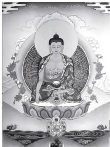
(Эхинийн урдахи дугаарнуудта).

(Бэлиг-үүн шанада хизагаар-аа хүрэгсэн, ошор-ияар огтологшо нарата ехэ хүлгэн судар оршобо)