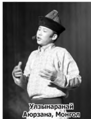
Улзынارانай Аорзана, Монгол