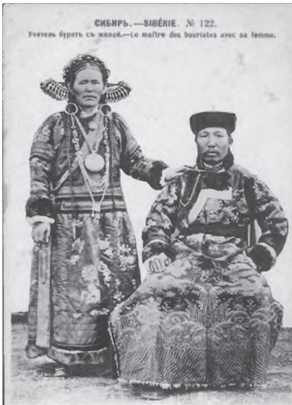
СИБИРЬ.—SIBÉRIE. № 122. Учитель бурятъ съ женою.—Le maître des bouriates avec sa femme.