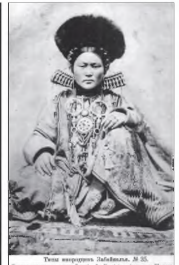
Тины ивородцевъ Забайкалья. № 35. Бурятка сидитъ на лежанкѣ у костра.—La Bouriate assise sur le poêle.