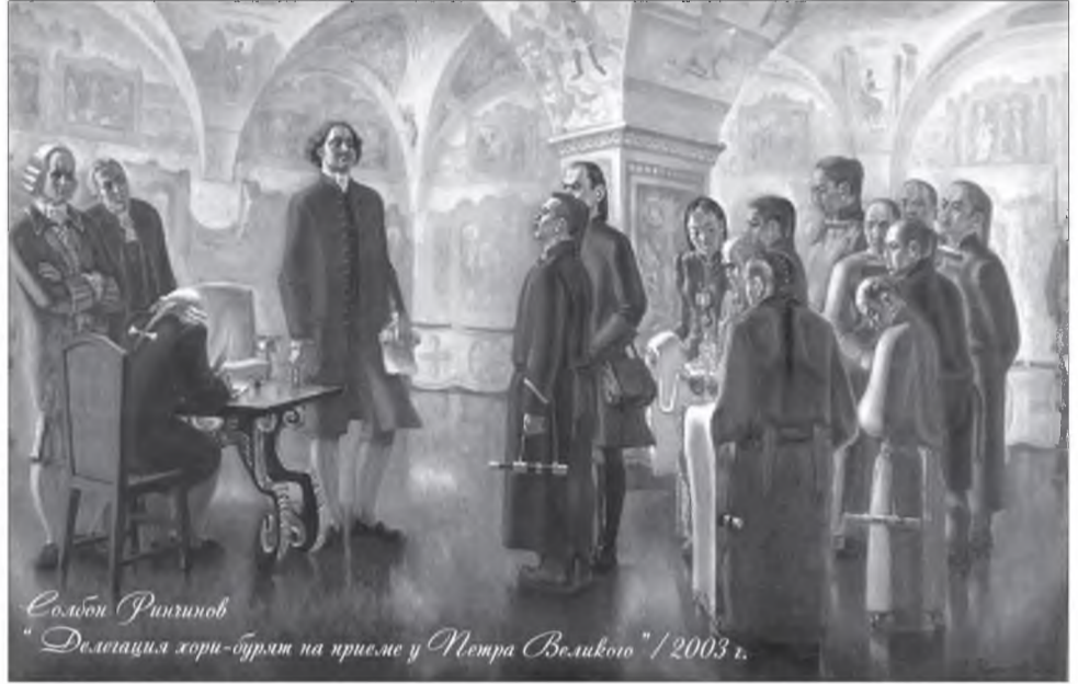
С.Павлов "Делегация хори-бурят на приеме у Петра Великого" / 2003 г.

Тиинхэдэ Сибириин буса түрэлтэнэй алба шэнээр зохёохо комисси ерэжэ, 1831 ондо зоной тоо абалган болоходо, агын буса түрэлтэн урдынхиһаа үдэжэ, 8797 эрэ амин болобо. Тэрээнэй ба аминийн түбхинэн, 18-һаа 50 хүрэтэр наһатай хүдэлмэришэд 4054 эрэ амин боложо, 6-6 түхэриг алба түлэхэ болобо.