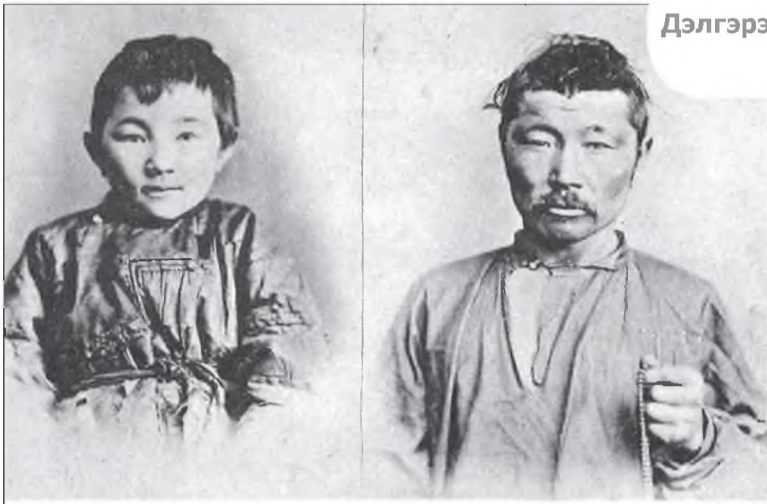
Тины ивородцевъ Забайкалья. № 10. Бурати: мальчикъ и взрослый мужчина.—Types de Bouriates.