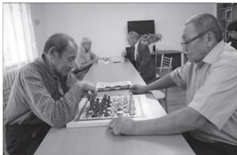
шүүмжэлхэгүй. Юуб гэхэдэ, наһатайшуул энэ түбтэ ажаһууха дуратай байна, манда ээлжээн бии юм, - гэжэ Вячеслав Наговицын хөөрөбэ. Цырегма САМПИЛОВА, Радна-Нима БАЗАРОВАЙ фото-зурагууд.