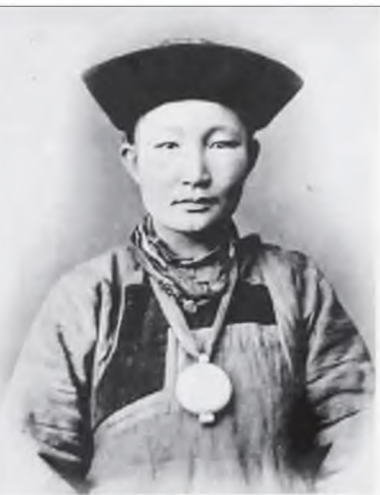
Тины ивородцевъ Забайкалья. № 31. Тины бурятъ дьавиць.—Les Bouriates Types des jeunes filles.