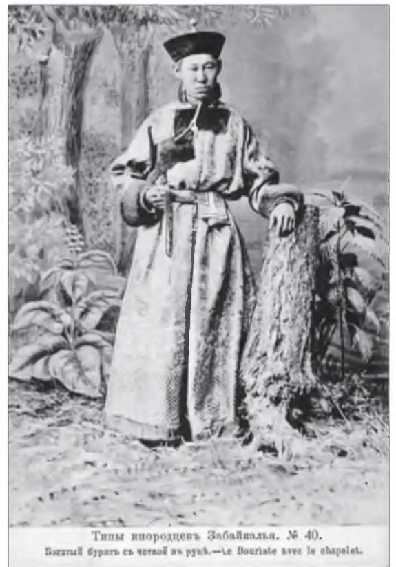
Тины ивородцевъ Забайкалья. № 40. Бурятъ бурятъ съ чепкой изъ шерсти.—La Bouriate avec le chapelot.