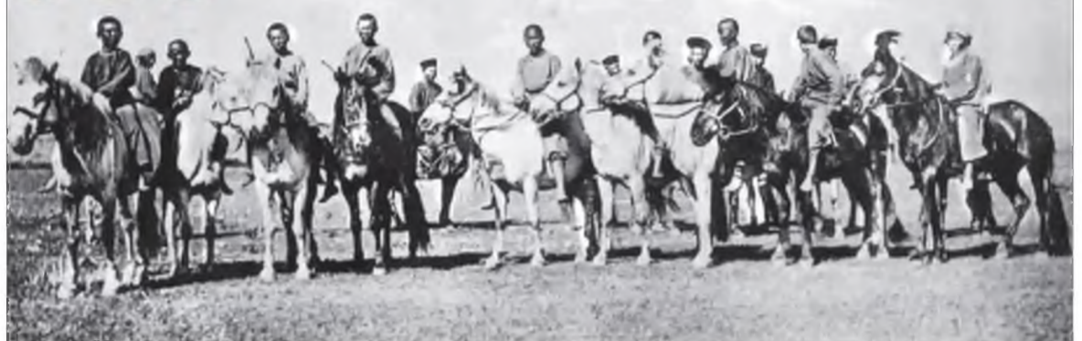
Тины ивородцевъ Забайкалья. № 21. Скачка у бурятъ во время праздниковъ. La course de chevaux des Bouriates pendant la fête.