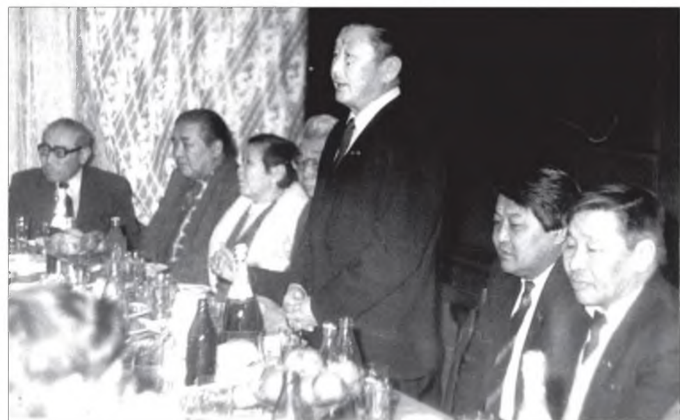
«Буряад үнэн» газетын 70 жэлэй ой. «Кедр» ресторан соо

байха үедөө тэрэ хүшөөнүүдыг хамгаалха, һэргээжэ талаар горитой ажал ябуулба. Хяагтада Воскресенскэ хүмэ, Галууга-Нурый дасан, декабристнууд аха дүүнэр Бестужевуудай байшан гэрнүүд, бусад хүшөөнүүд һэльбэн шэнэлэгдэжэ эхилээ һэн. Түүхын болон соёлой хүшөөнүүдыг хамгаалха бүхэроссиин бүлгэмэй Түбэй сөвөдэй гэшүүнээр һунгагдаһан байгаа.