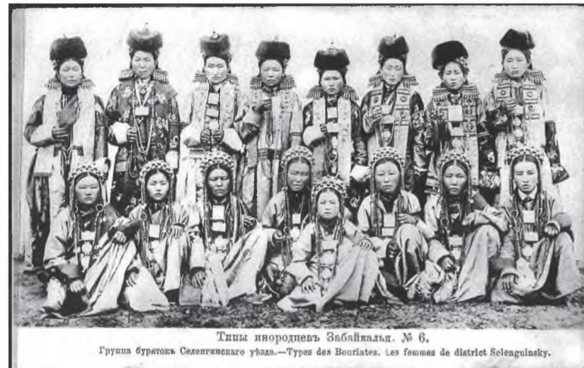
Тины ивородцевъ Забайкалья. № 6. Группа бурятокъ Селенгинскаго уезда.—Types des Bouriates. Les femmes de district Selinginskyy.