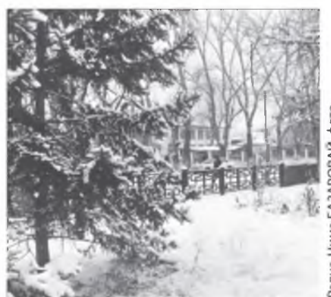
Энэ хуудаһа Ц.САМПИЛОВА бэлдэб.

10. Олоһон бүхы эрдэмээ бусад зоной амгалан байдалда зорюулагша хүн алдуу хэнэгүй.