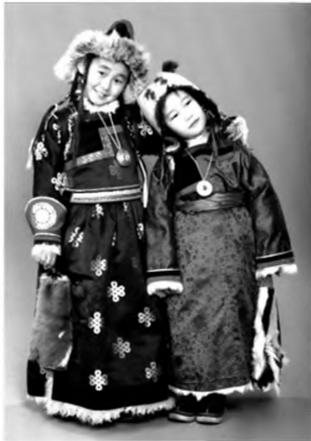
Торгон гадартай үзүүр дотортой басаган дэгэлтэй, мүн торгон гадартай һомон дэгэлтэй басагад

Эхэнэрэй гоёолто зүүдхэлнүүд олоншые һаань, дэгэлэй тобшонууд баһал тусхай гоёолто боложо үгэдэг байгаа. Дээдэ, дунда, доодо тобшо хадагдадаг. Тиихэдэе тобшо бүхэн өөрын удхатай һэн: дээдэ тобшо