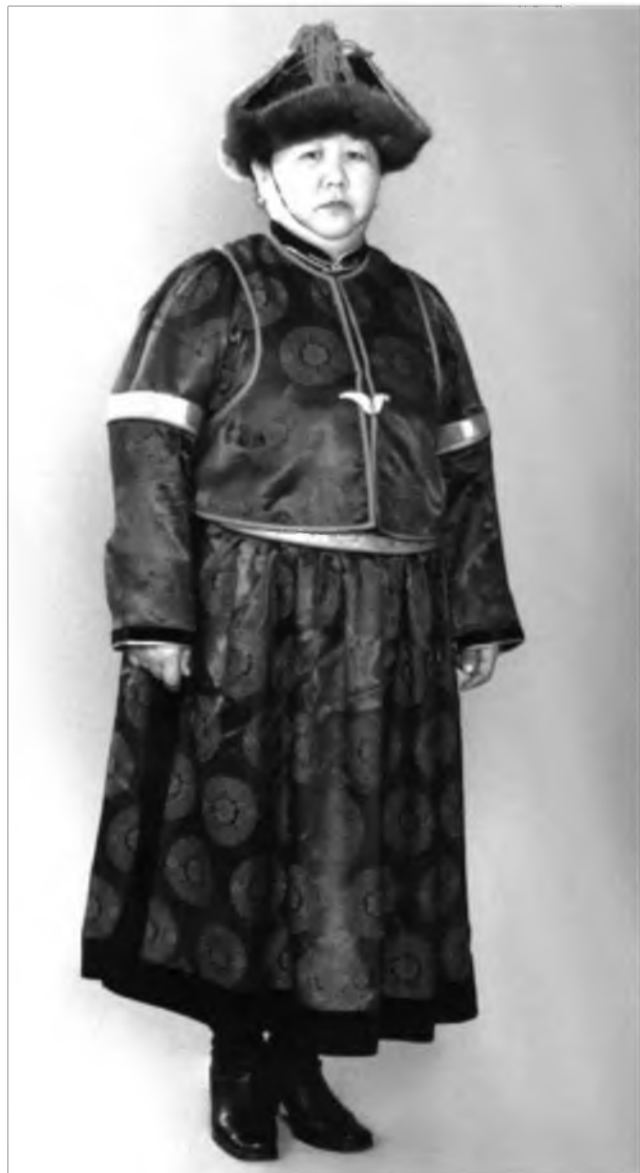
Һамган дэгэлтэй, эсэрын (богони) уужатай эхэнэр

Һ үүлэй үедэ зомнай үндэнэн буряад хубсаһаа эсгнэдэг боложо байнхай. Юрэ үдэрнүүдтэ буряад дэгэлэе хэрэглээшыегүй һаа, сагаалганһаа гадуур ехэ-ехэ баярай хэмжээ ябуулгануудта заабол үмдэдэг ёһо тогтожо эхилэнхэй. Жэшээн, хото хүдөөгэйшые гэртэжин хадамда гаража байһан басагандаа зорюута дэгэл оюулдаг, мүн тиихэдэ эхэнэрнүүдтэ ойн баярай дэгэл үмдэхүүлхэ гурим нэбтэржэ байнхай.