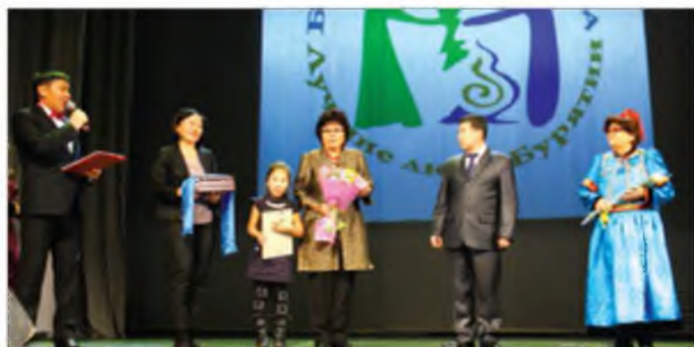
«Аласай холбоон-2013» номинациин лауреадууд