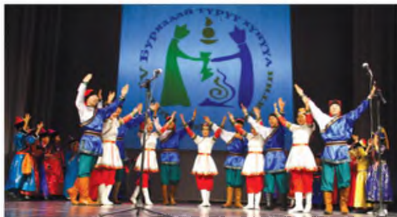
«Наран» ансамбль хатарна