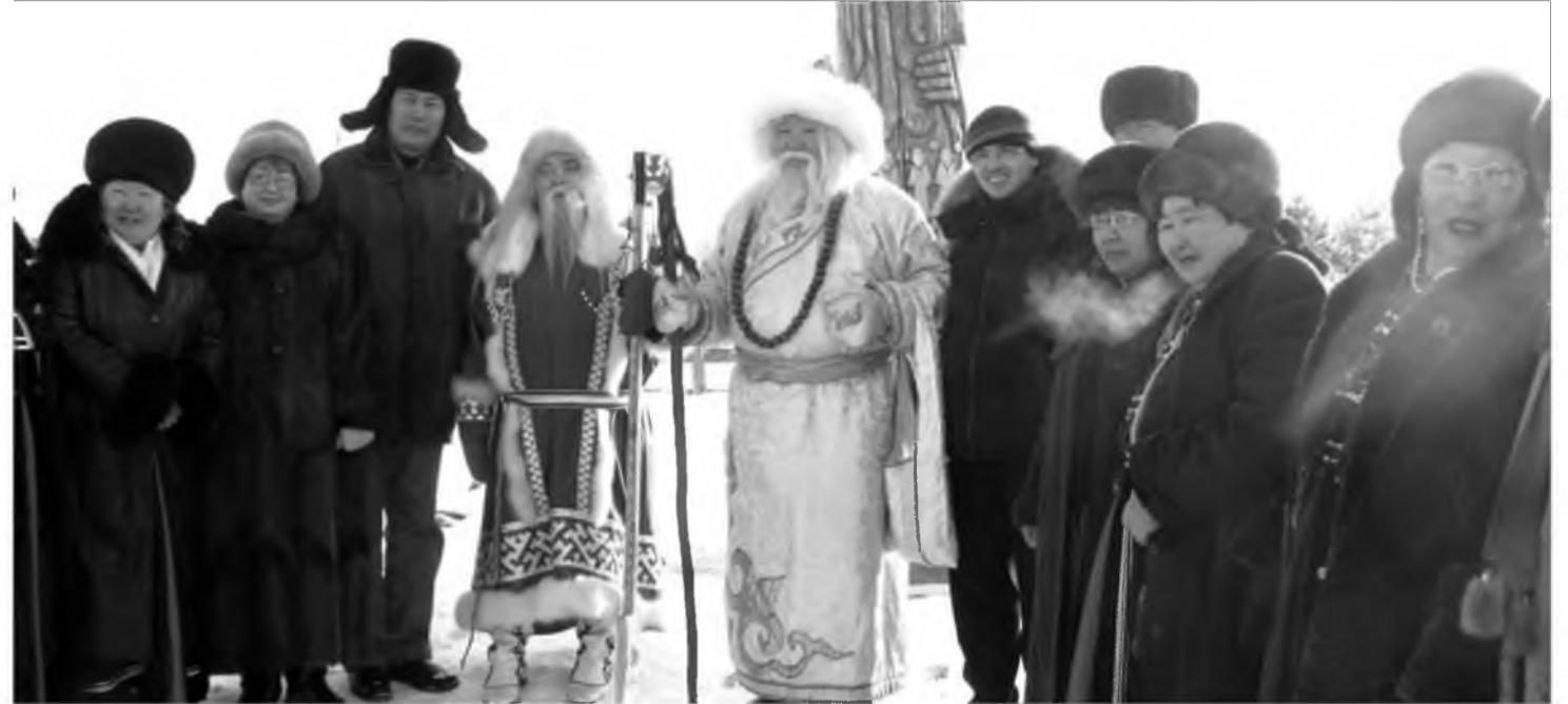
«Ойхон» ансамблиинхид Жабар үбгэниие угтана

Загаһа онгосо, баркасаар дүүрэн баридаг һэн. Эрье дээрэһээ харахада, загаһан уһан дээгүүр миралзажа,