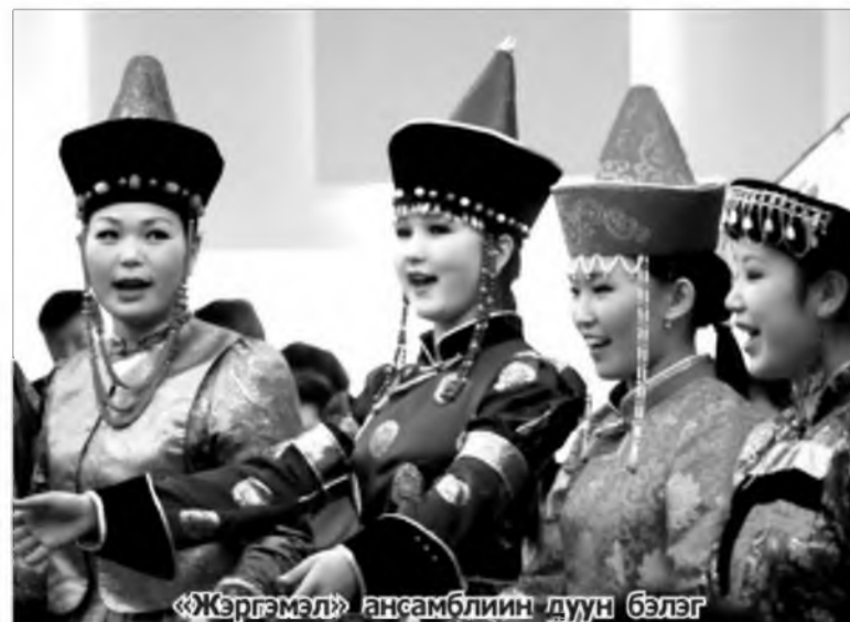
«Жэргэмэл» ансамблин дуун бэлэг