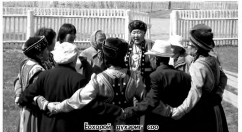
Ёохорой дүхэриг соо

БАЛШАР ябахаһаа эхилжэ, загаһанай үнэртэй онгосодо мүнэн түрһэнһөө ходо халадаггүй гүльмэнүүдтэ, хүндэ аад, ута гэгшын һэлжурнүүдтэ анханһаа даданан ансамблиин дуу-