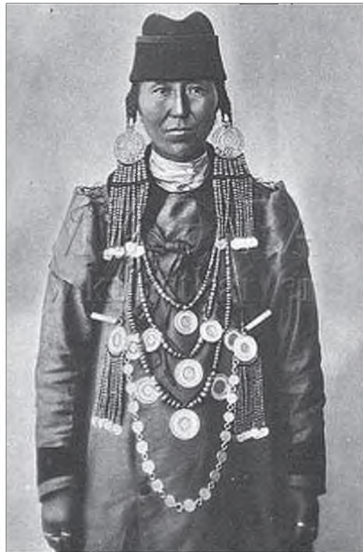
З унай тэрлигтэй буряад эхэнэр