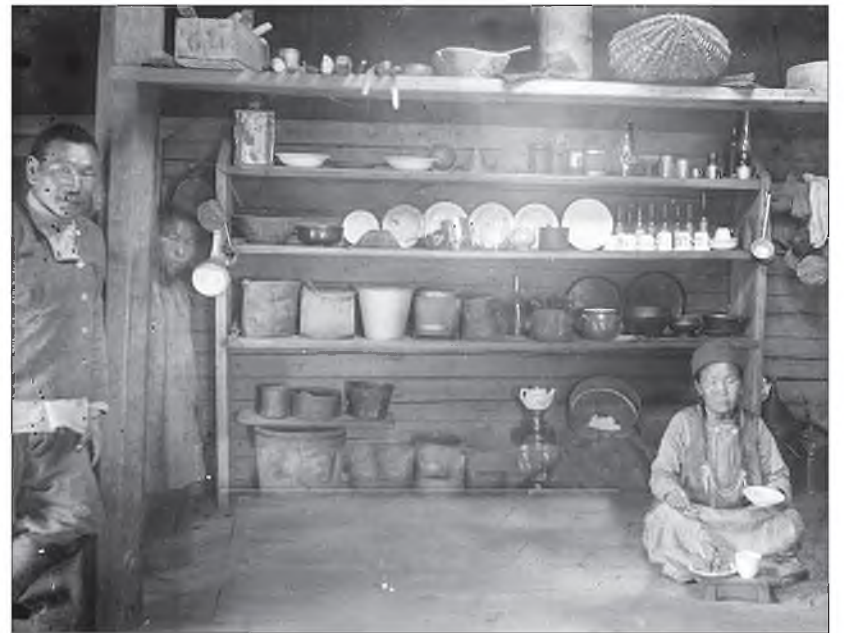
А нхан буряадуудай гэрэй хэрэгсэлдэ шэрэм тогоонууд, зэд гүсэнүүд, модон амхартанууд, архан туламууд ородог байгаа. Тэдэ туламууд соогоо орооно болон талха хадагалдаг, мүн зөөхэ багтаа жэжэ зөөриэ хэдэг байгаа. Модон амхартанууды нэрлэбэл: хүнэг, гудхуур, тарэг бүлэдэг наба, тэбшэ, түнхимэл табаг, модон шанага, сайн тагша.