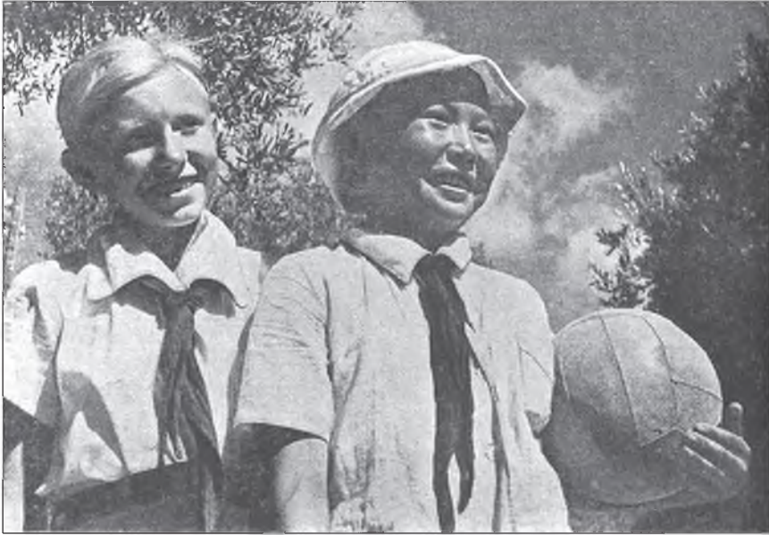
З десь вместе смеются, поют и играют Китаец, бурят и удмурт. (Из артековской песни.)

Дэлгэрэнгыгээр сайт дээрэмнай уншагты: burunen.ru