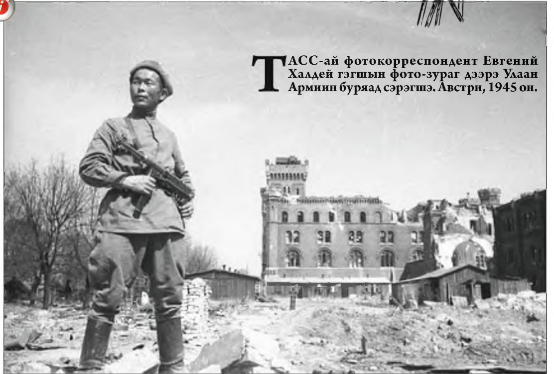
Т АСС-ай фотокорреспондент Евгений Халдей гэгшын фото-зураг дээрэ Улаан Армин буряад сэрэгшэ. Австри, 1945 он.