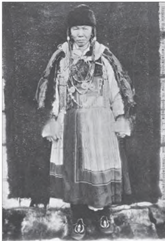
Ү бэлэй дэгэлтэй буряад эхэнэр