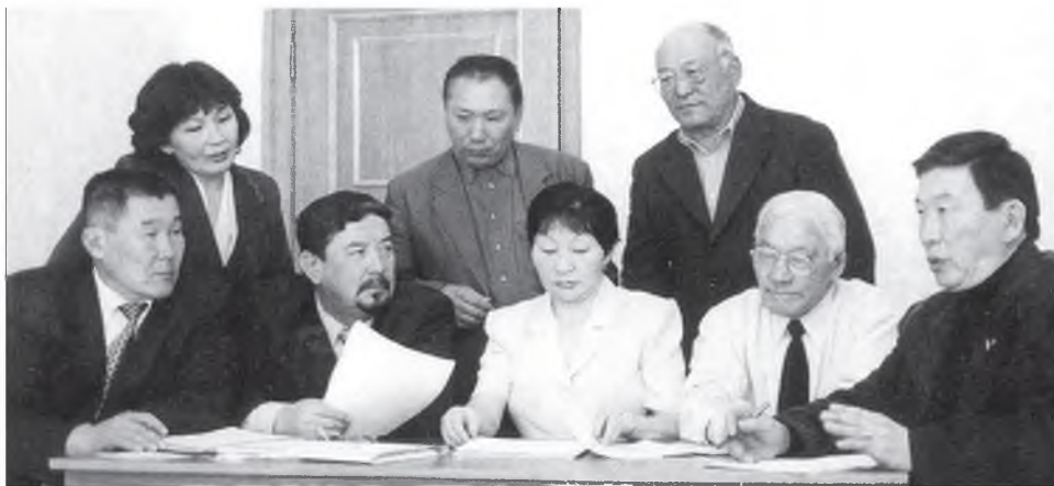
Агын уран зохёолой нэгэдэлэйхид аха хүхэр тухайгаа уншалга хэнэ