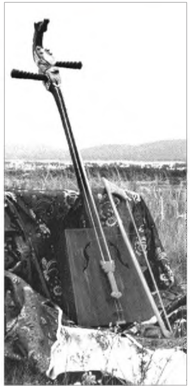
граф: «Мориной нэрэ дурдаагүй дуун манай арадта байдаггүй» гэшэһээ уламжалан, бидэ баян аман зохёолойнгоо үльгэр, домог, оньһон хошоо үгэнүүд, дуунууд, үрээлнүүд соо морин эрдэниин хүн зондо сэгнэшгүй үүргэ дүүргэдэг байһыень тобшолбоди.

3.3. Багшын тобшолол: Мүнөөдэр, бидэ, үхибүүд, морин эрдэниин үүргэ тухай хэлсэбэбди. Буряадуудай ажабайдалда морин эрдэниин ямар аша тунһатайе, А.Лыгденовэй рассказ соо морин тухай домог хаанаһаа эхилэ абажа бии болоһые, ямар хадань морин эрдэни гэжэ арад зоной дунда дэлгэрһые, мүн тийхэдэ ямаршые аман зохёол соо морин тухай хэлсэдэг, бэшэдэг дээрэнь тогтообди. Хэшээлэймнай эпи-