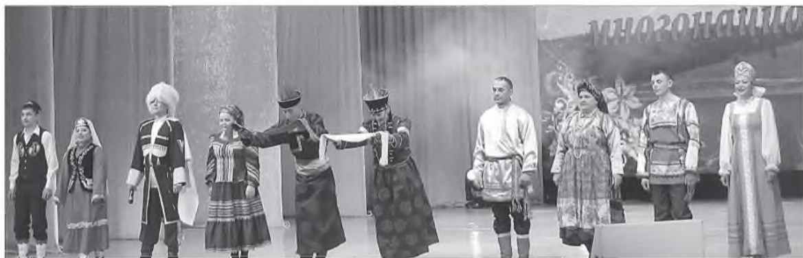
Мухар-Шэбэрэй аймагта 5 ондоо үндэнэ яһатан эб нэгэн ажаһууна