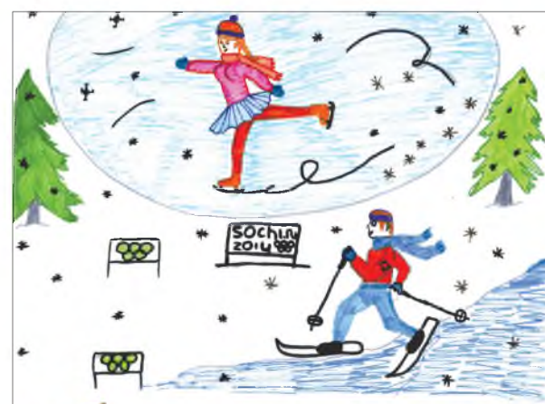
Ярова Диана, 7 б класс Онохойская средняя школа №1