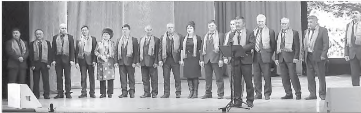
Мухар-Шэбэрэй бүхы нютагуудай гулваанар