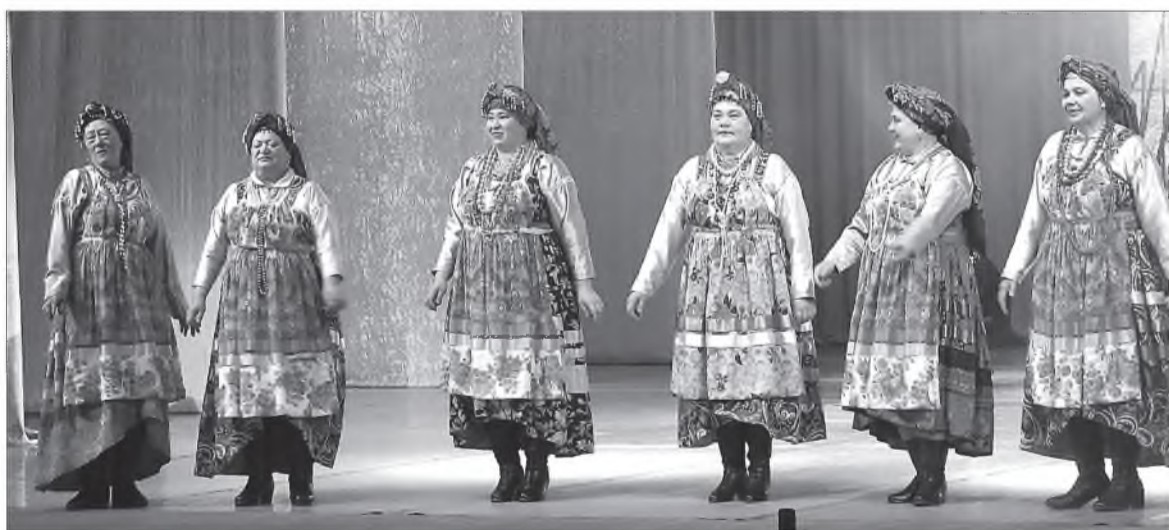
Шаралдай нютагай шэмээшэгүүдэй дуун бүгэдэ зондо һайшаагдаа