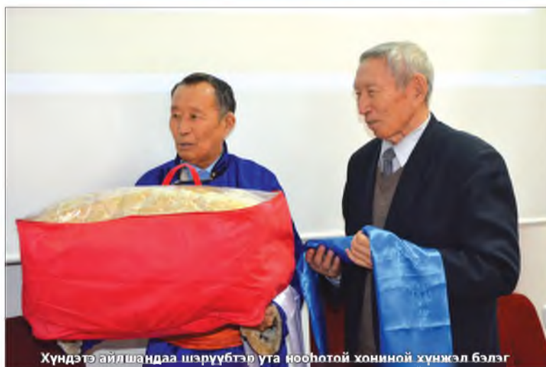
Хүндэтэ айлшандаа шэрүүбтэр ута ноһотой хониной хүнжэл бэлэглэ