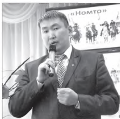
- Танай лицей-интернатдай команда хэды хүнһөө бүридэхэб?

Мартын 21 - нэе 30 болотор шатарай мурьсөөндэ дүтэрхы багсаамжаар 150 гаран ондоо регионудай эдир шатаршад хабаадаха хүсэлтэй байна. Үшөө тиихэдэ хүдөө аймагуудаймнай олон тоото үхибүүд ерэхээр хараалагдана.