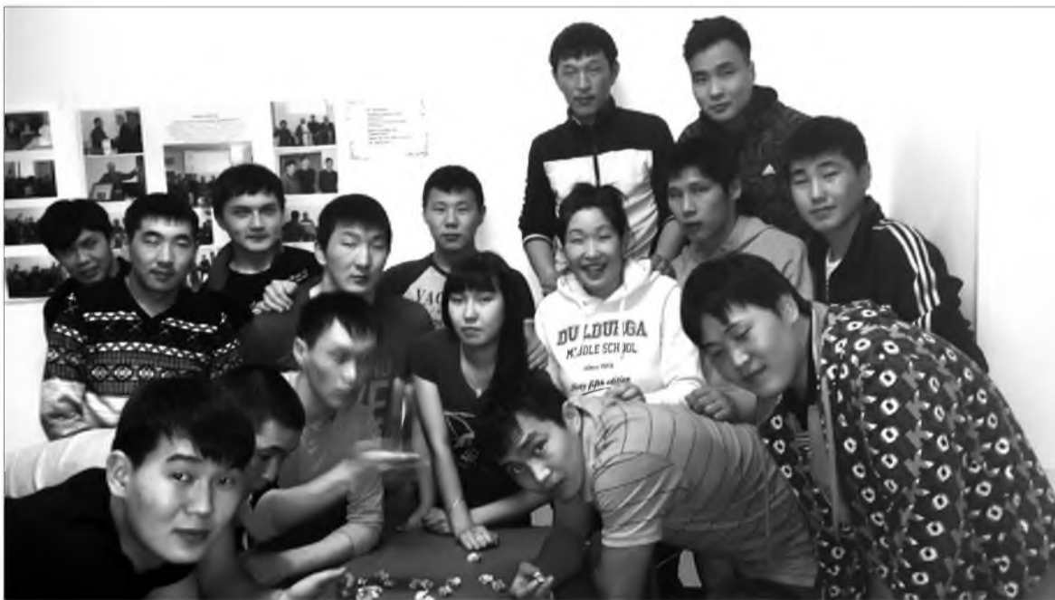
Шагай наадан. Хүдөө ажахын академиин хамтын байрада

ХОНИНОЙ баабхайнууд үхибүүн болодог. Хониной ша- гай хүүгэдэй нааданда ехэ үүргэ дүүргэдэг. Тэрээгээр наададаг наадан олон юм. Хониной шагай дүрбэн түхэлтэй: морин, тэмээн, хонин (бүхэ), ямаан (хонхо). Хүүгэдэй шагайгаар элдэб наада дуратайгаар наададаг хада айл бүхэндэ хэдэн үе дамжан суглуулһан олон ша- гайтай байдаг һэн. Хэнэйхи хэды шагайтайб гэжэ хүүгэд хүршэ айлнуудайнгаа ша- гайн тоо мэдэхэ ябаа. Айл бүхэнэй тугал туулмагтай ша- гай харахада, үни удаан саг соо нааданда элэжэ, алтан шара болошоһон, нүүрһэндэ,