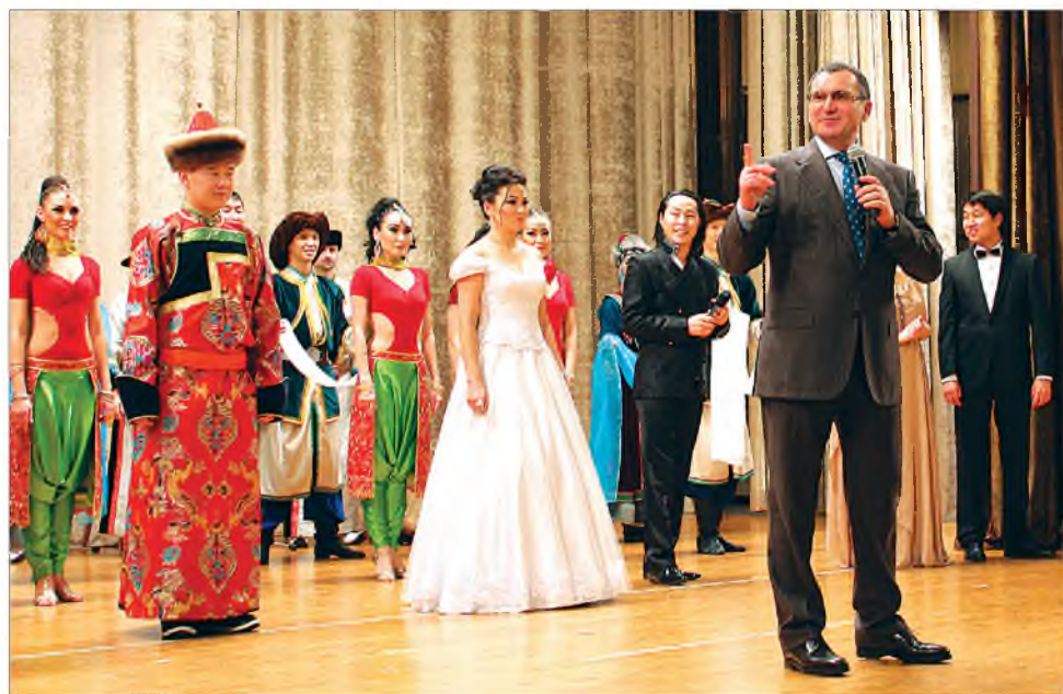
Россиин хүдөө ажахын министр Николай Фёдоров Буряадай артистнарые магтана

- Европын улад айхабтараар һонирхоо. Тиимэһээ тэрээгүүр Буряадай артистнарай гастроль эмхидхэхын тула арга бэдэрхэбди, - гээд, Александр Чепик найдүүлба. Удаань тус театруудай ударидагшадта баярай бэшэг барюулба.