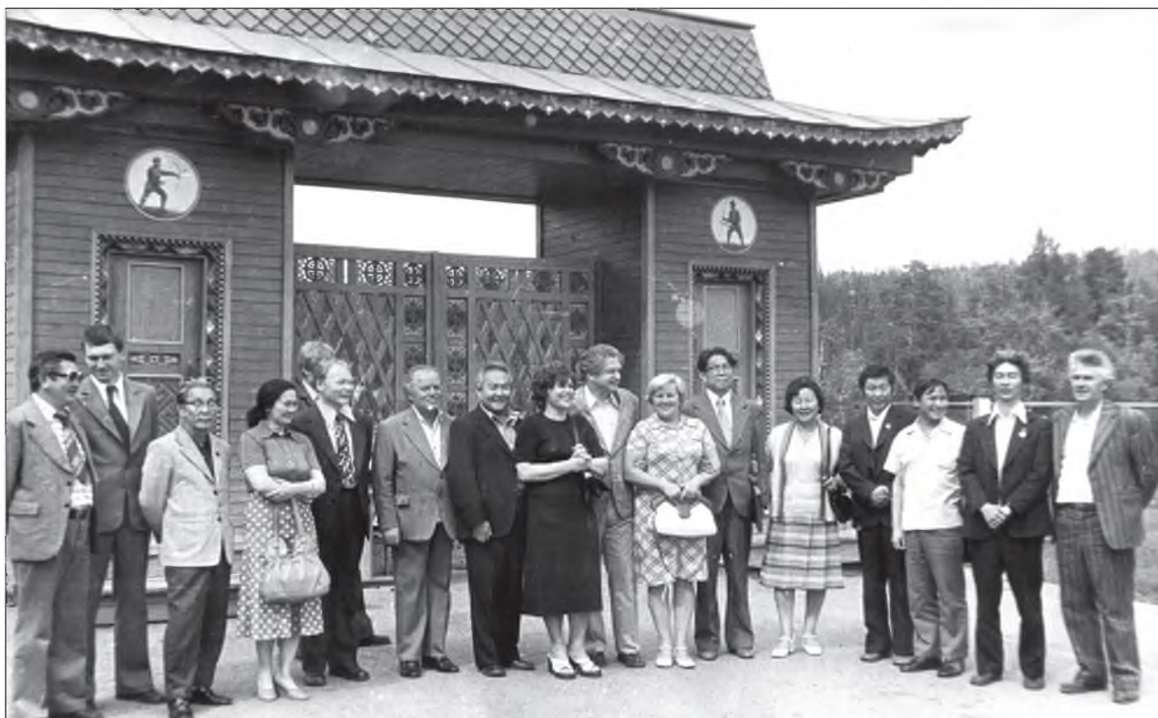
Б урядай уран зохёолшод Москвагай, Ленинградай болон Россиин республика ба автономно тойрогуудай нүхэдтэйгөө. Россиин уран зохёолшодой нүүдэл секретариат Буряад орондо (1978 он).