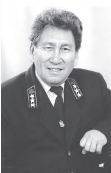
Дүнзэнэй Лопсон Дэмшээтэнһээ угтай. Басни бэшэдэг Элбэг Манзаровуудһаа тарһан,

Үгэ бүхэнөө нарилжа, шүлэг бэшэжэ ябаһан,