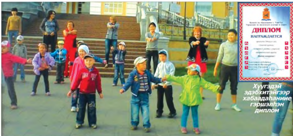
«Суг хэхэдэ аятай» гэнэн үглөөнэй зарядкада

Ородоороо «Золотой ключик» гээд олониитэдэ мэдэжэ болоһон Улаан-Үдэ хотын 59-дэхи сэсэрлигтэ үхибүүдэй һонирхохо алибаа ушар гү, али үйлэ шэнэ үдэрэй эхилхэ тума болоод лэ орхидог. Нэгэ үдэр Бурядай элитэ хүгжэм найруулагша ерээд, дуунуудаа гүйсэдхэхэ. Нүгөө үдэр хүүхэлдэйн театрта хүдэлдэг артистнууд ерээжэ, үльгэр онтохоной шэдитэ орон руу уриха. Гэртэхинэй хэшээлнүүдтэ хабаадахада, энээдэ-зугаатай, аялга дуутай зохёохы үдэшэнүүд яһала олон болдог.