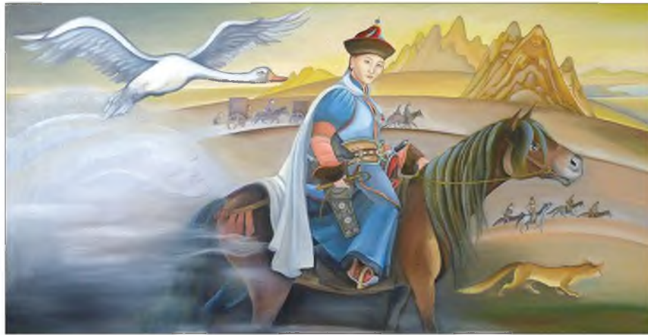
Намнанай багшын субарганай хажуудахи Жараанай нуур

“ХХ зуун жэлэй сэмүүн, мэлуюн халта, хашалган зоболониё бэе дээрэ үзэнэн хүнэй дурсалганууд энэ ном соо оруулагдаа. Манай усынхинэй үзөөгүй юмэн үгы. “Сүүгэлэй дасан”, “Сэмүүн саг” гэнэн номууд соо шажаниё һэргээһэн үбгэн ламанар тухай бэшэгдэжэ байна. Лама бүхэн “Нангин, гэгээнүүд” байгаагүй. Би хэршыё һүзэгтэй һаа, үнэниёнь бэшэхэ баатайб. Агван Доржиев, Ганжарбын