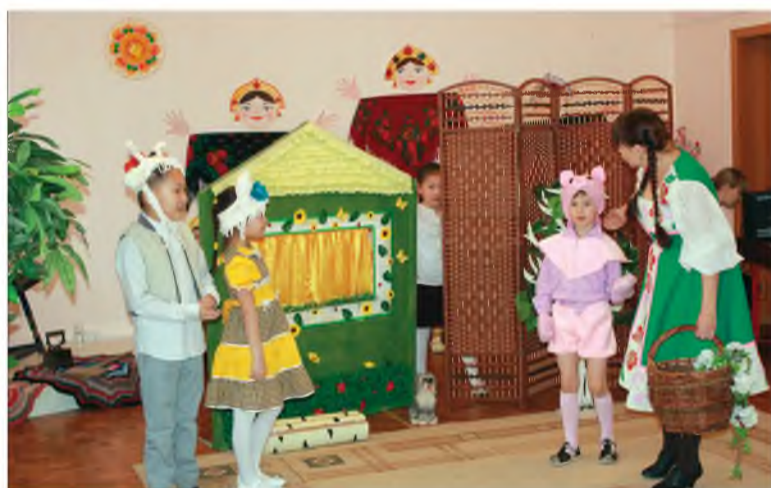
Хүүгэдтэ театр айлшалаа