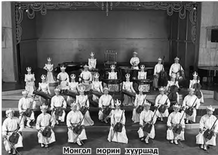
Монгол морин хууршад