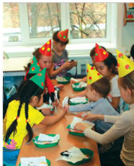
Юмэ улаан гараараа хэхэдэ урматай даа

тын 69 жэлэй ойн гүйсэжэ байха үеэр эндэхи эдиршүүл хүмүүжүүлэгшэдэйнгээ мэргэн хүтэлбэри доро Афган болон Чечен дайнүүдта унаһан баатар сэрэгшэдэй хүшөөдэ ошожо, хэнэй, юунэй тулада иимэ хүшөө Улаан-Үдэдэ байгуулагдаһан гээшэб гэнэн удха түгэлдэр хөөрөө шагнаба. Баглаа сэсэгүүдыёе балшар бага хүүгэд гэртэхэнь асаржа, хүшөөдэ табиha зуураа, фото-зурагуудаа буулгуулаа.