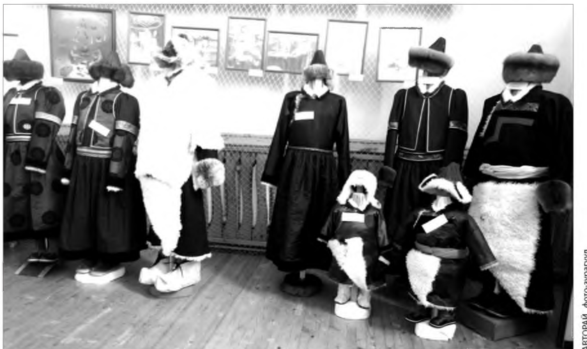
Ц. Бальжинимаевагай «Алтаргана-2012» нааданда илаһан буряад хубсаһан