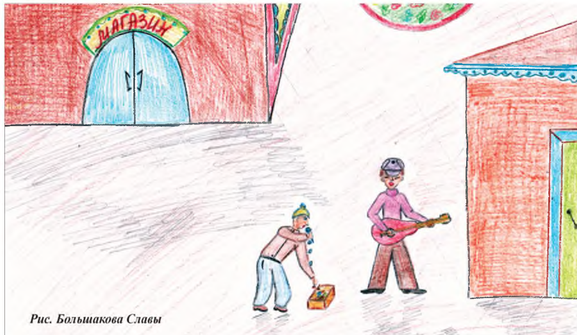
Рис. Большакова Славы