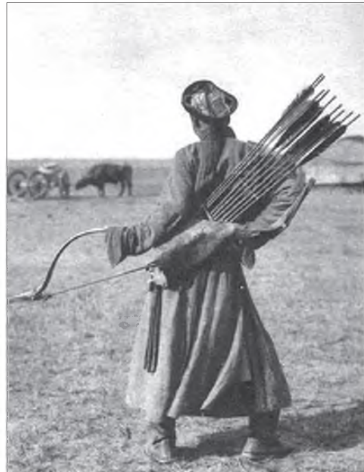
Хитадай Дотор Монголой зүүн тээ Чахарай монгол хур харбагша. Урдаһаань, хойноһоонь буулгаһан фото-зураг, XX зуун жэлэй 1-дэхи хахад.