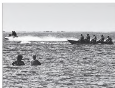
“Банан” дээрэ бата һуунабди