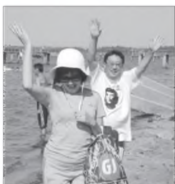
Амар сайн, алдарт Байгал!