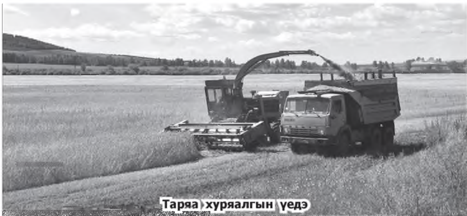
Тарья хуряалгын үедэ