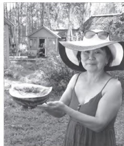
Амтатай даа арбуз!