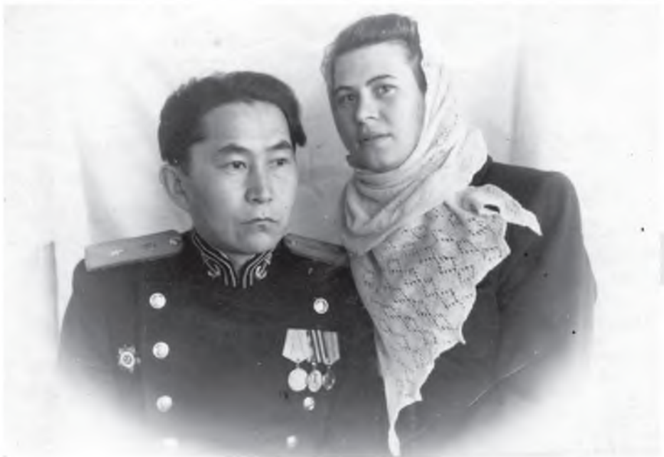
“Мирра дүү басагандаа Антонноо, ханажа ябахыншни тула. Октябрь, 1949 он”