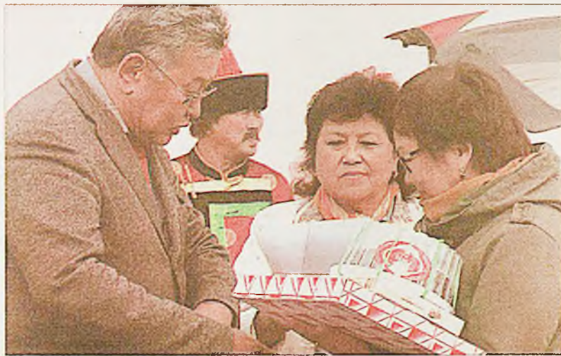
Бэлэг сэлэгүүд эрхимлэгшэдтэ