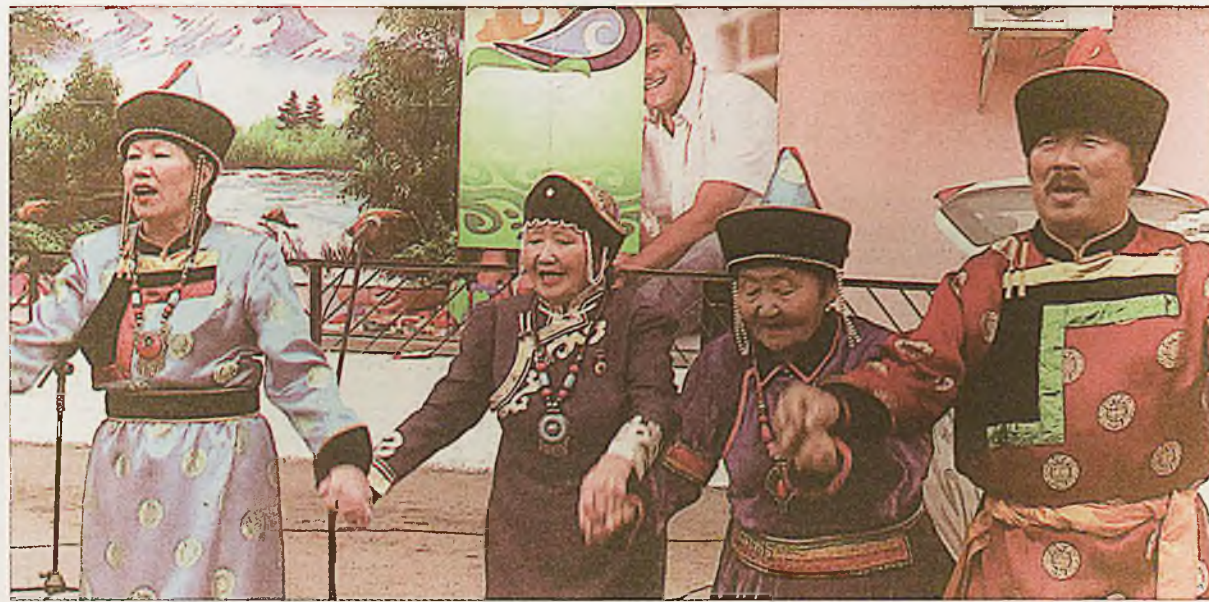
Ямар наадан найхан бэ, ёохор наадан найхан лэ