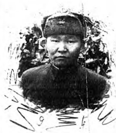
Нүхэр Шурада удаан болон найнаар дурсажа ябахын тула Арсаһаа. Хани нүхэсэлөө мартангүй, һанажа ябаарай. Примори, Ханка нуур. 1941 он.