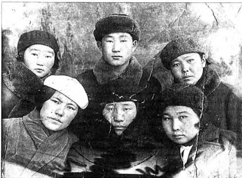
Боохоной багшанарай училищин оюутад, 1940