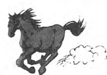
Эмнигэй хурдаар Мори хээрэй. Эсэгийн хургаалаар Заабари хээрэй.

Буряад зомнай урда саһаа хойшо өөрынгөө унажа ябаһан мориёе морин эрдэни гэжэ нэрлэдэг. Морин хадаа мал ажалтай байһан буряад зонной ажабайдалда тон ехэ удха шанартай байһан гээшэ. Морёор малаа адуулхаһаа эхилээд, хамаг гэр зуурынгаа хэрэг бүтээдэг байгаа. Үгышье наа, ямар нэгэн аюулай тохёолдобол, морин аюулда дайрагдаһан эзээ гэртээ асарха гу, али моринойнгоо эзэгүй һула ерэбэлнь, гэртэхиниинь бэдэржэ ошодог байгаа. Тиимэһээ буряад зон моринойнгоо үүргэ тон дээгүүр сэгнэдэг байһан гээшэ. Гансал мориёо найнаар харууһалхаһаа гадна, буряад араднай аялга дуундаа агта мориёо магтан дуулаһан байдаг.