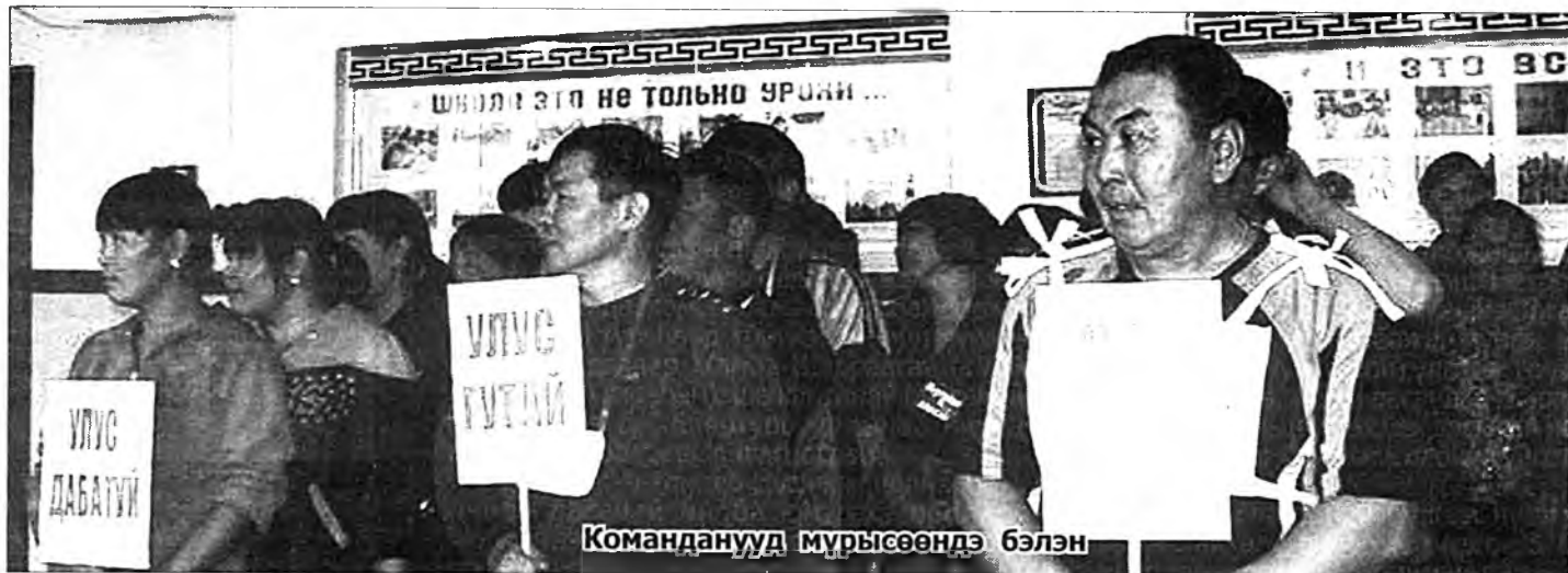
Команданууд мурьсөөндэ бэлэн

Жэлэй дүрбэн сагые хаража үзэхэдэ, олон зондо намарай саг найшаагдадаг. Энэ үедэ хүн зон үбһэ, холоомоёо оруулдаг, малайнгаа эдэс бэлдэжэ, үбэлөө хүнгэнөөр үнгэргэнэ. Огородой, хангайн хэшэг ба бэшэ витаминтай эдээн элбэг бэлдэгдэнэ.