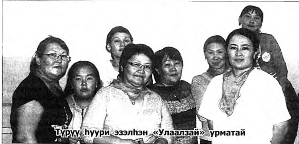
Түрүү һуури эзэлһэн «Улаалзай» урматай

Хүхюун мурьсөөнүүд арбан шатаһаа бүридөө. Эндэ Улаан-Хадын хормойдо һууһан «Улаалзай» гэжэ команда онсо шалгараа. Команда бүхэндэ нааданай дүримөөр 3-3 эршүүл ба эхэнэрнүүд байгаа. «Улаалзай» командын эршүүл бээрээ үндэр, томонууд, бар хүсэтэйнүүд байжа, канат таталгаар 1-дэхи һуури эзлээ. Энэ хоёр ехэ мурьсөөндэ «Яхадай эрдэни шулуунууд» хоёрдохой һуурида