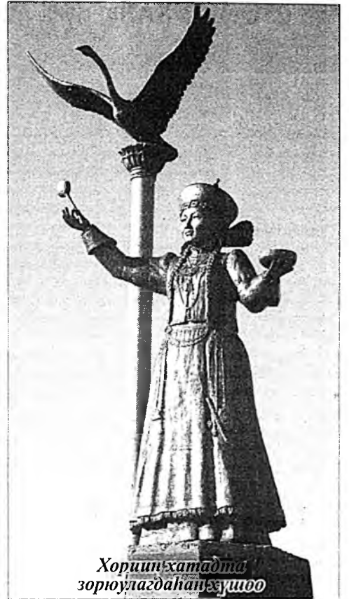
Хориин хатадта зориулагдан гэжээ

- Тэнэг юумэ бү хэлэл даа. Энэ үнгэрһэн детективтэш ши бидэ хоёрһоо үлүүгээр зобоһон хүн байхагүй. Тэрэ «тайзан» дээрэ байгша гурбанайш мүнөө «шатар» табижа байхань - нохойн наадан ааб даа. Дүүжэн дээрэ һуугаад, нэгэ тэнгэри өөдэ хийдэжэ, нэгэ газар руу мухаряад абаһанаа жаргал гэжэ бодохо.