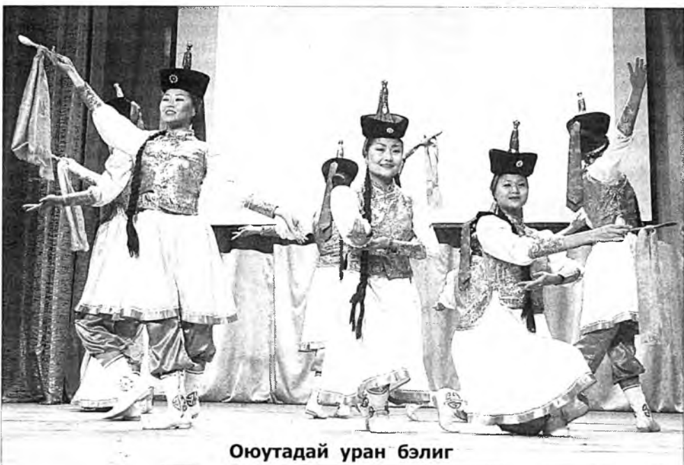
Оюутадай уран бэлиг