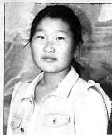
Нангин тээшэ залана – Иимэл минии тоонто!

УШХАЙТАМНИ Уужам тэнюун Ушхайтам Шэмэтэй ногоон талатай, Хурьгад найхан аршаантай, Ажалша арад зонтой – Иимэл минии тоонто! Түрэнэн гараһан нютагайм Арюун найхан Субарга Манай сэдхэл заһана,