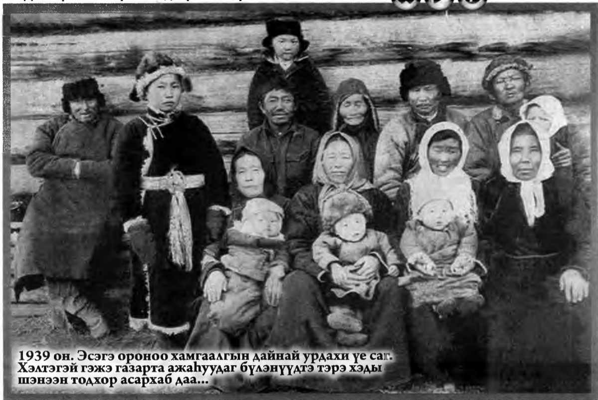
1939 он. Эсэгэ ороноо хамгаалгын дайнай урдахы үе саг. Хэлтэгэй гэжэ газарта ажаһуудаг бүлэнүүдтэ тэрэ хэдэ шэнээн тодхор асархаб даа...