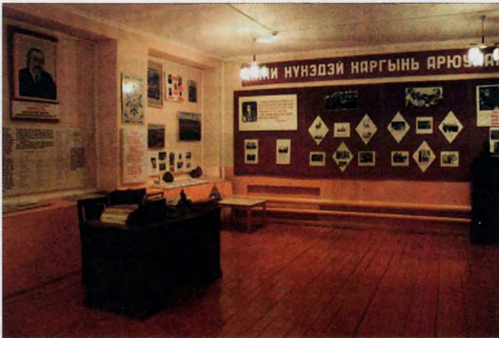
Г.Г.Чимитовэй музей соо