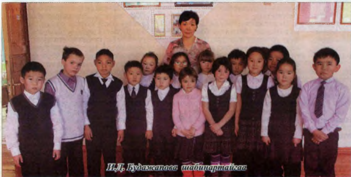
Ш.Д. Будаевагай шабинартайгаа