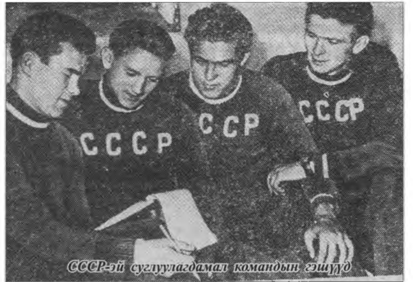
СССР-эй суглуулагдамал командын эшүүд