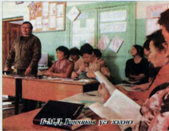
Б.М.Д. Ганчиков үгэ хэлэнэ

- Би басагайа буряад класста оруулхам. Түрэл хэлээ мэдэхэ ёһотой. Сугтаа хүдэлдэг нүхэдни, багша хүнэй үндэр үүргые ханажа, бултадаа хүүгэдтэ буряад хэлэ үзүүлжэ, зоной урда жэшээ болое!