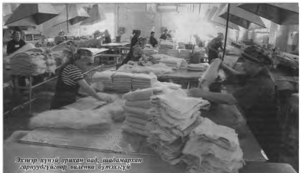
Эхэнэр хүнэй урихан аад, шадмархан гарнуудгүйгөөр валенка бүтэхэгүй

болишоно. Тиихэдэнэ манай үйлдвэри наатана. Тиимэ хэн тула хайрсагуудаа өөһэдөө хэжэ һураха ханаатайбди.