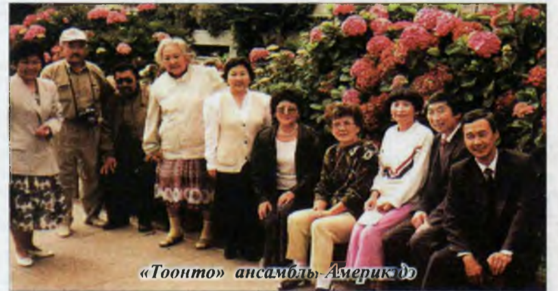
«Тоонто» ансамбль Америкта

Тиигэжэ дүрбэ дахин хүршэ Монгол орондо (1991, 1994, 1997, 1999 онуудта) айлшалжа, бэлиг талаангаа гэршэлһэн байнабди. Удаань Хитад орон хоёр дахин ошожо, арадайнгаа аман зохёолтой танилсуулаа һэмди. 1996 ондо аяар холын Америкын Калифорниин штат ошожо, Сан-Францискада бэлиг шадабарияа харуулха талан тудалдаба. Тиигээд хоёр дахин үзэсхэлэн гоё Франци, түрүүшынгээ гастрольдо Голландитайгаарнь ябажа ерээбди. 2004 ондо гайхалтай найхан орон гүүлүүлдэг Италяар гастрольдо харын туршада Викто-