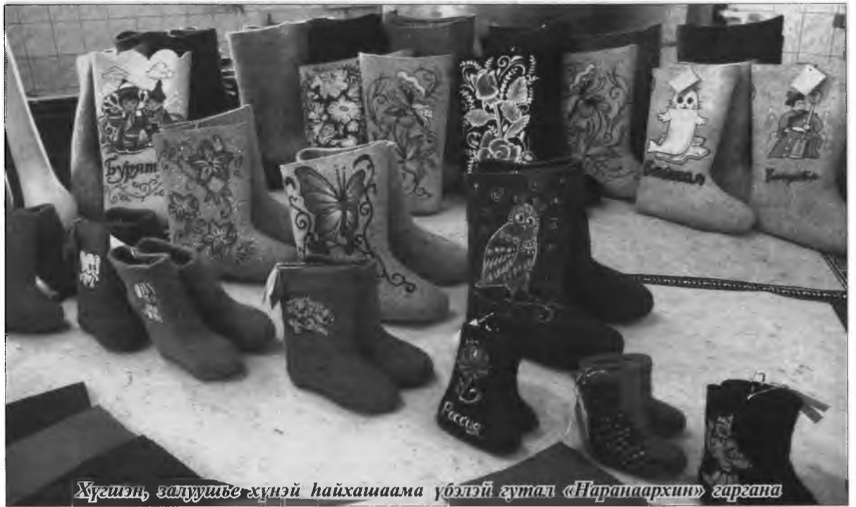
Хүсшэн, залуушье хүнэй хайшаамаа үбэлэй гутал «Наранархин» гаргана

Хилын саана Финлянди, Канада, Монгол гүрэнүүдтэ «Наран» үйлдвэридэ бүтээгдэнэ гутал болон бусад бараан наймаалагдаһан байна.