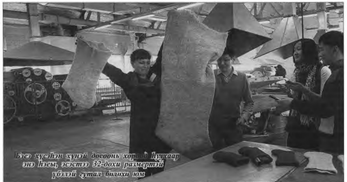
Бээ хүсшэн хүнэй доосоон хорлод һуужаар энэ нэеы, эсэстэ 32-дохи размертэй үбэлэй гутал болохи юм