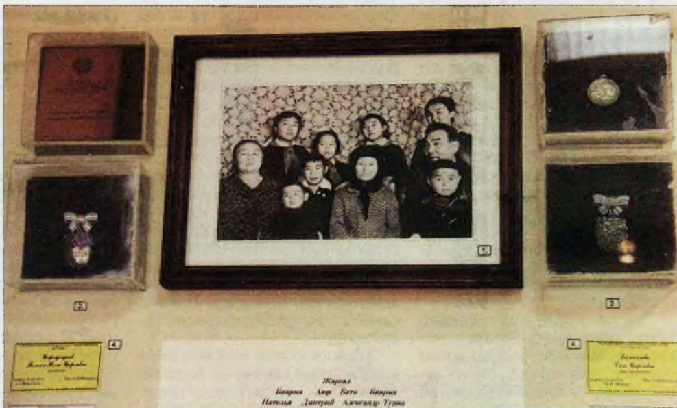
Ц-Д.С.Семеновой дурасхаалай таһалта