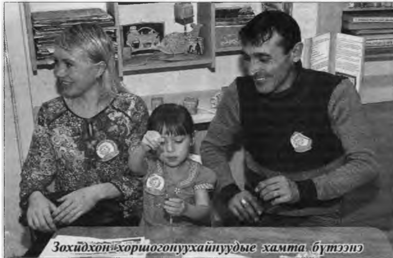
Зохидхон хоршононуухайнуудые хамта бүтээнэ

Зүблэлтэ засагай үедэ мүнглэмэл саарһа олохо гэгээнмай бэрхэтэй бэлэй. Сайн, үнэтэй шэээр, тамхи-нуудай саарһа суглуулдаг байгаа.