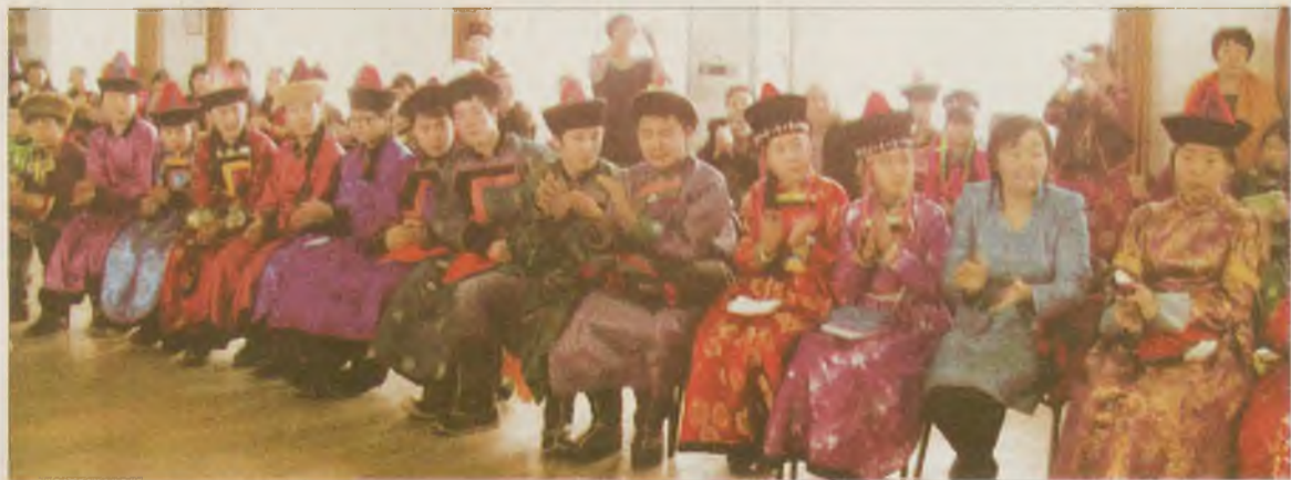
Буряад хэлэнэй мурьсөөндэ хабаадаһаа дүн хамта 47 команда хүржэ ерээ