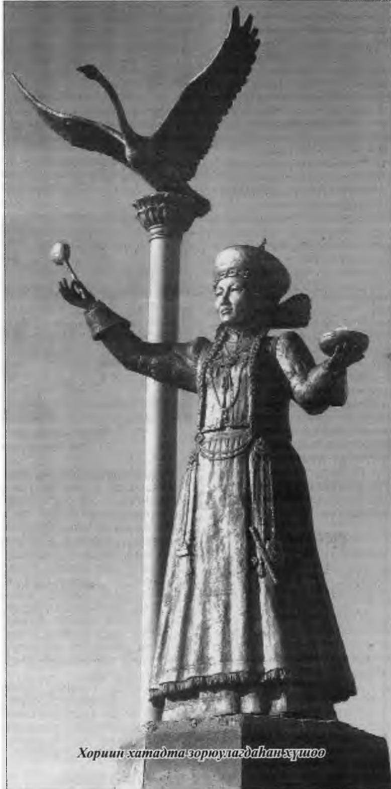
Хориин хатадта зориулагдан хушоо

- Зүб даа! - гэжэ үбгэжөөл зүбшөөбэ. - Ара зонойнгоо зохёоһон захяа үгэнүүдые гэхэ гү, оньһон үгэнүүдые хараад үзэбэл, үнэхөөрөөл гүн удхатай даа. Энэндэ жэшээнүүд олон ааб даа: «Субажа ябаһан барасһаа сугларжа нууһан шаазгай хүсэтэй». «Шадалтай хүн шүдхэр зараха, аргатай хүн арсалан унаха».