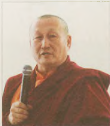
XXIV Бандида Хамба лама Д.Аюшеев Буряад хэлэнэй хайндэрэй нээлгын үедэ

Хурса хэлэтэй хүн ямаршые сагта сэнтэй байһан. Ушар иимэһээ XXIV Бандида хамба лама Дамба Аюшеев буряад үгүүлэл зохёожо, олоной һонорто уншагтылши гээд үхибүүдтэ амяараа конкурс зарлаба.