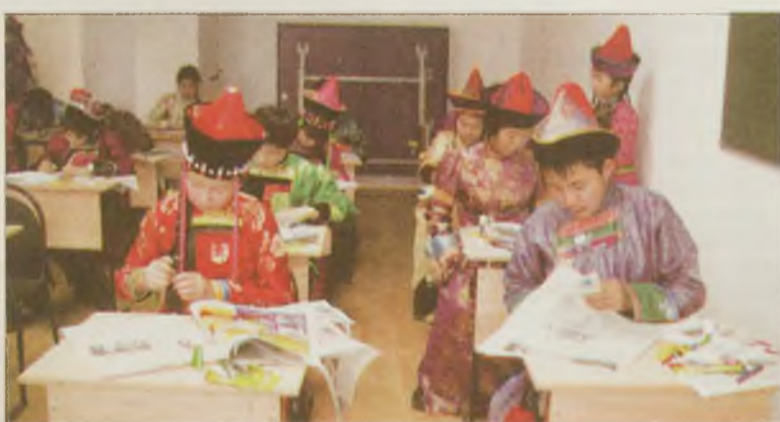
"Информ-полис" буряад хэлэн дээрэ гэжэ конкурсдо хабаадагшад

Мурьсөөнүүдтэ хабаадаһан хүүгэд хото хүдөөгэй гэжэ илгарангүй мурьсэхэдөө, тон адли эрхэтэй байба. Нэгэ хэлэнһээ нүгөө хэлэндэ юумэ оршуулжа хураһан тулада хүн хадаа дээдэ хургуулида адагынь 5 жэл хуража гарана ха юм даа. Удаан олоһон мэргэжэлээрэ ажалда орожо, аха захатанһаа гашай гэшые һайса эдихын хүсөөр оршуулга хэжэ һурана. Иимэ хэн тула үхибүүдтэ дан хатуу эрилтэнүүд табигдаагүй гэжэ ойлгохо шухала.