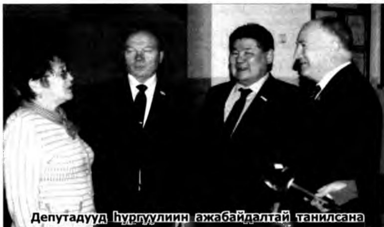
Депутадууд хургуулиин ажабайдалтай танилсана