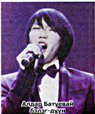
Алдар Батуевай бэлэг-дуун