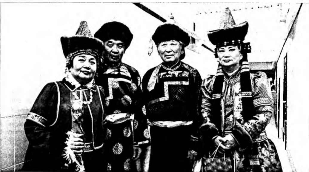
Дымбрыловтэнэй гэр бүлын ансамбль