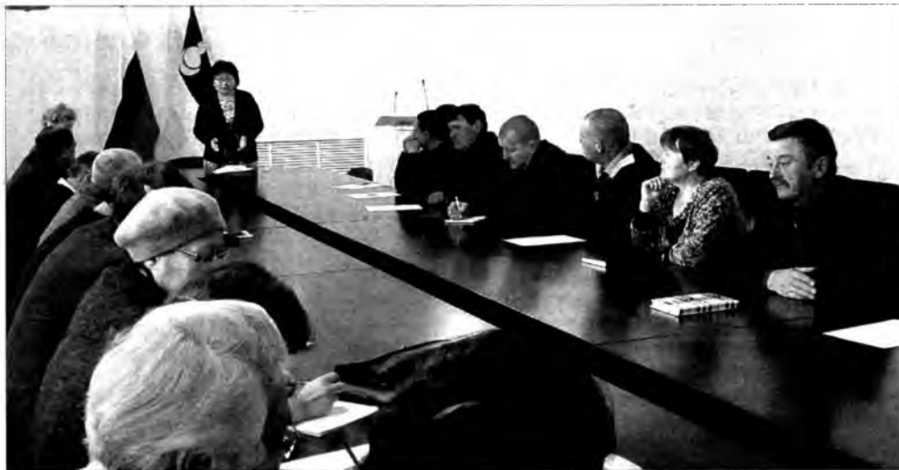
Хүдөө ажахын яаманай нүүдэл зүблөөн боложо байна

Петропавловкын комбинатай гаргаһан продукция Улаан-Үдын, Буряадай аймагуудай хүнэһэнэй дэлгүүрнүүдтэ хүрэжэ ошоно.