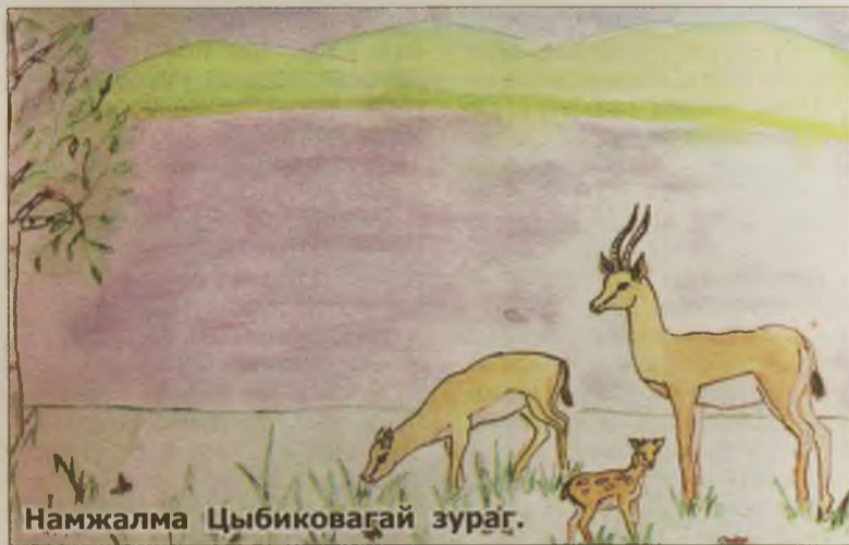
Намжалма Цыбиковагай зураг.