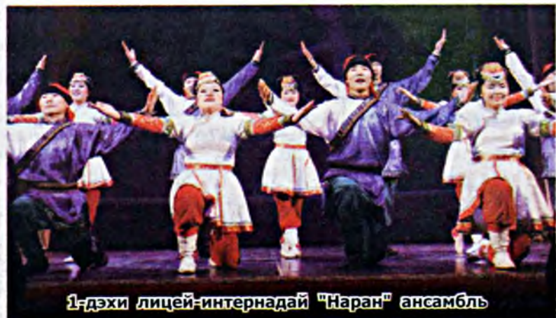
1-дэхи лицей-интернадай "Наран" ансамбль