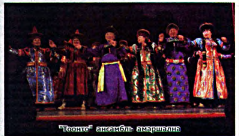
“Тоонто” ансамбль амаршална