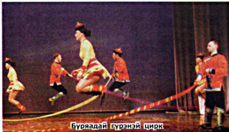
Буряадай гүрэнэй цирк