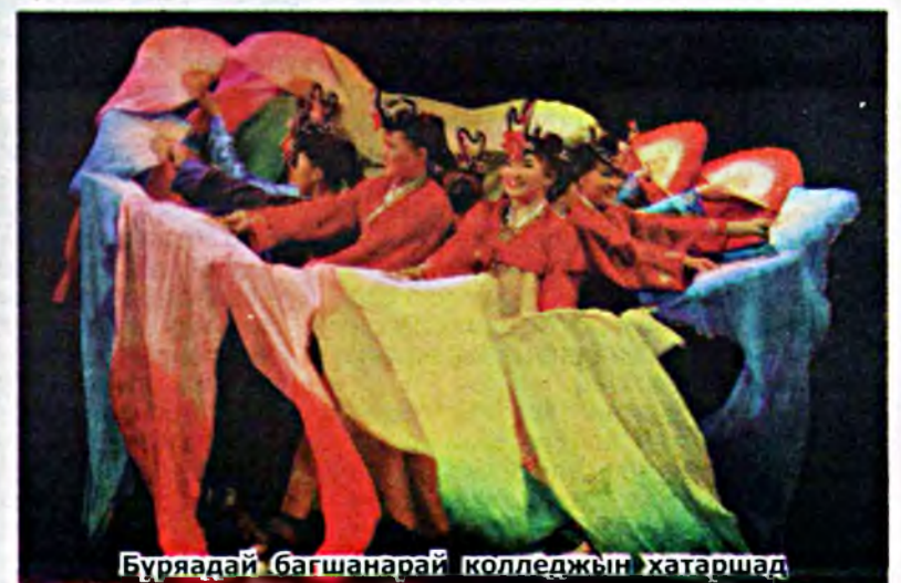
Буряадай багшанарай колледжын хатаршад