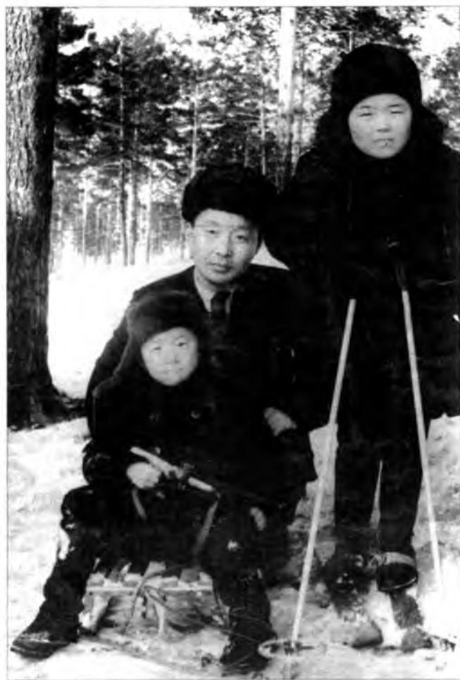
фото-зурагууд гэр булын архивнаа