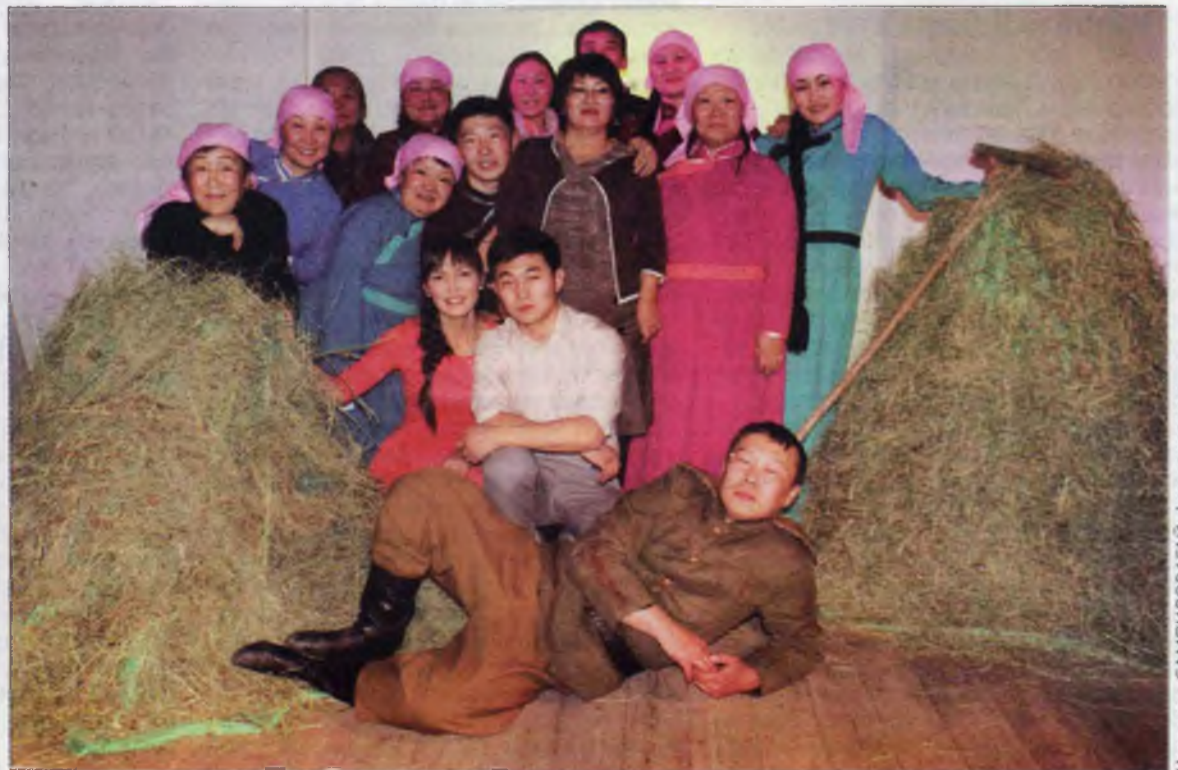
Цырегма САМПИЛОВАГАЙ фото-зургууд

24 декабря в 13.00 состоится премьера новогоднего шоу «Мадагаскар» при поддержке Администрации Главы РБ и Уполномоченного по правам ребёнка в РБ