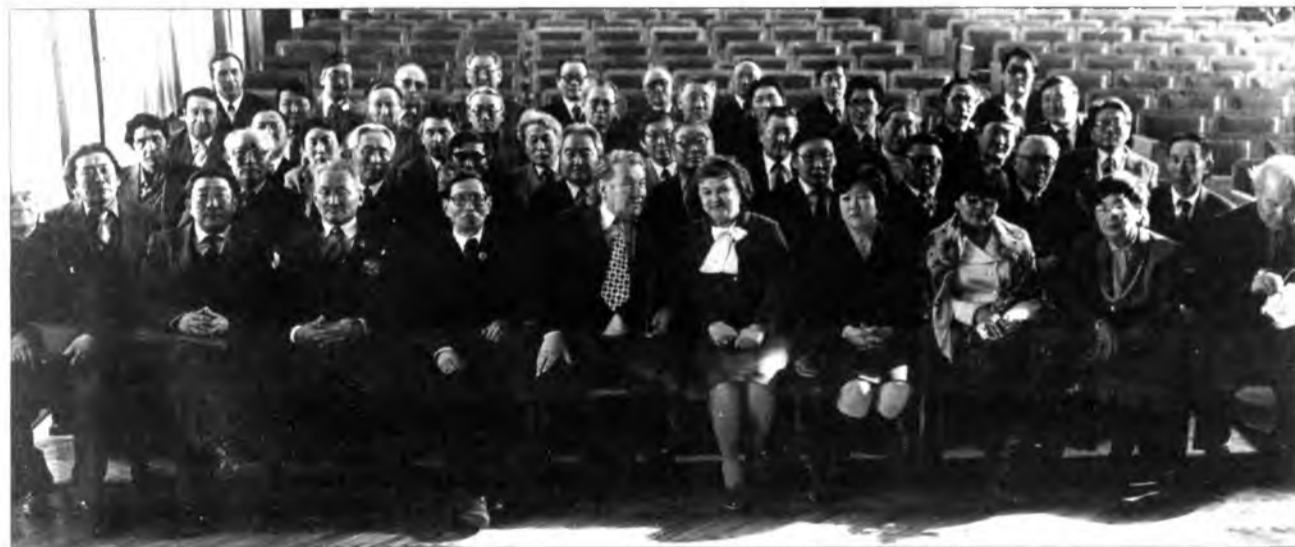
▼ Уран зохёолшодой дүхэриг соо