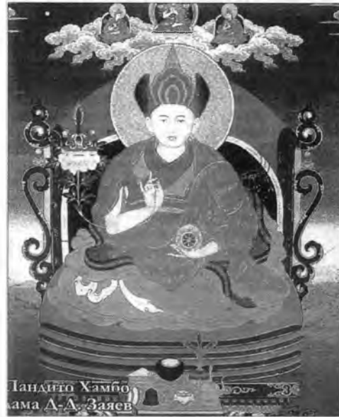
Бандида Хамба-лама Д.-Д.Заяев

“Пандито Хамбо-лама” гээд ородоор, «Бандида Хамба лама» гээд буряадаар хандаха зэргэтэй. Бандида Хамба ламын түшаалда ламанар хунгагдадаг юм. Урдань тиймэ байгаагүй. Нэгэдүгээр Бандида Хамба лама Дамба-Даржаа Заяев энэ түшаалаа түрэлзйнгээ лама Содномпил Хетырхеевтэ дамжуулаа нэн. 1853 он болотор энэ түшаал хатагин угай Ишижамсуевтанай гэр бүлэ дотор уг залгуулан дамжуулагдажа байгаа. Тийн Дымчик Ишижамсуев урда тэнь Хамба лама байһан Жимба Ахалдаевтай (1712-1797) шунан түрэл юм. 1801 ондо түшаалаа Гаван гэжэ дүүдээ дамжуулаа. 1835 ондо бүхы дасангуудай түлөөлгшэд сугларжа, анха түрүүшынхыё Хамба ламые хунгаа бэлэй. Тэрэнэй дүнгүүдээр Ишижамсуевтанай бүлын түлөөлгшэ Чойван хунгалтада илажа гараа нэн. Тэрэнһээ хойшо хунгалтын гурим нэгшье эбдэрээгүй.