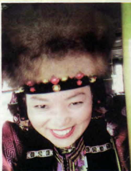
Соборова Эржин Соведэй талмай дээрэ автобус соо.