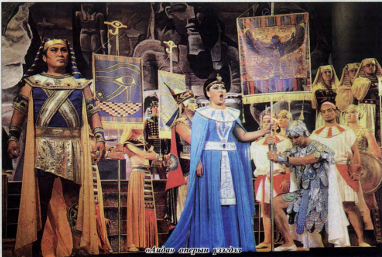
«Аида» оперын үзэгдэл